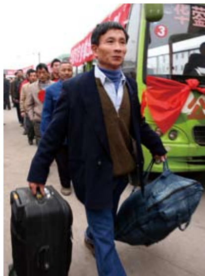
2010年2月23日,四川省华蓥市2010年农民工成建制劳务输出活动在明月镇正式启动。首批300名农民工免费搭乘政府组织的“爱心客车”前往广东打工

从历史经验看,农村劳动力向非农产业和城镇转移,是世界各个国家向城镇化发展的普遍规律,也是迈向现代化的关键一步。目前中国正以每年0.8%至1%的速度城镇化,正经历着人类历史上最大规模、最快速度的城镇化过程,农民工群体无疑是这一发展过程的一大重要推动力。对他们的权利给予更多的尊重和保障,不仅是构建“以人为本”和谐社会的要求,更是时代发展的必然要求。✘