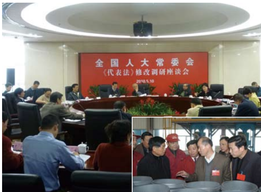
▲按照2010年立法工作计划，代表法修改的调研工作正在紧锣密鼓地进行。现行代表法于1992年颁布实施，18年来在完善人民代表大会制度、推进社会主义民主法制建设中发挥了重要作用。