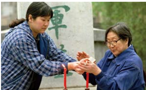
余家秉义守忠墓,自明至今300年

崇祯皇帝心中没有国家,自然也就不会有真正的法律治理。法律是国家意志的体现,是由国家制定或认可的,由国家强制力保证实施的行为规范。自古以来,