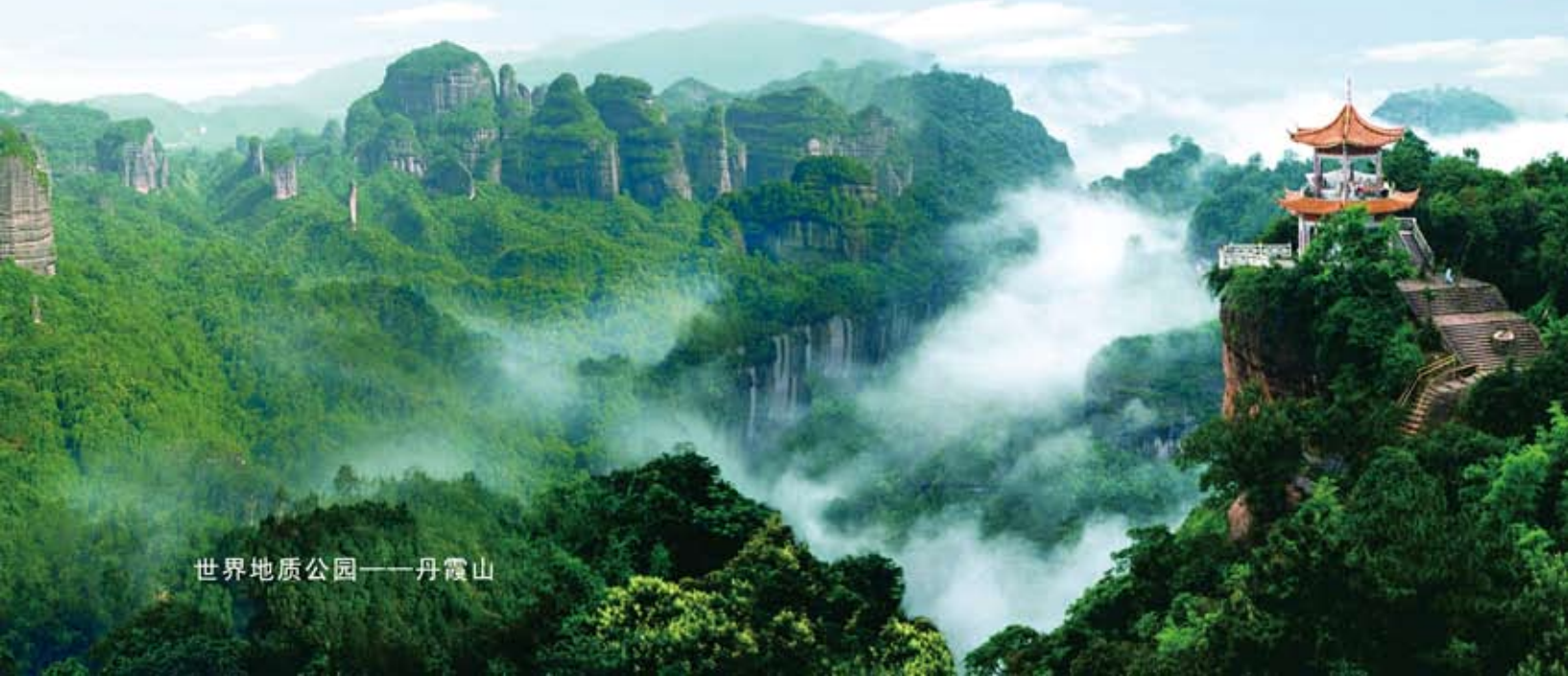
世界地质公园——丹霞山

→中国优秀旅游城市 →全国双拥模范城 →中国金融生态市 →中国锌都 →国家卫生城市