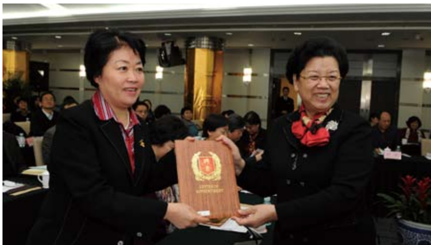
2010年1月29日,女性高层次人才成长状况研究与政策推动项目启动会在京举行。图为陈至立为全国人大常委会法工委副主任信春鹰颁发聘书