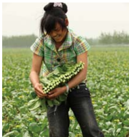
农村妇女土地权益问题一直困扰着她们的生活

陈至立: 是的。我们要抓住这次执法检查的机遇,进一步推动保护妇女合法权益的法律法规政策措施落实,推动维权工作的新突破。我相信,这次对妇女维权重点问题进行的深入调查,一定能够为研究问题、推进问题解决和完善法规政策打好坚实的基础。✱