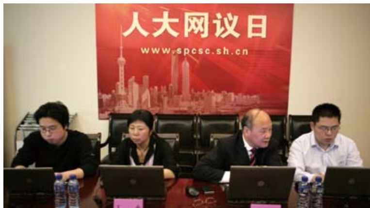
▲5月10日，一场以“文明观世博”为主题的“人大网议日”活动由上海市人大常委会组织进行。上海市人大代表与广大网友进行互动交流。从2005年开始，半个月组织一次的“人大网议日”已经成为上海的“市民例会”。