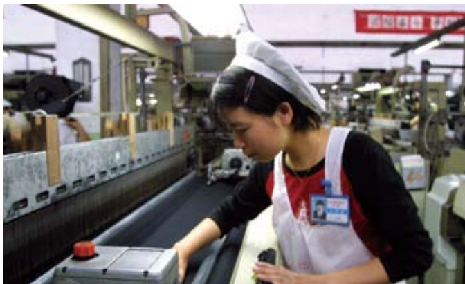
华西村设计了“远看像林园,近看是公园,细看是农民生活乐园”的规划。图为华西村特种化纤总厂的工人在纺线联合机上精心作业

华西在人才的选拔、使用和培养上,做到了内培外引。华西选拔优秀青年到中央党校学习,鼓励支持职工自学,参加自考,使取得大专、大学、研究生学历的员工达到3500多人。在村内,华西不仅开展了群众性岗位练兵和技术技能比赛,而且定期不定期地开展篮球、足球、歌舞等业余文体活动,丰富了工作人员的文化生活,陶冶了他们的思