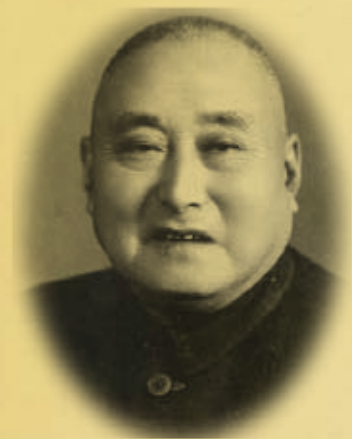
黄炎培 (1878—1965 年)