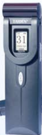
HCS-5100R 系列 数字红外接收机