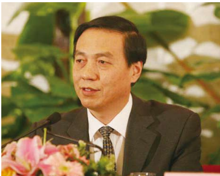
尹成杰副主任委员

二是农民工的维权意识和择业理念不断提高。农民工的法制意识、维权意识都在增强,农民工择业的工资标准、社会保障条件等要求也明显提高,不再是“饥不择岗”,所以对工资低、保障差、工作危险大的岗位,农民工应聘