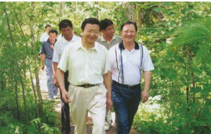
伊春市人大常委会部分组成人员视察小兴安岭生态功能区建设情况

专题调研,先后两次听取审议专项报告,又组织代表对基层卫生网点建设情况进行视察,进行了长达两年的跟踪问效,经共同努力,较好推动群众就医问题解决,在很大程度上缓解了人民群众看病难、看病贵问题。再如,2008年抓住群众关心关注的改善居住条件问题,认真听取审议了市政府这方面工作专项报告,提出要完善