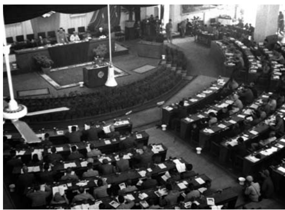
1949年9月，中国人民政治协商会议第一届全体会议通过了《中国人民政治协商会议共同纲领》

共同纲领是中国历史上第一个人民的建国大纲，对新中国的国家性质、政权体制、基本政策等重大问题作出了明确规定，因而是当时“全国人民的大宪章”，实际上“起了临时宪法的作用”。由于当时解放战争还没有结束，全国范围内的人民群众还没有充分组织起来，经济也需要一个恢复时期，尚不具备召开在普选基础上产生的全国人民代表大会的条件，只能采取由中国人民政治协商会议代行全国人民代表大会职权的过渡办法。