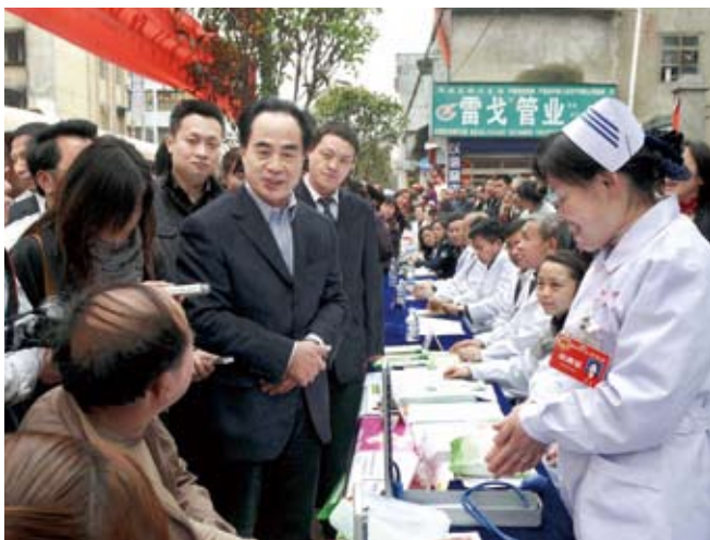
重庆市人大常委会主任陈光国（中）带领部分市人大代表走上街头，询问医生为百姓义诊情况