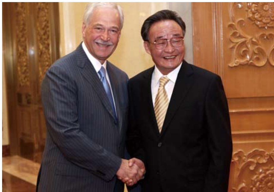
◀5月18日，全国人大常委会委员长吴邦国在北京人民大会堂与俄罗斯国家杜马主席格雷兹洛夫举行会谈。