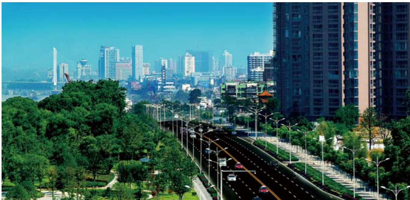
宜昌成为全国首个用规范性文件对城市绿地进行永久性保护的城市

近年来,宜昌市人大常委会还先后就政府利用银行贷款加快建设火车站配套工程,筹集平湖半岛棚户区改造等项目建设资金,加强法制宣传教育,加强自身建设等重大事项作出了决议、决定,这些决议、决定的落实为宜昌的城市发展和民生改善起到了重要的推动作用,在提高人大威信的同时,也拉近了人大与民众的距离。✎