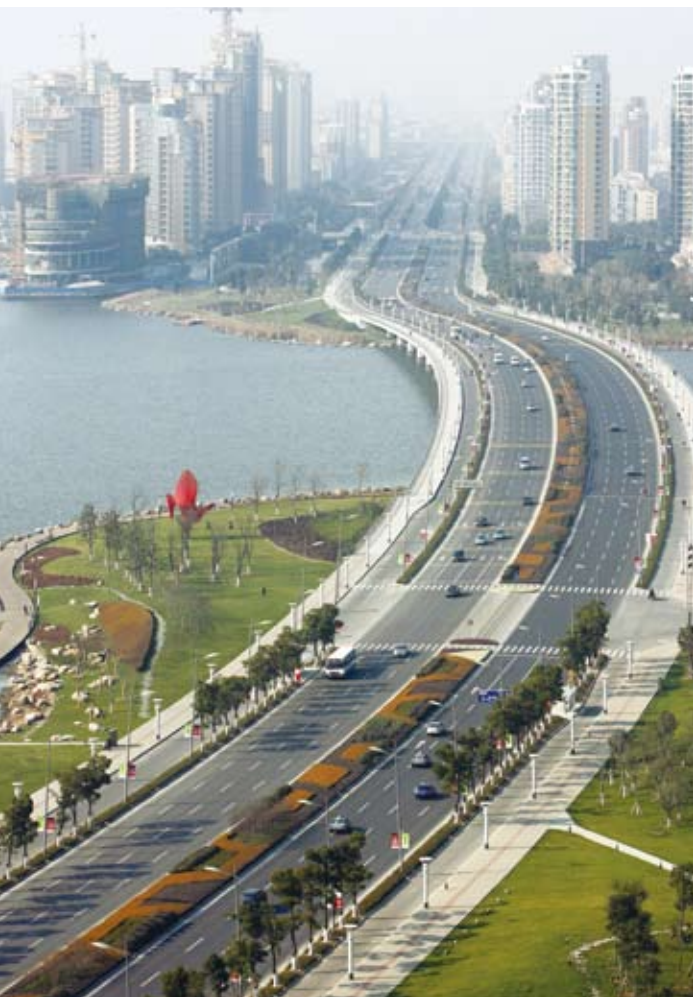
苏州工业园区金鸡湖

2010年的市人代会,“加强生态文明建设”的议题成为代表和社会各方面高度关注的“亮点”。在23件议案中,有11件是环境保护、生态补偿、空气质量治理、蓝天工程等方面的内容,其中“尽快制定实施生态补偿办法”的议案,多达24位代表联名。代表们对市人大常委会作出加强生态文明建设的《决定》由衷地给与高度评价,认为通过关于加强生态文明建设的决定,这在全国尚属首创,开了个好头。☑