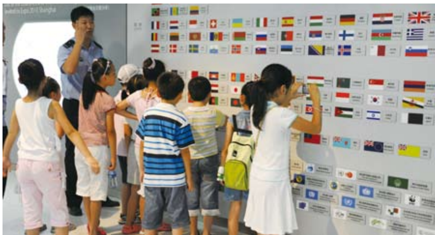
为进一步激发全体市民的东道主意识,将广大市民积极参与世博的热情转化为关心城市发展、提升综合文明素质的自觉行动,在“世博倒计时一周年”之际,上海市人大常委会联合区县人大开展“优化法治环境、共铸世博精彩”等主题活动

胡锦涛总书记在视察上海世博会筹办工作时提出,要着眼长远,谋划好“世博后”这篇大文章,最大限度地把握举办世博会带来的无形资源转化为推动经济社会发展的现实优势。上海市人大常委会主任刘云耕提出,上海市人大常委会要继续在市委的正确领导下,以时不我待、只争朝夕的使命感和紧迫感,继续做好“依法办博”的大文章,切实做到“三个结合”。即把确保世博会成功举办与运用法制手段推动放大世博后续效应结合起来,服务世博与日常性履职结合起来,世博会留下物质成果和精神成果结合起来,尤其要充分运用法制手段推动放大世博后续效应,推动政府把世博会筹办期间的成功经验以及行之有效的一些临时性行政管理措施转化为常态化的城市管理制度,为上海地方立法的完善积累宝贵的经验,为上海的可持续发展增添新的动力。★