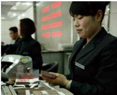
2010年4月12日，胡锦涛主席在华盛顿会见美国总统奥巴马时强调，中方推进人民币汇率形成机制改革的方向坚定不移