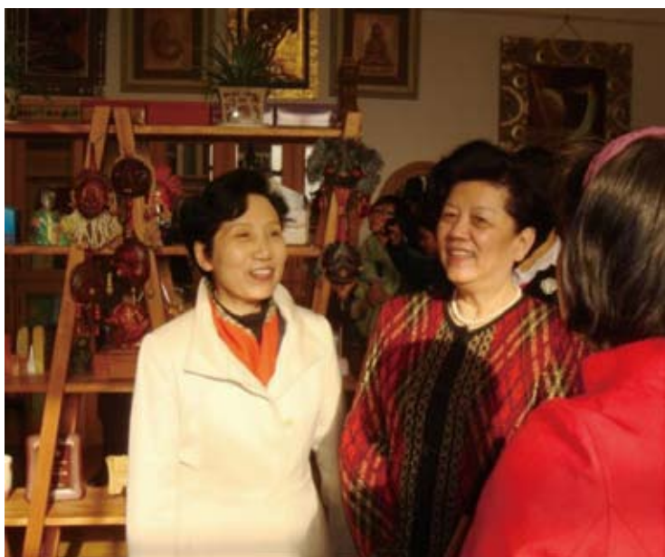
2010年4月7日下午，陈至立副委员长（左二）一行来到南京曙天艺术开发有限公司，调研女性小额担保贷款情况

全国妇联还联合有关部委制定了《关于预防和制止家庭暴力的若干意见》，推动27个省区市出台了法规和规范性文件；提出了预防和制止家庭暴力专门立法的建议稿，下一步是要争取早日将预防和制止家庭暴力列入国家