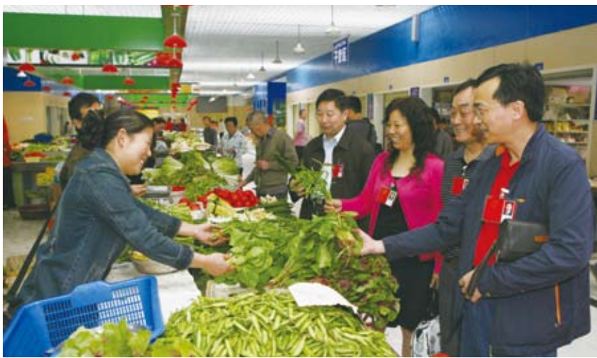
宜昌市人大代表在夹湾路菜市场实地走访调研

委会会议上受到关注,为了更好地督办代表议案,切实解决人民群众普遍关心的“买菜难”、“卖菜难”和食品安全问题,市人大常委会会议作出了《关于加强城区菜市场建设和管理工作的决定》。决定中明确指出菜市场是城市居民生活的公益性配套设施,要求市人民政府要严格按照有关规范要求和技术标准,进一步完善城区菜市场规划布局,优化结构。菜市场规划一经确定,任何单位和个人不得擅自改变;要按照有关专项规划和技术标准,加快新建一批标准化菜市场,全面整治改造设施不全、不规范的菜市场,淘汰影响市容环境和居民生活的“马路菜市场”;要进一步加大市场监管力度,规范市场经营行为,不断创新管理方式,探索长效管理机制,加快提升菜市场的管理水平,切实改善人民群众购物环境,确保经营食品安全和人民群众放心。