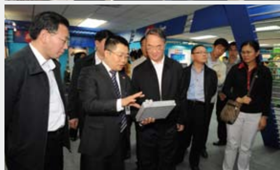
▲科技进步法执法检查正式启动。4月上旬至5月中旬，全国人大常委会副委员长路甬祥、陈至立、桑国卫分别带队奔赴江苏、广东、湖北、四川、上海、安徽等省市进行执法检查。