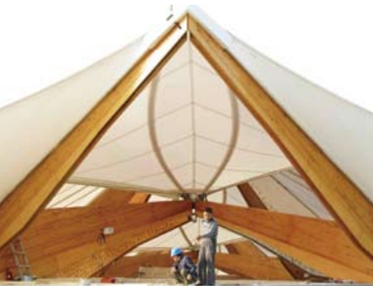
2010年3月25日,上海世博会挪威馆的建筑工人正在施工

“现在应该到了让农民工合理分享经济发展成果上来了,我们不能老停留在解决拖欠工资层面上。”郑功成表示,应该建立正常的工资增长机制,而不能