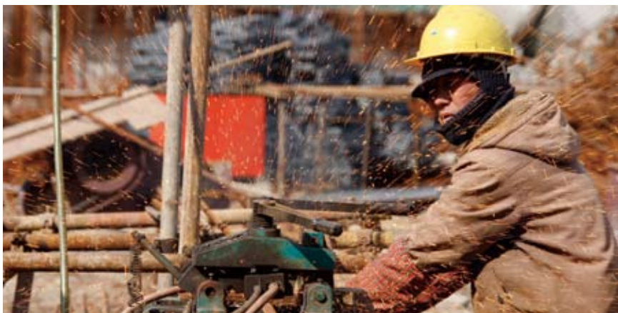
很多农民工从事高危行业,没有必要的防护措施,职业病和工伤事故较多

以上并不是农民工问题的所有内容,农民工问题是一个庞大的课题,还涉及到许多方面,比如,农民工这个称谓是否带有歧视成分?农民工的身份到底是农民还是工人?落户到城镇的农民工是否应该享有农民宅基地以及土地承包权……而且,随着社会的发展,可能还会出现其他新问题,需要不断地研究和探索解决之道。但是,无论怎样,农民工作为我国城镇化过程中出现的特有的群体,他们需要国家和社会真切的关心和重视,才能与其他劳动者一样体面劳动,活得幸福有尊严。★