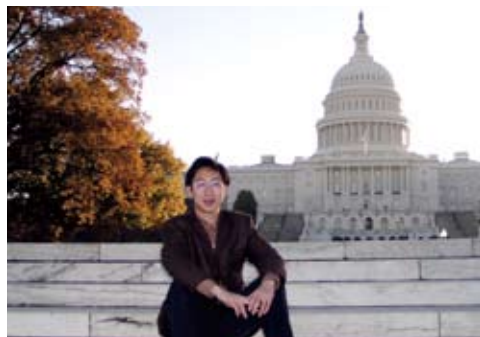
本文作者在美国国会山前留影