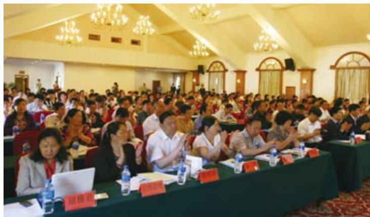
▲5月15日，2010年第二期全国人大代表专题学习班在昆明举行开班式。来自河北、山西、西藏、新疆等地共14个选举单位的150余名全国人大代表参加学习，本期代表专题学习主要围绕社会主义法律体系、宪法、水污染防治法展开。