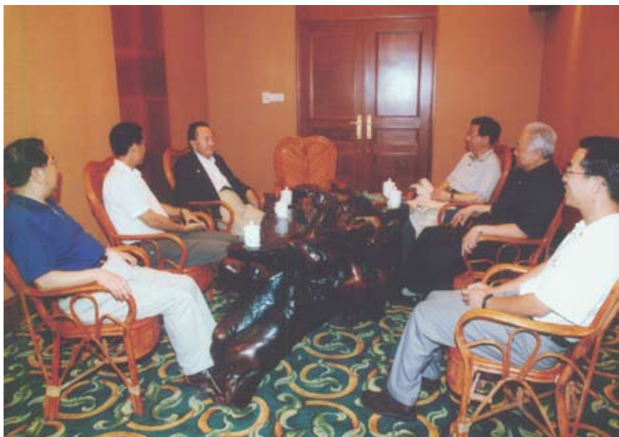
中国全国人大与美国参议院定期会议机制第三次会晤,左三为井上健,右二为盛华仁副委员长,右三为外事委员会主任委员姜恩柱,左一为外事委员会副主任委员吕晓敏

盛华仁最后表示,中国全国人大与美国国会参众两院的会议交流机制已呈现良好的发展态势。双方都希望这个机制能长期坚持下去,不因议会换届而中断,也不因领导人变更而改变。在新的历史时期,我衷心希望这个机制的形式更加完善、内容更加丰富,通过中美议会间的密切交流,进一步推动两国关系健康稳定地向前发展。✘