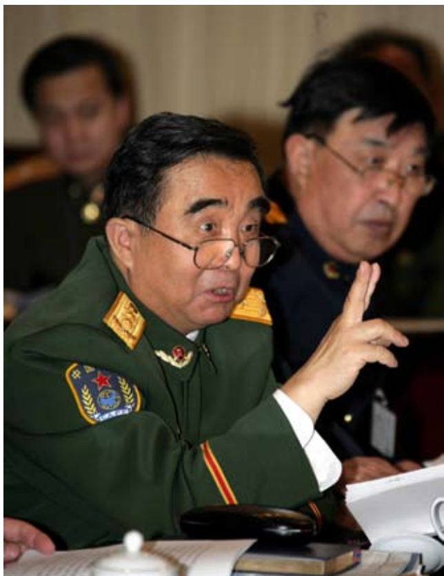
全国人大内司委委员、人民武装警察部队副司令员朱曙光在人代会上发言

朱曙光：武警部队的基本职能是维护国家安全和社会稳定，保障人民群众安居乐业。近年来，武警部队在维护社会稳定方面的任务越来越重，用兵频率越来越高，情况处置难度越来越大，涉法性也越来越强。在国家现行法律中，虽然对武警部队执行安全保卫任务也有规定，但比较零散，缺乏完整性和可操作性。因此，武警部队在实践中出现了一些难以解决的问题：一是由于武警官兵在执行任务中行使部分职权没有法律明确授权，不仅在采取一些措施时容易“授人以柄”，而且经常发生公民和组织对武警部队执行任务的合法性提出质疑和不支持、不协助甚至责难的情形。二是少数武警官兵在正确履行职责的情况下，因部队内部规定在地方不适用而被法律追诉。三是有的目标单位、政府机关超任务范围用兵的情况还确实存在。四是武警部队有关执勤、处突、反恐行动和生活等保障在有些