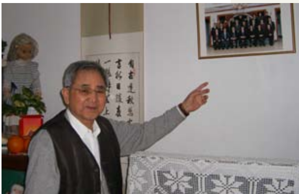
田富达同志在家中

他是一届政协代表中惟一的一位高山族代表。1949年9月参加中国人民政治协商会议第一届全体会议时，他刚满20岁，是第一届全国政协代表中年龄最小的一位。他还是极少数连任一至八届全国人大代表的代表之一，并连续44年任一至八届全国人大民族委员会委员，是我国人大历史上专门委员会委员任职时间最长的一位。