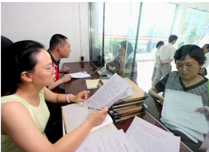
四川省人大常委会信访办工作人员受理群众上访

对一些久拖不决的案件,要求有关部门向信访当事人作出合理解释,并共同探寻解决办法,使监督工作能落到实处。