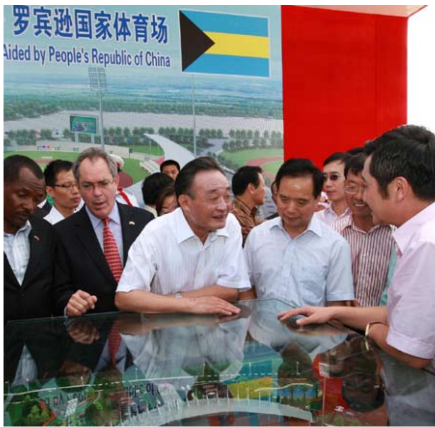
9月5日,吴邦国委员长来到中国援建巴哈马国家体育场项目工地,亲切看望正在那里施工作业的中方工程技术人员和建筑工人,并与巴哈马副总理西莫内特一同为项目标志牌揭幕

国会参众两院建立起定期交流机制,先后与美众议院举行了10次会议、与美参议院举行了4次会议,并带动专门委员会、友好小组、工作机构等多层次、宽领域的交流,为推动中美关系发展发挥了积极作用。今年两国议会领导人成功实现互访,标志着两国议会交往进入新的历史阶段。吴邦国委员长指出,双方应保持这一良好发展势头,围绕两国关系发展大局,保持密切交往,加强定期交流,开展专门委员会、工作机构等多层次友好往来,深入坦诚对话,扩大政治互信,促进务实合作,使议会成为推动中美关系健康稳定发展的建设性力量。美参众两院领导人表示,美国新一届国会希望进一步加强同中国全国人大的友好交流与合作,继续推进定期交流机制建设,为促进中美关系发展贡献力量。