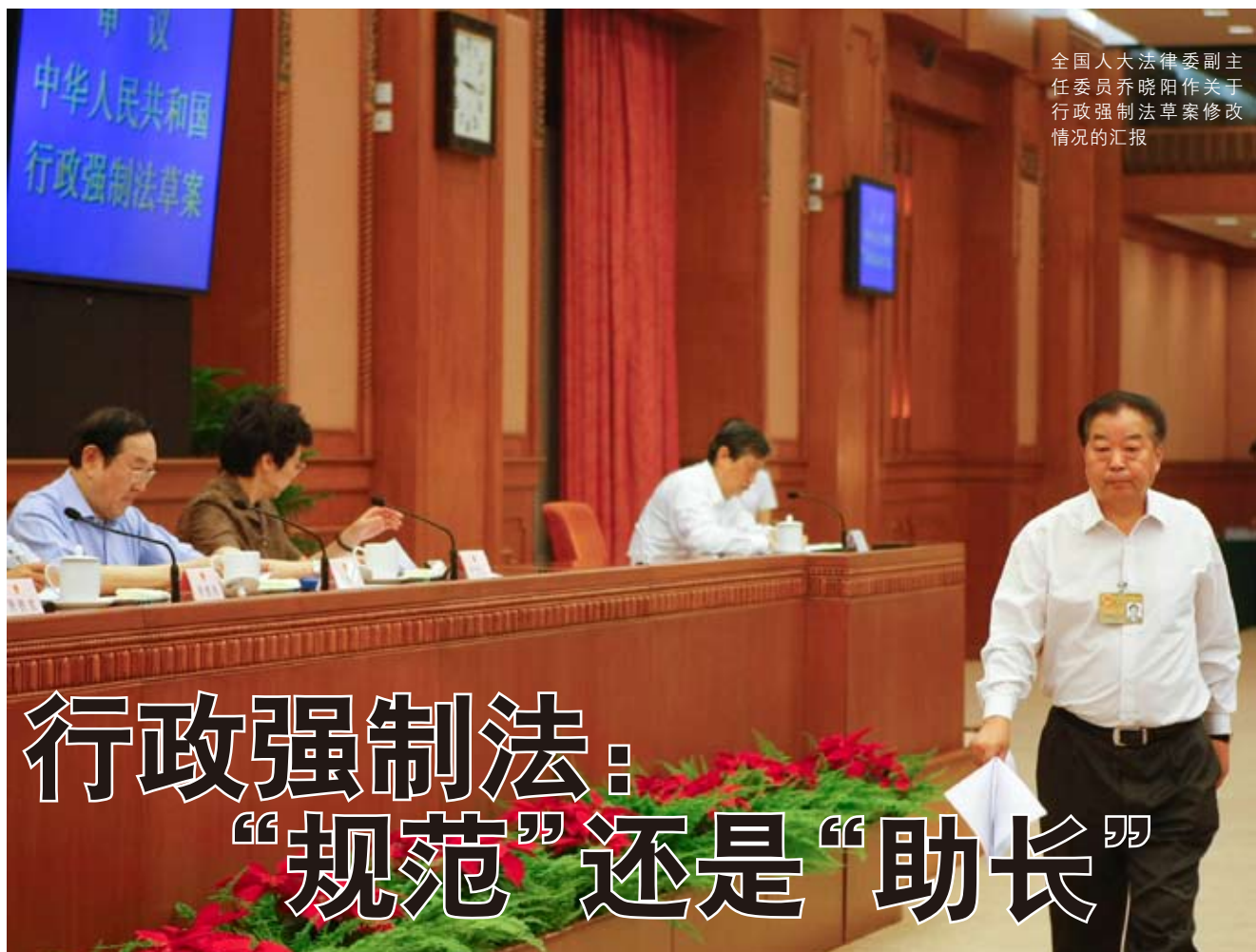
全国人大常委会副主任委员乔晓阳作关于行政强制法草案修改情况的汇报