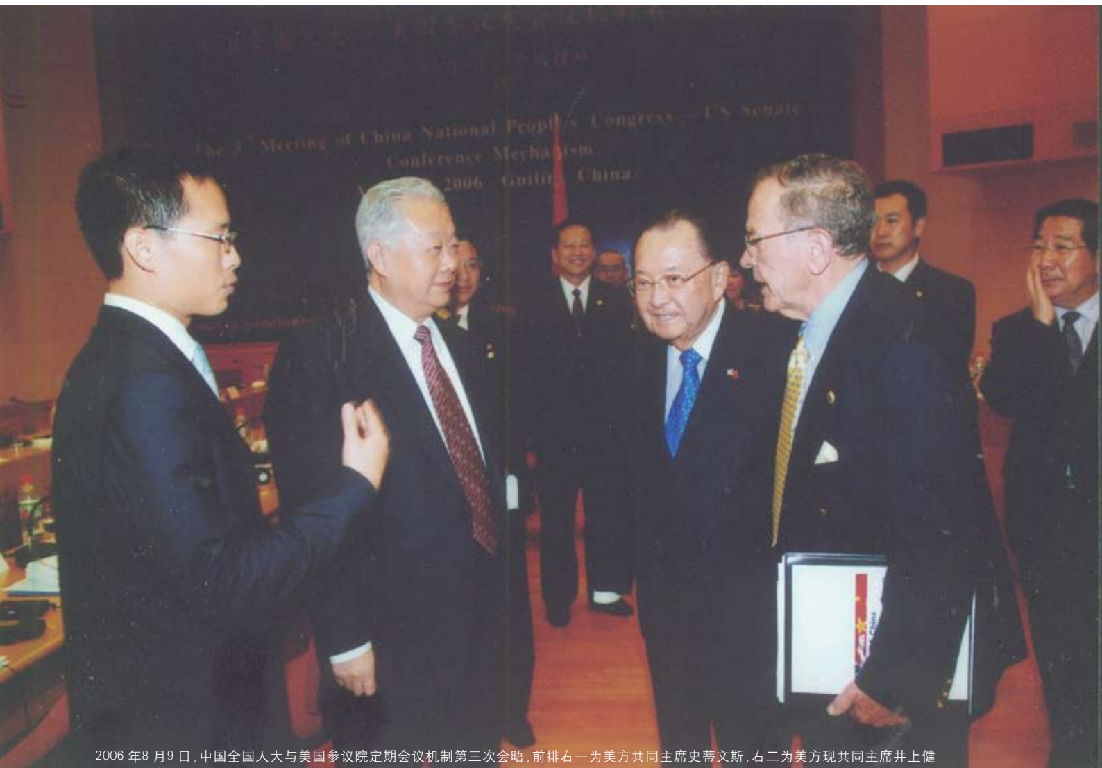
2006年8月9日，中国全国人大与美国参议院定期会议机制第三次会晤，前排右一为美方共同主席史蒂文斯，右二为美方现共同主席井上健