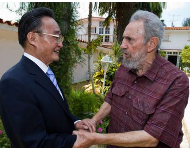
9月3日上午,吴邦国委员长在古巴哈瓦那亲切探望古巴共产党中央委员会第一书记菲德尔·卡斯特罗

政府将继续坚持中古长期友好方针,扎实推进各领域友好合作,不断提升双边关系水平,更好地造福两国人民。古巴领导人表示,古巴党、政府和人民十分珍视古中友好,愿与中方一起,相互支持,团结合作,维护世界和平,促进共同发展,让古中友谊代代相传。