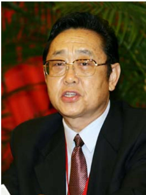
全国人大农业与农村委员会副主任委员孙文盛

其次,是应对我国农村人口老龄化高峰期到来的客观需要。有关资料显示:“目前,中国人口老龄化的速度居世界首位。2007年,我国60岁以上老年人口已超过1.49亿,本世纪中叶将达到4亿多,届时,农村老年人口大约占全国老年人口的三分之二。”而在我国,农村经济社会发展水平远远落后于城市,加之不断加快的城市化进程使“土地养老保障”变得越来越脆弱;“4-2-1”式的家庭增多,使“家庭养老保障”日益面临挑战。为此,为迎接农村人口老龄化高峰期的到来,使数量庞大的农村人口老有所养,就必须未雨绸缪,从现在开始着手,统筹兼顾,长远规划,尽快建