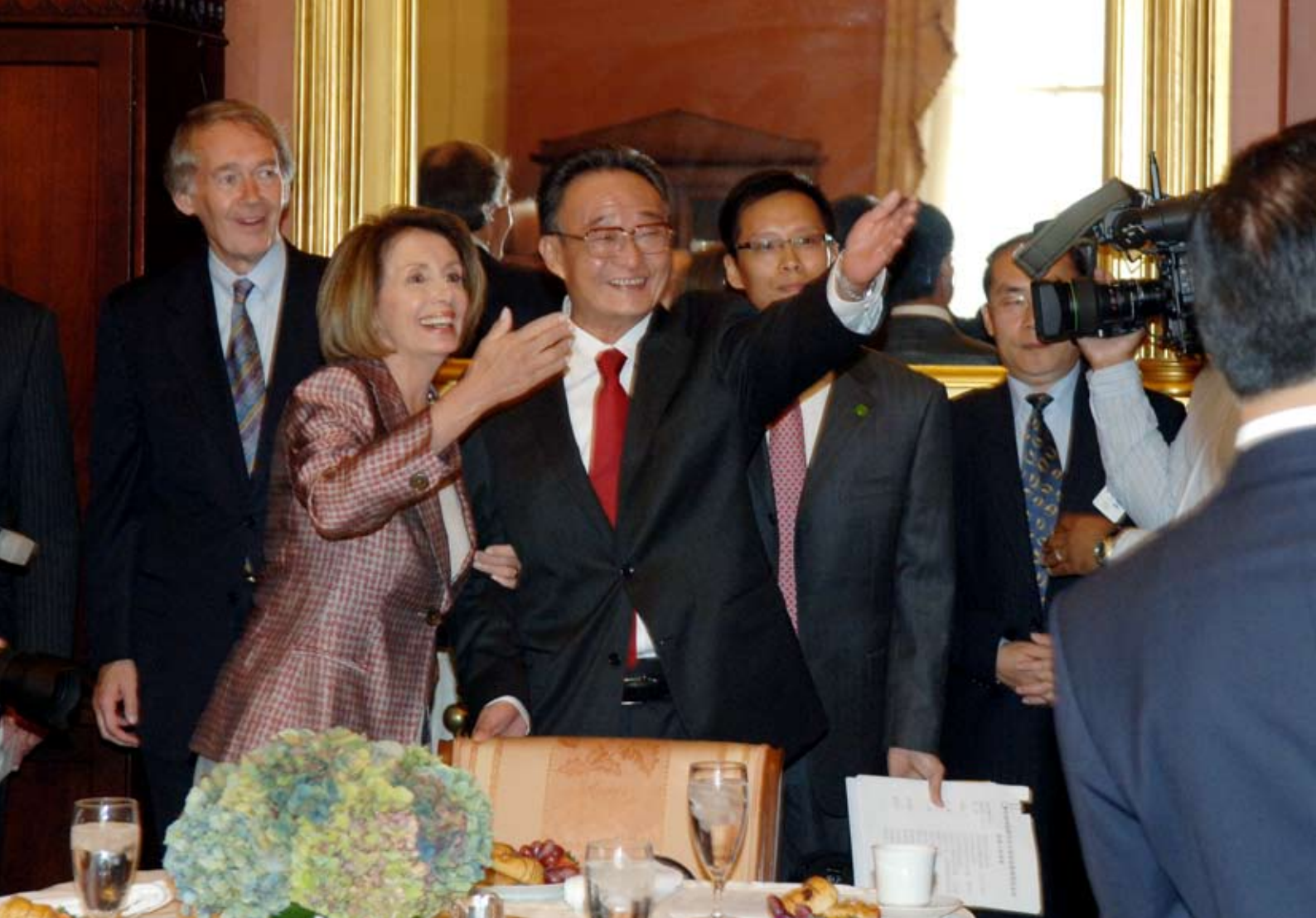
9月9日,吴邦国委员长与美国国会众议院议长佩洛西会晤