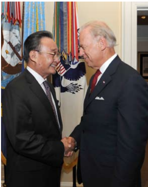
9月10日,吴邦国委员长在白宫会见美国副总统兼参议长拜登

吴邦国委员长应邀在美国友好团体联合举办的晚餐会上发表主旨演讲。他用生动事实和大量数据,从发展是中国战胜困难的一大法宝、发展是中国对世界的贡献、发展是中国的第一要务三个方面,深刻阐述了发展是硬道理和坚持科学发展的战略思想。他指出,中国发展离不开世界,世界繁荣稳定也离不开中国。中国将始终不渝走和平发展道路,既通过维护世界和平发展自己,又通过自身发展维护世界和平。我们认为,由于历史文化、发展阶段、社会制度和意识形态的不同,国与国之间在一些问题上有不同看法甚至分歧,是完全可以理解的。大家可以坐下来谈,一谈不拢也没关系,至少可以增进相互了解,但分歧不应成为合作的障碍,更不能成为干涉别国内政和遏制别国发展的理由。我们主张,推进国际关系民主化,尊重世界多样性,尊重各国人民自主选择发展道路的权利,不干涉别国