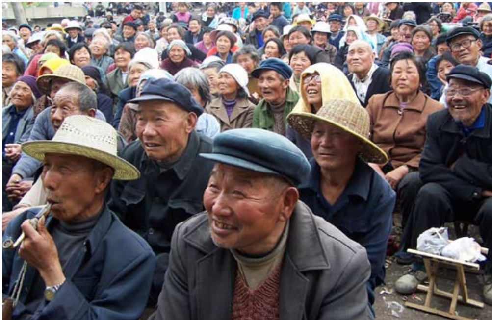
2009年8月5日消息, 人力资源和社会保障部副部长胡晓义在国务院新闻办举行的新闻发布会上透露, 新型农村社会养老保险试点会在“十一”之前启动