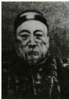
左宗棠以68岁的抱病之躯,抬棺出征,誓死收复伊犁成为史上佳话

早在2000多年前,西域就是中国统一多民族国家不可分割的一部分。汉朝从公元前60年起,就在新疆的“乌垒城”(今新疆库车与焉耆之间)设立了西域都护府,管理西域各绿洲,还设“戊己校尉”主管西域军事,各绿洲上的地方首领也由汉朝中央政府统一任命。唐朝时期在新疆东部实行与中原相同的州县乡里管理体制,其他地区实行都督府、羁縻府州管理体制。元朝在今新疆东部设宣慰司都元帅府和断事官,来直接管理当地事务,其他地区分封为两个汗国,首领听命于元朝的蒙古大汗,并只负责战时统领军队,境内各绿洲的民政事务则由中央政府任