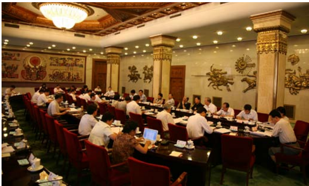
十一届全国人大常委会十次会议第三次审议行政强制法草案