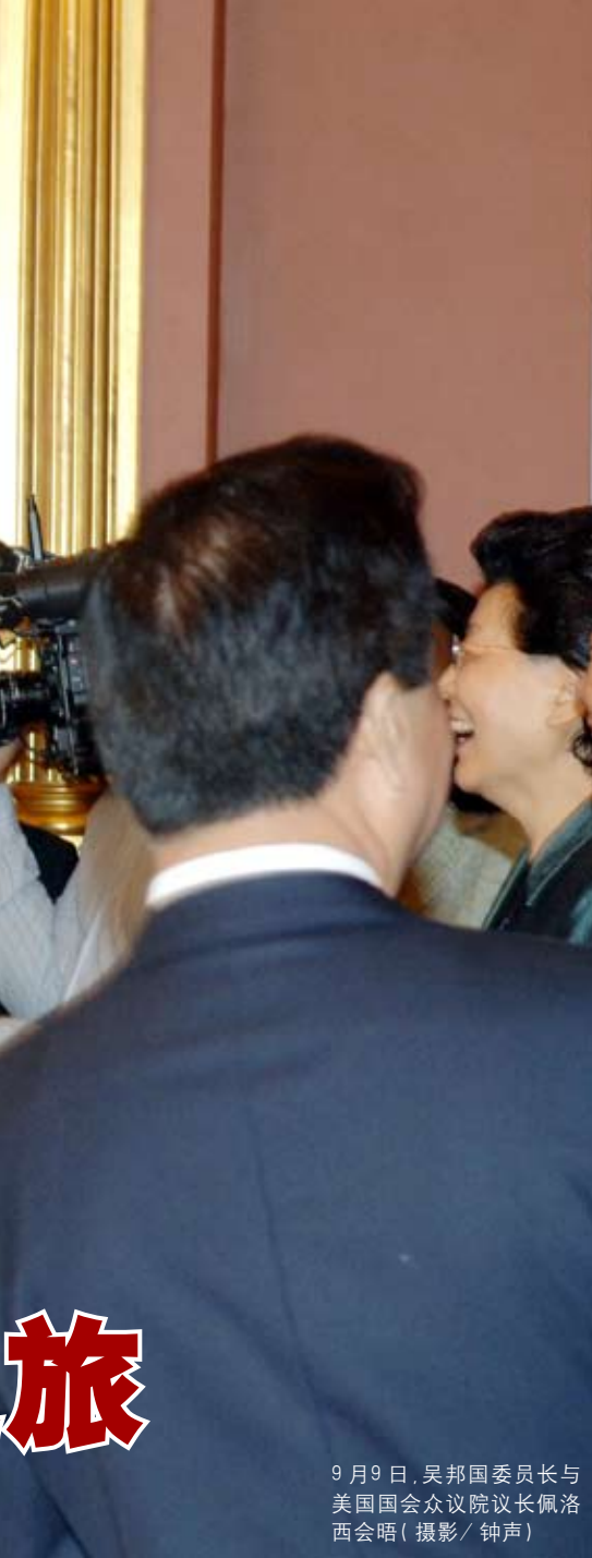
9月9日,吴邦国委员长与美国国会众议院议长佩洛西会晤