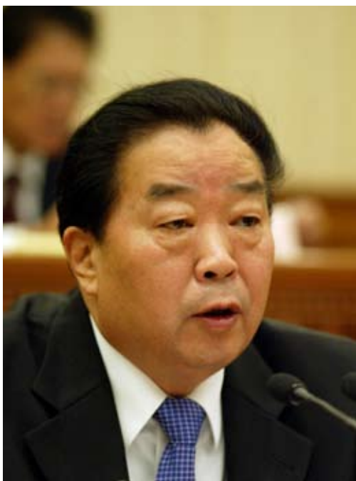
全国人大常委会副秘书长乔晓阳

第二，从国家政权机关之间的关系来看，各级人大是国家权力机关，“一府两院”即人民政府、人民法院和人民检察院都由本级人大产生，向它负责和报告工作，受它监督。在人民代表大会统一行使国家权力的前提下，宪法和法律对各级人大、政府、法院和检察院的职责作了明确划分，从而保证各个国家机关既分工负责又协调一致地开展工作。人大与“一府两院”是决定与执行、监