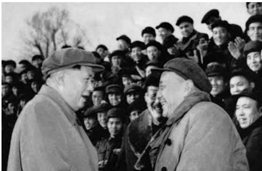
1955年,毛泽东主席接见全国司法会议代表时,与马锡五亲切交谈

杭州市人大常委会会议实行网上视频直播,是民主有序、法治良性发展的必然结果。杭州市的实践带给我们的启示,并非一定要将人大常委会会议在网上直播,而是人大应主动接受