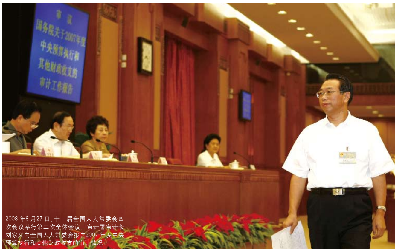
2008年8月27日,十一届全国人大常委会四次会议举行第二次全体会议,审计署审计长刘家义向全国人大常委会报告2007年度中央预算执行和其他财政收支的审计情况

的监督下,审计工作开始向纵深方向发展。正如审计署审计长刘家义所言,审计作为国家的“免疫系统”,有责任更早地感受风险,有责任更准确地发现问题,有责任提出调动国家资源和能力去解决问题、抵御“病害”的建议,有责任在永不停留地抵御一时、一事、单个“病害”的同时,促进其健全机能、改进机制、筑牢防线。★