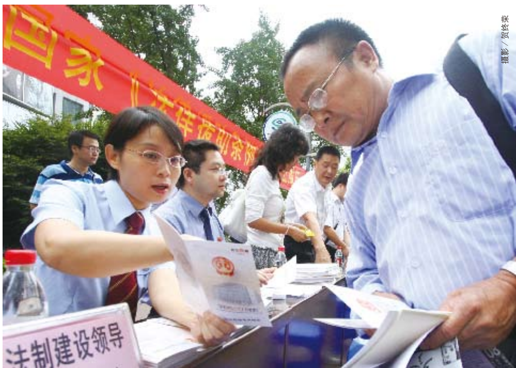
跨年度追踪督办的“关于落实改进法律援助工作”的重点处理建议办理取得实效,各地法律援助工作施惠于民