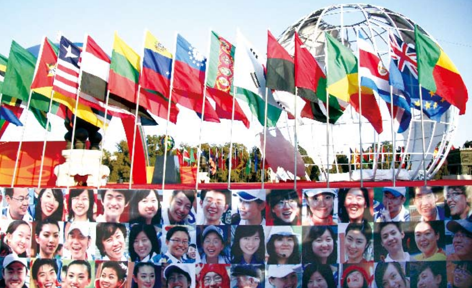
2008年12月5日是北京奥运会和残奥会成功举办后的首个国际志愿者日，“国际志愿者日主题活动暨‘奥运志愿者星’命名仪式”在地坛公园举行

全管理比以往此类活动提出了更高的要求,大型社会活动安全管理条例的制定就是整体考虑城市日常管理和奥运筹办需求的结果。还有一个重点考虑是在时间安排上,对于一些迫切需要的立法,及时调整立法规划,及时安排。突发事件应对法2007年8月出台后,为了应对奥运期间可能发生的突发事件,北京市人大常委会及时调整立法计划,于2008年5月制定了实施突发事件应对法办法,也成为这方面国内的第一个地方性法规。