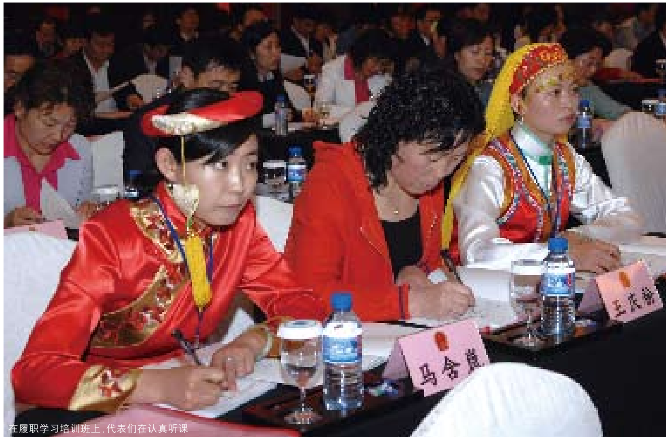
在履职学习培训班上,代表们在认真听课

十一届全国人大任期的第一年集中举办代表履职培训,对于代表今后四年的履职都将起到重要的指导和帮助作用,对于提高代表整体素质、充分发挥代表作用具有重要的现实意义。