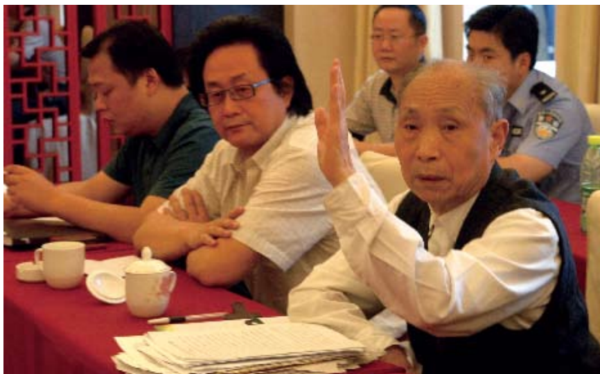
2008年5月7日,成都市人大常委会举行《成都市燃放烟花爆竹安全管理条例》立法听证会。各界人士畅所欲言