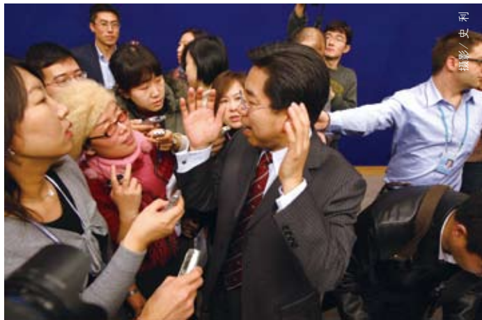
2009年1月22日,国家统计局局长马建堂在国务院新闻办记者招待会上表示,2008年国民经济总体呈现增长较快,价格回稳,结构优化,民生改善的良好发展态势

此外,在“三不得”之外,统计法修订草案还对地方政府、各政府职能部门与统计机构的相互关系重新进行了梳理,取消了现行统计法中“各地方、各部门、各单位的领导人领导和监督统计机构、统计人员和其他有关人员执行本法 and 统计制度”的规定,明确“各地方、各部门、各单位应当加强对统计工作的组织领导,为统计工作提供必要的保障”。同时赋予国家统计局组织管理全国统计工作的监督检查权,并对国家统计局及其派出的调查机构、县级以上地方人民