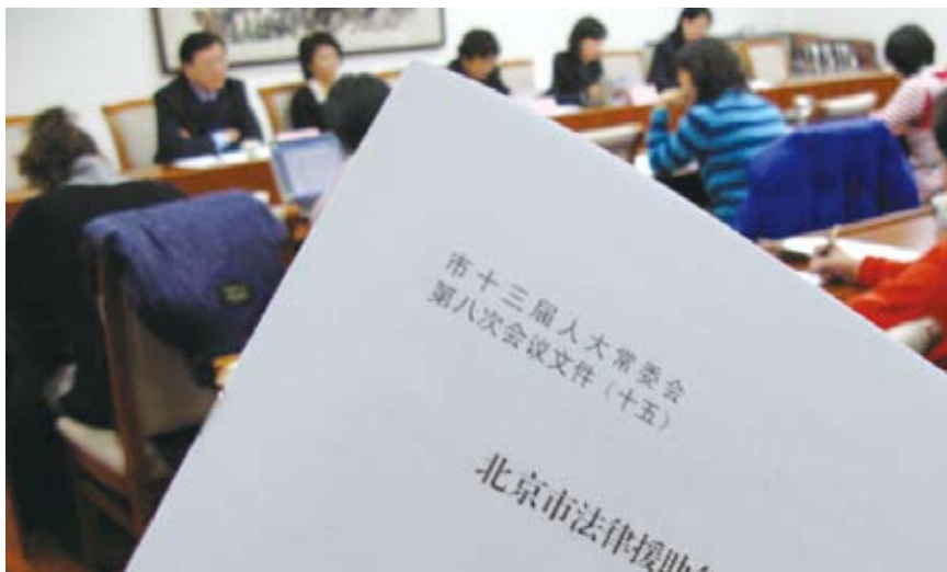
2008年12月19日出台的《北京市法律援助条例》因亮点纷呈而备受社会各界的关注

天津、重庆市、海南、新疆等地聘任立法咨询专家,借助于不同专家咨询意见的互补性,推进民主立法、科学立法。