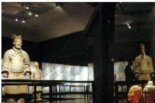
2006年,中国秦始皇陵兵马俑在哥伦比亚国家博物馆展出

实上中国今天已成为世界大国,为其他国家的发展起到了指路灯作用。中国人以一种开放意识、国际眼界向全世界敞开大门,并且取得了成功,同时也向全世界推介了自己。之前中国有一个目标,就是要在体育上做到世界最好,2008年的奥运会已证明中国人民成功实现了这个目标。