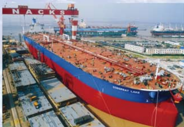
图为南通中远川崎船舶工程有限公司舾装中的30万吨级巨型油轮。南通市造船完工量约占江苏的三分之二、全国的六分之一。