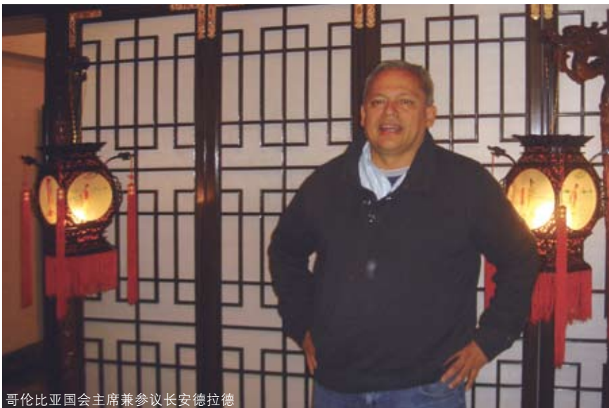
哥伦比亚国会主席兼参议长安德拉德