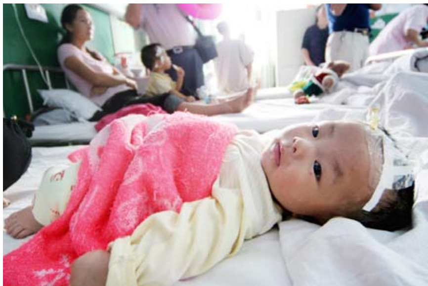
2008年9月22日,一名食用了含三聚氰胺奶粉的患儿在江苏省赣榆县人民医院儿童病房输液治疗

民以食为天,食以安为先。在资讯发达的今天,一波波有关食品安全的新闻让老百姓早已丧失了起码的安全感,从广州假酒中毒事件、四川彭州的毒泡菜、天津的假鸡蛋、金华敌敌畏火腿、糖精水勾兑的劣质葡萄酒、“非食用冰醋酸”的山西老陈醋,到大头娃娃、三鹿事件,如此情景用“恐怖”来形容并不为过。国家有关科研机构的一份调查报告显示,三成多的人把食品安全放在最不安全因素的第一位。在全球经济一体化的今天,食品安全不仅是一个对群众身心健康关系极大的公共卫生问题,同时