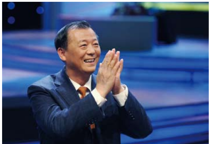
2009年2月14日,“2008经济生活大调查”发布仪式在中央电视台进行录制,国家统计局总经济师姚景源在节目中表示:“我觉得2009年我们中国经济达到或者超过8%是有很困难,不是一般的困难。”

面对国内严重的自然灾害以及国际经济形势的不利影响,2008年国民经济和社会发展的情况如何?已实施两年多的“十一五”规划纲要确定的各项指标是否执行的良好?根据监督计划的安排,十一届全国人大常委会分别在2008年的8月和12月听取了国务院关于2008年以来国民经济和社会发展计划执行情况的报告和国务院关于“十一五”规划纲要实施中期情况的报告,把脉宏观经济的运行情况。