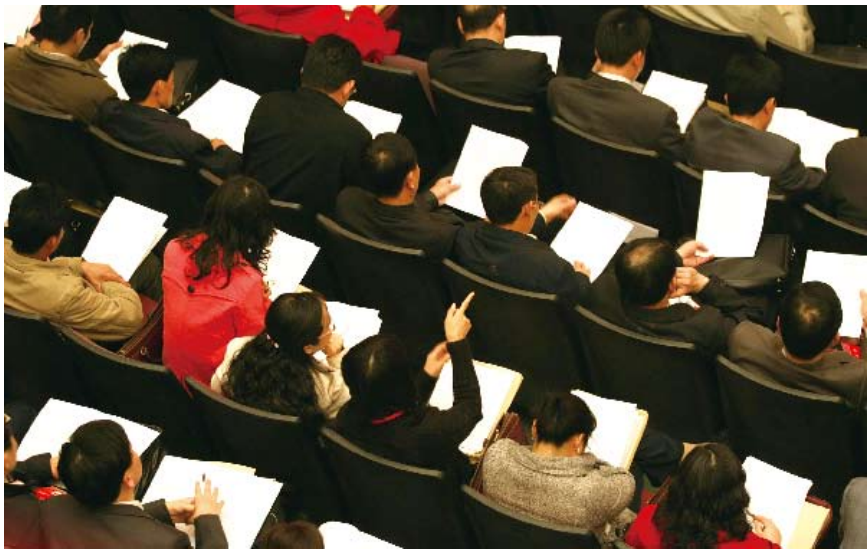
2008年2月26日,广东省中山市第十三届人民代表大会第三次会议上,人大代表在听取“一府两院”和人大常委会工作报告

2008年1月,浙江温岭市箬横镇政府将2008年度预算草案提前发放到代表和部分公众手中。2月23日,镇人代会对预算进行集中会审,政府负责人当场接受代表询问。各代表团组织代表提出6个预算修正案,经镇人大主