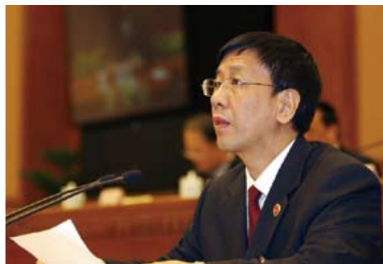
2008年10月26日,十一届全国人大常委会第五次会议举行二次全体会议,听取最高人民检察院检察长曹建明关于加强刑事审判法律监督工作维护司法公正情况的报告

专题汇报坚持“每年一个重点,年年强调公正”的工作思路。2008年全国人大常委会听取和审议的是最高人民法院关于加强刑事审判工作维护司法公正情况的报告和最高人民检察院关于加强刑事审判法律监督工作维护司法公正情况的报告。要求最高人民法院重点报告维护程序公正,落实审判公开制度;严格审判限制度;完善证据制度、辩护制度和审判监督制度的情况等。要求最高人民检察院重点报告维护程序公正,纠正违反诉讼程序行为;抗诉确有错误的判决和