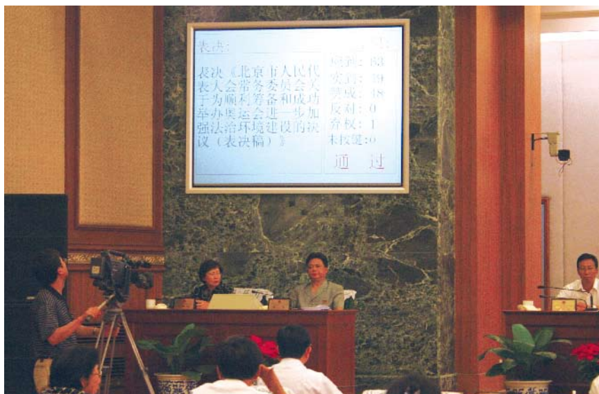
2007年7月27日,北京市十二届人大常委会第三十七次会议审议通过了关于为顺利筹备和成功举办奥运会进一步加强法治环境建设的决议

对奥运立法的评估,无疑是对奥运会立法经验极好的总结,对于继承奥运精神遗产,促进北京市经济社会更好更快发展具有深远意义。★