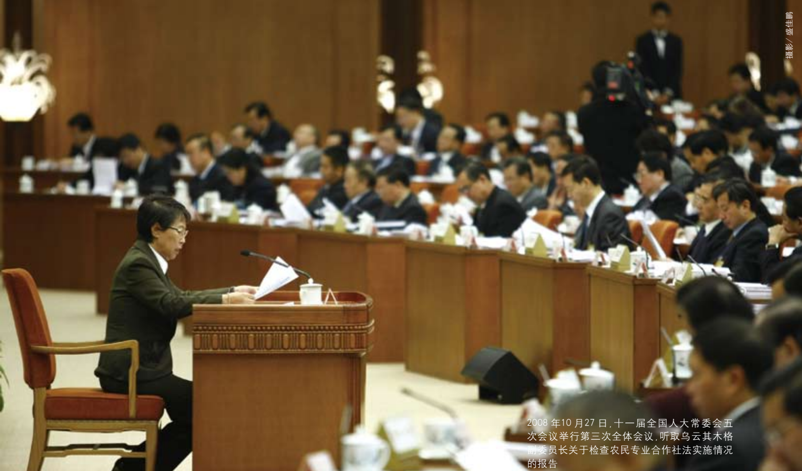
2008年10月27日,十一届全国人大常委会五次会议举行第三次全体会议,听取乌云其木格副委员长关于检查农民专业合作社法实施情况的报告