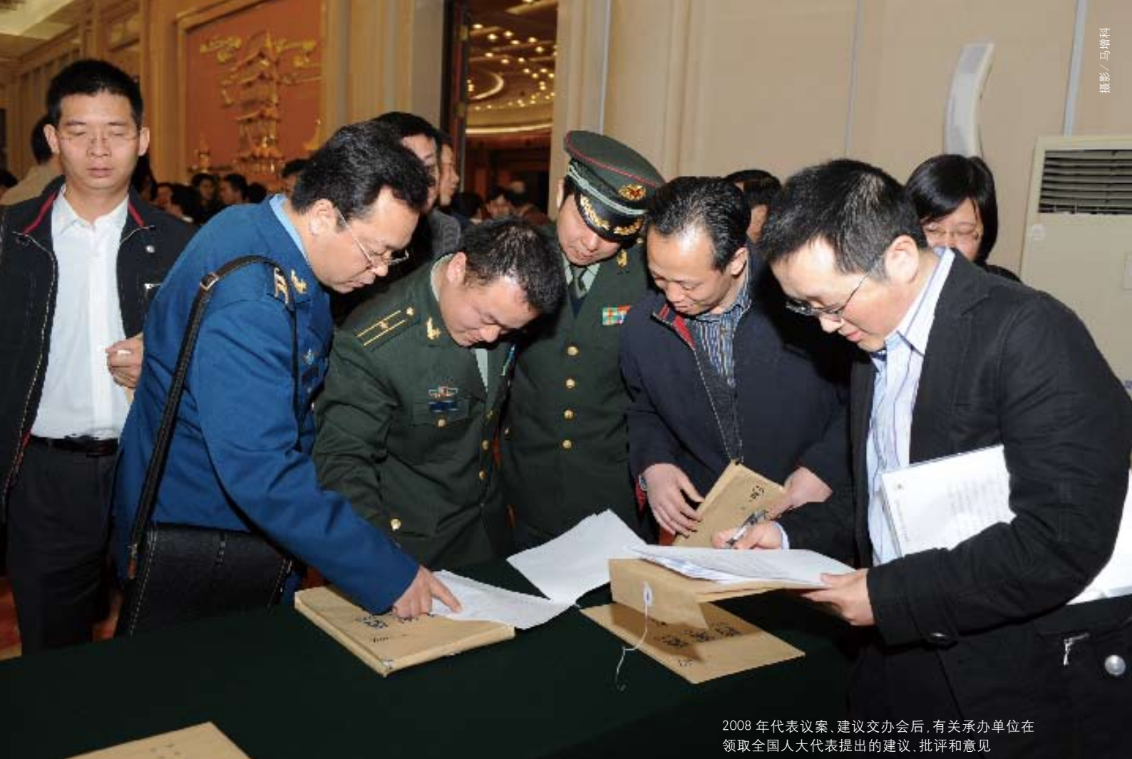
2008 年代表议案、建议交办会后,有关承办单位在领取全国人大代表提出的建议、批评和意见