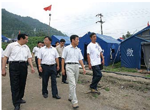
2008年7月8日,全国人大财政经济委员会调研组在四川地震灾区就我国巨灾保险制度体系的构建进行调研

议。结合办理重点处理建议,2008年以国务院或部委名义制定下发14个指导性文件,出台13项政策规定或具体措施,推动解决一批事关经济建设和社会发展的重大问题,取得了较好的办理成效。