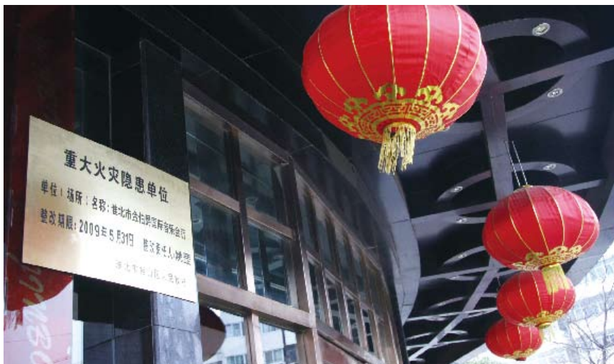
2009年2月18日,安徽省淮北市公安消防部门将全市4处重大火灾隐患已全部提请当地辖区政府挂牌督办整改,并明确了隐患整改责任单位、责任人、整改期限

企业国有资产法的出台恰逢其时,在进一步改革开放中,这部法律的颁布实施,为切实把国有资产保护好,把国有资产权益保障好,真正堵住国有资产流失的“黑洞”,提供了切实的法律保障。