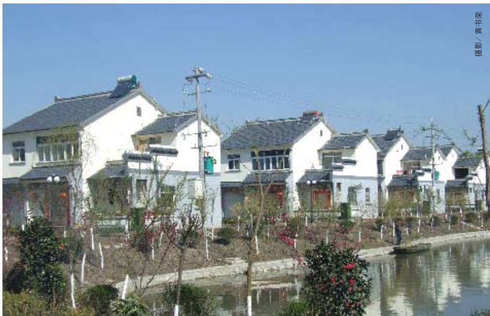
荣获“全球500佳”生态环境殊荣的江苏泰州河横村，大力发展规模种养业和农副产品深加工，全村已建成循环经济示范基地等20多个绿色基地，成了名副其实的绿色食品之村