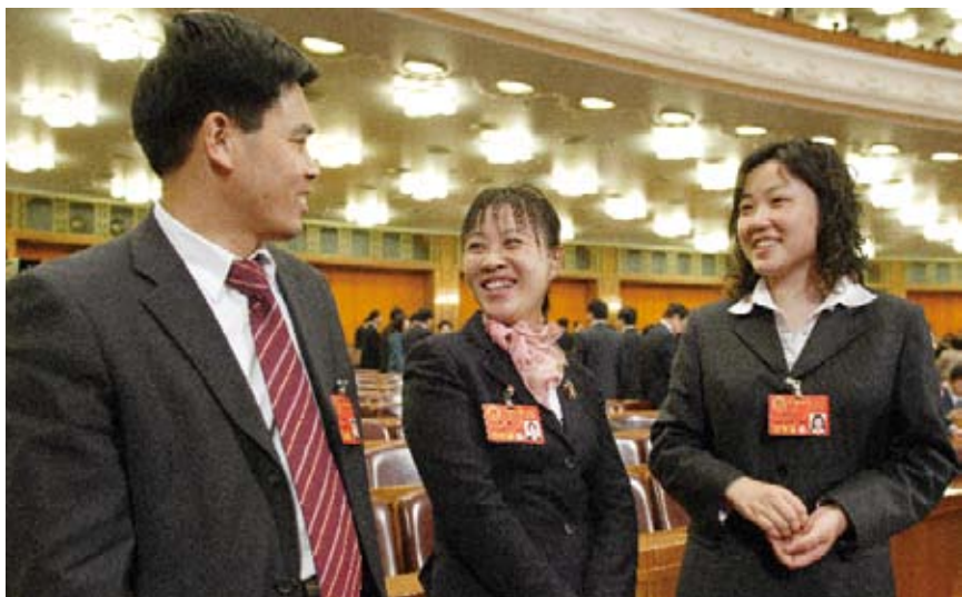
2008年3月,十一届全国人大一次会议上,首次出现农民工全国人大代表,图为康厚明、胡小燕、朱雪芹代表

3月底,江苏扬州市人大常委会会议就“古城保护和建设”的议题进行网络视频直播。在吸纳会内外意见后,该市人大常委会下发首期“审议意见书”,对扬州市的古城保护和建设提出了四大意见。事实证明,人大与民众互动进入了新的境界。