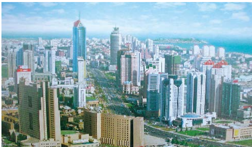
青岛东部崛起的几十幢高档写字楼和住宅楼,已成为新青岛的标志性城区。青岛市召开的全市房地产工作会议上强调,为了促进土地集约化利用,今后住宅小区的规划将向多建高层的方向发展