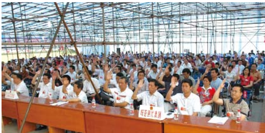
2008年6月26日,参加广元市人大五届五次会议第二次全体会议的市人大代表,举手表决通过选举办法和总监票人名单

席团研究将“从政府备用金中抽取20万元以增加河道保洁财政投入”列为正式议案提交大会审议,118名人大代表对该项修正案进行了讨论,之后才表决通过。