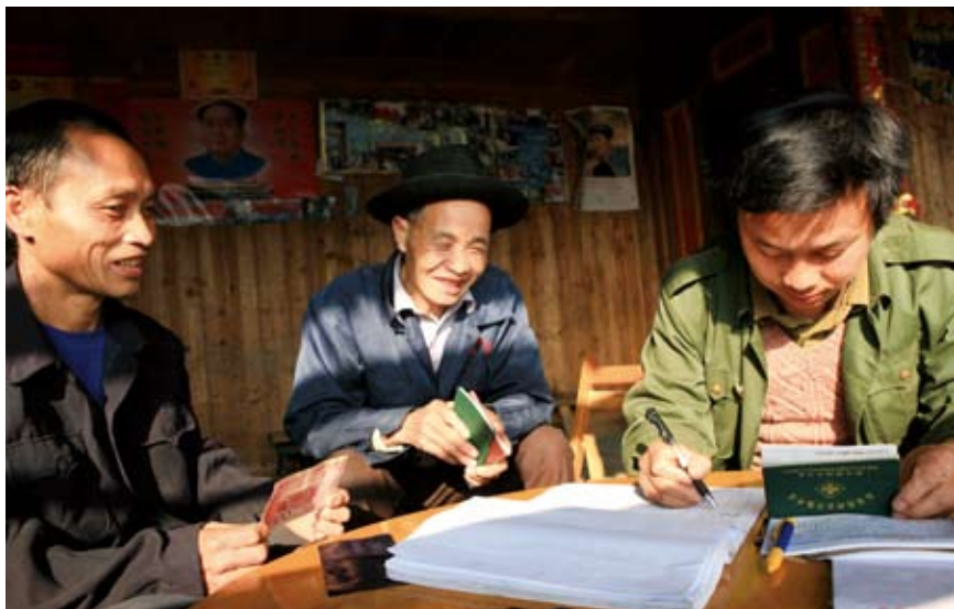
2008年12月19日,在广西融水苗族自治县杆洞乡党坞村下党坞屯,一名村干部正在为村民办理2009年度“参合”手续。走苗家进山寨入户办理“参合”手续,提高了农民参加“新型农村合作医疗”的积极性,有效地解决了农民看病就医难的问题。

比如,2008年1月,浙江海宁市人代会首次组织人大代表集中询问,体现人大监督的新风格、高效率。海宁市打破代表分组审议的界限,分五个专题进行大会专题审议,在重点发言的基础上,由人大代表向“一府两院”提出询问,并对其中的民生专题审议进行电视现场直播。2008年7月,甘肃阿克塞县人大常委会对“一府两院”被任命干部报送履职报告不及时、代表意见建议办理答复迟缓等突出问题进行了不留情面的通报。沈阳市人大常委会执法检查将检查对象由过去的“政府推荐”变为现在的“随机确定”,这种“不按常规出牌”的检查方式能摸清很多真实情况。山东德州市人大常委会执法检查特别强调“暗访”,以便让一些明察难以发现、深入的问题得以暴露。实践表明,包括法律实施效果和民生问题解决的程度在内,“效益”仍是人大监督的首要追求。