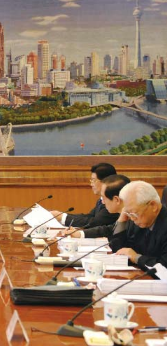
2008年12月15日,十一届全国人大常委会第十五次委员长会议建议常委会会议继续审议统计法修订草案等

由于经济数据是地方政府政绩的主要评判依据,现在有很多地方领导为了扩大政绩,对统计数据进行干预,统计人员以及下一级统计机构很难抵制,给社会造成了极坏的影响,这其中,统计工作缺乏独立性是社会各界对数据失真问题形成的共识。