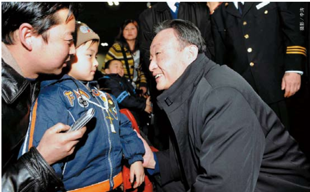
2008年2月3日,受胡锦涛总书记委托,吴邦国委员长在北京专程到国家电网公司、铁道部调度指挥中心和北京西站,代表党中央、国务院,向奋战在抗冰雪抢险一线的电力、铁路系统广大干部职工表示亲切慰问。图为吴邦国在北京西站候车室与旅客亲切攀谈

在危急时刻,十一届全国人大常委会心系国家与人民,及时将党的主张转化为人民的意志,将人民的主张升成为政府的行动。在大灾大难中,始终保持国家的运行在法制的轨道上前进。从中我们深切地感受到,最高国家权力机关同国家民族共命运、与黎民百姓同呼吸的情怀。