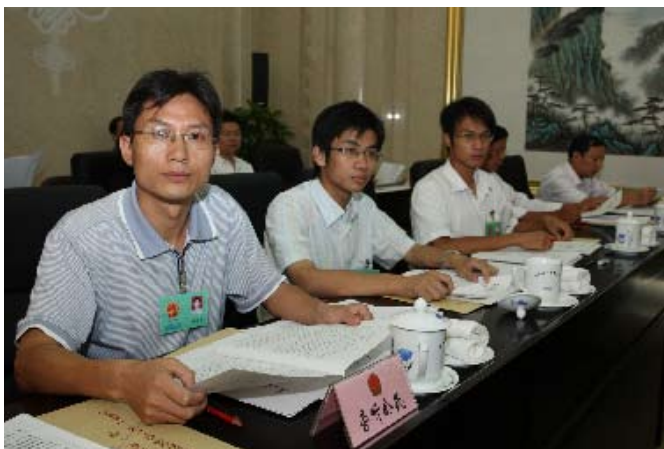
江西省人大常委会邀请高校师生旁听常委会会议,并形成制度。这一制度在全国尚属首创

2008年10月,上海市、福州市、江苏江都市等地制定人大代表联系人民群众或选举单位办法,要求市人大代表采取参加会议、视察、调研、座谈、走访、电话、书信、互联网等多种方式联系选举单位和人民群众。其中,上海要求人大代表每年接待选民不少于一次;福州市人大代表每届至少两次向原选举单位报告履职情况;江都市要求每位代表联系本选区选民3人以上,每年联系不少于3次,江都市当年5月还组织1400多名市、乡镇人大代表与选民统一见面,听取民意。江苏扬州市在当年8月开通民情“绿色通道”,即首批发放近万个选民联系人大代表的专用信封,由市人大付邮资,仅在1个月时间就回收150多件民情来信。山西清徐县开展“百名代表访千家”活动,听取民情民意,县人大常委会将代表收集的意见整理后交政府处理。河南省郑州市林山寨街道办事处所属的9个社区,已全部开通了“人大代表信箱”,使之成为河南省第一个“人大代表信箱”覆盖所有选区的街道。这些信箱由专人管理,每周开一次,代表对居民反映的问题最迟一个月内回复并及时转交有关方面办理,全程督办。