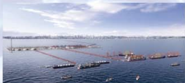
初步通航的深水海港洋口港规划效果图

南通位于江苏省东部长江与黄海交汇处，是中国首批14个沿海开放城市之一，有“扬子第一窗口”之誉。下辖通州、海门、启东、如皋4个县级市，海安、如东2个县，崇川、港闸2个区和南通经济技术开发区。全市陆地总面积8001平方公里，总人口766万。