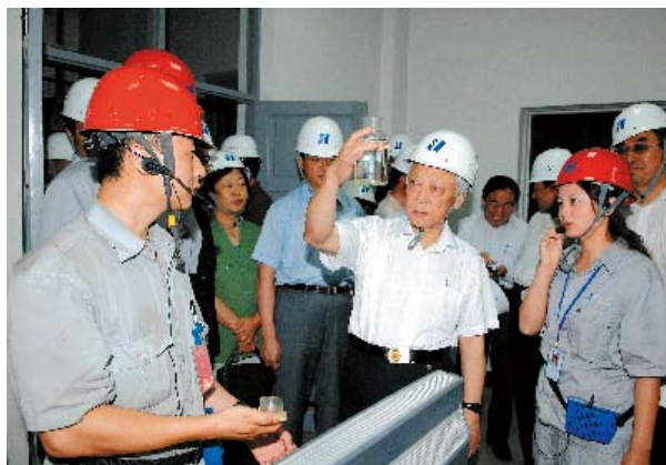
2008年7月,全国人大常委会环境影响评价法执法检查组在内蒙古自治区大唐国际托克托发电公司进行检查,全国人大代表也参加了执法检查

全国人大代表刘云耕:从闭会期间参加的活动和开展的调研所掌握的有关经济社会发展及人民群众反映的意见等资料中,可以梳理提炼出事关全国发展大局的议案、建议的选题,提高议案、建议的质量和可行性,帮助国家有关机关和组织进一步改进工作、解决改革发展稳定中有较大影响的现实问题。