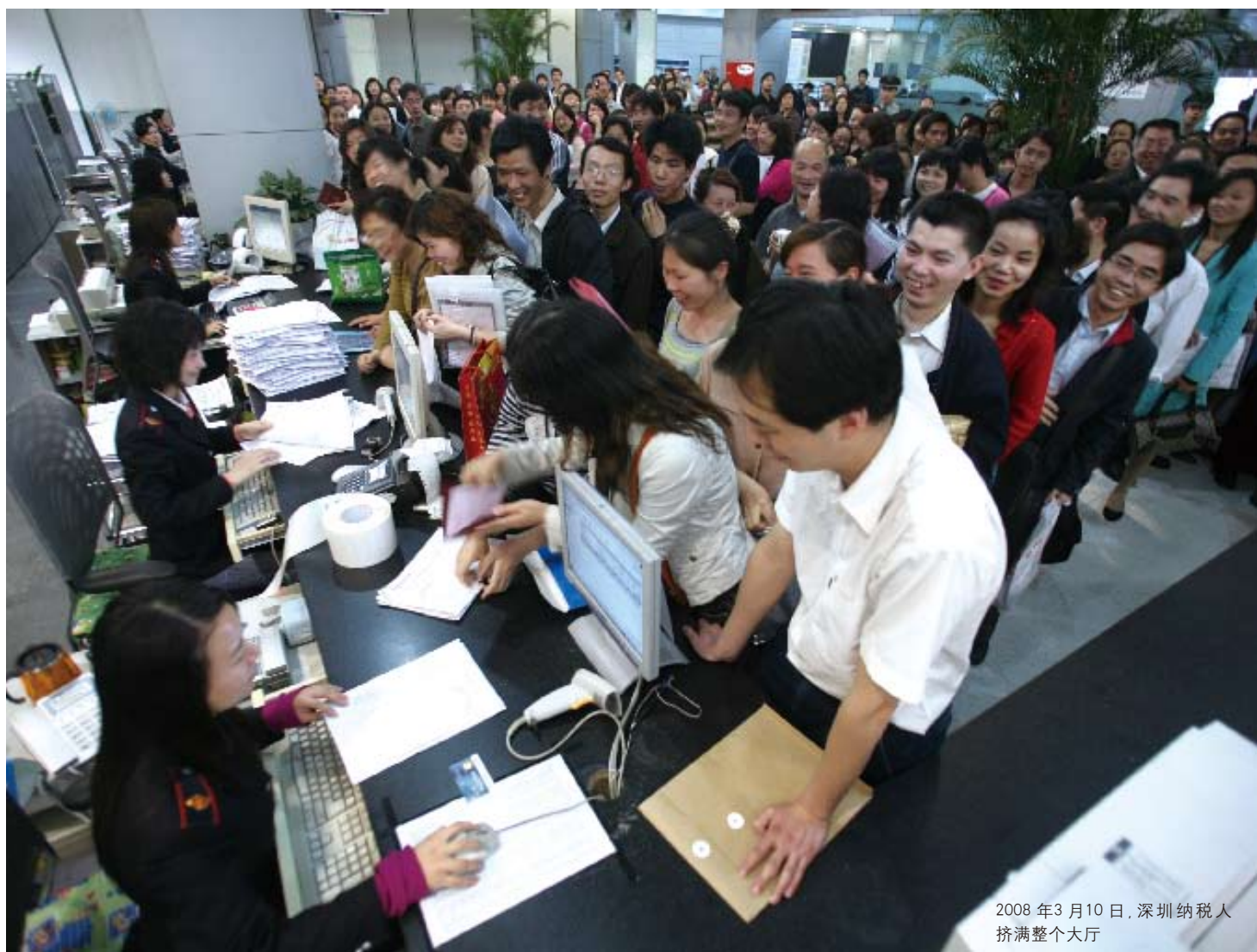
2008年3月10日,深圳纳税人 挤满整个大厅