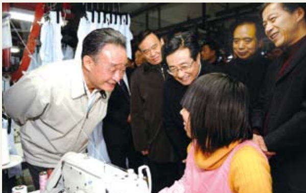
2月5日，吴邦国委员长考察宁波雅戈尔集团时和女工亲切交谈

专题调研。吴邦国强调，要坚持以科学发展观为指导，认真贯彻落实中央经济工作会议精神，在保持经济平稳较快发