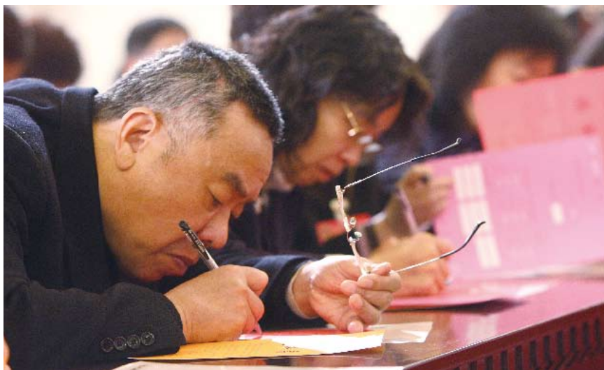
上海市人大代表在人代会上

改革开放30年来,中国社会阶层发生了巨大变化,利益的多元化催生了需求表达的多元化。在这一时代背景下,优化人大代表结构成为各界的共同愿望。时下,干部代表群体“瘦身”,基层代表增加成为一种趋势。比如,新一届上海市人大代表方阵中,局级以上领导干部比上一届减少49名,而一线工人、农民代表总量增加近1倍。农村每一代表与城镇每一代表所代表的人口数比例,由原来的2倍缩小为1.1倍。而四川省人大代表中的一线工人、农民比例比上届增加4个多百分点。与此同时,快速扩大的以私营企业老板、高科技人