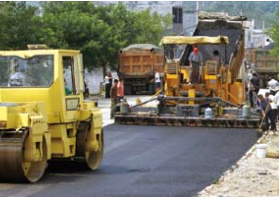
2008年8月25日,山东省道北留公路最后通往北庄村的300米铺设现场。近年,枣庄市山亭区在人大监督下,投资1.27亿元修建农村公路718公里,实现全区268个行政村全部通上柏油路

监督公开原则落地有声,实效是检验监督工作的最好标准。在监督法实施的第二年,地方人大监督的注意力更侧重于制度跟进和程序到位。