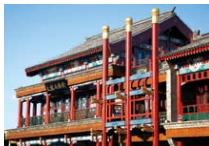
为北京奥运会召开修缮一新的前门老字号大北照相馆

立法的法规因情势所变适当加以修订完善,并结合实际制定配套规范。例如,国家体育总局起草,正在报国务院审查的全民健身条例草案中规定8月8日为全民健身日,而北京市的全民健身条例规定是6月23日,建议对此予以关注。同时,要督促相关行政部门制定配套规章。奥运会立法中有的法规配套规定尚不完善。比如,就突发事件处理方面涉及到的财产征用问题,还需要制定有关规章,对补偿的标准、申请和发放等程序进行规范。因此,建议根据实际情况,督促政府相关部门制定相关配套规章。