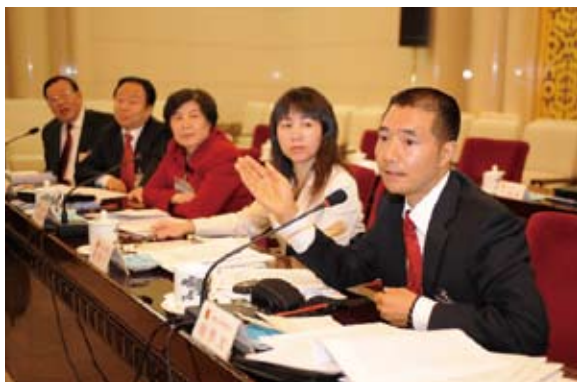
邀请代表列席常委会会议已成制度,2008年共有192名全国人大代表列席了全国人大常委会会议

成制度,工作日趋规范。全国人大常委会办公厅根据每次常委会会议议程,结合代表的职业特点、提出议案、建议情况和代表意愿,邀请相关领域和熟悉情况的代表列席常委会会议。