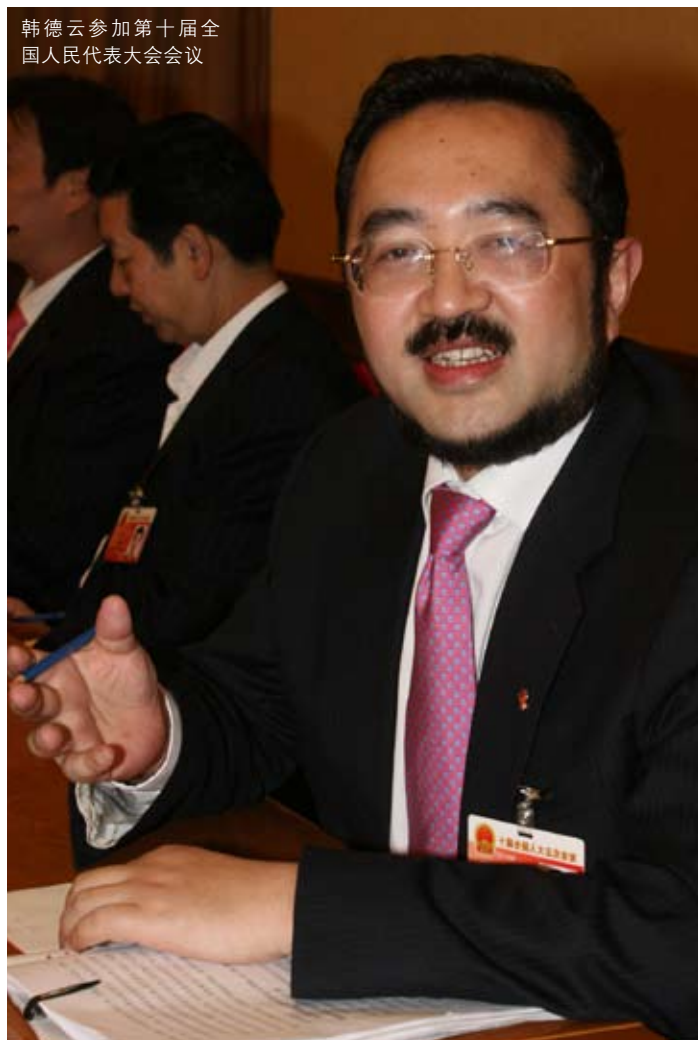
韩德云参加第十届全国人民代表大会会议

他提的议案建议都离不开法律、法规的“完善”。“毕竟我是学法律的，从事的也是这个行业，立法也是人大工作的一项重要内容。”他说。