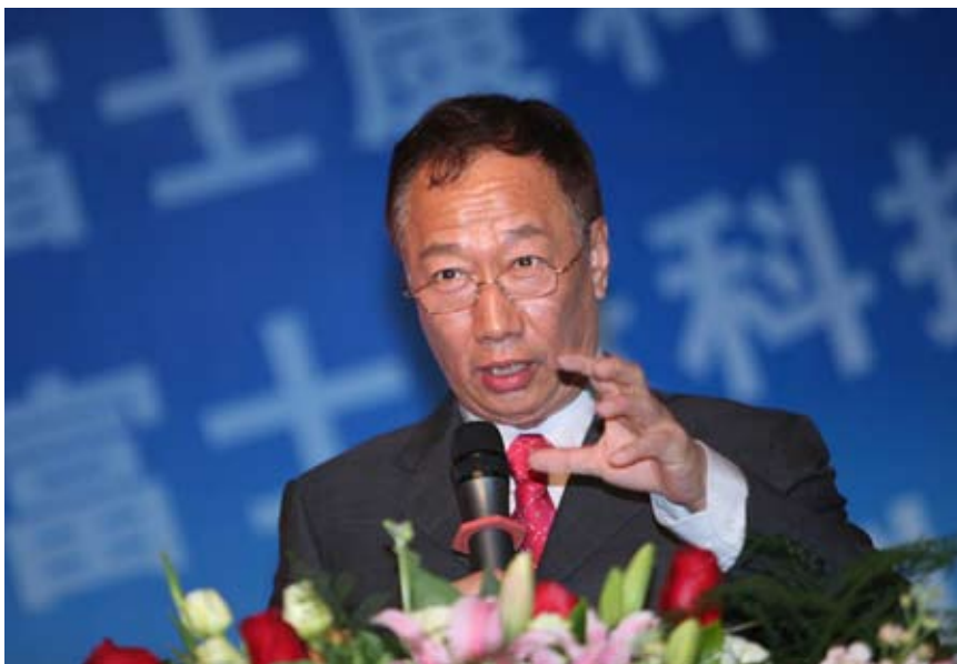
2007年12月12日,台商投资企业富士康科技集团宣布:集团将积极执行劳动合同法,与数万名已连续工作8年以上的员工签订无固定期限劳动合同,其余员工将以签订长期劳动合同为主。富士康科技集团总裁郭台铭率领集团3000多名高管和65万名员工参加了学习劳动合同法活动

千方百计稳定现有就业岗位。引导企业履行社会责任,防止出现大规模集中裁员现象。鼓励和支持遇到困难的企业采取在岗培训、协商薪酬等办法,尽