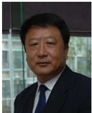
全国人大农业与农村委员会委员

当前,多种粮食的市场价格均低于目前国家规定的粮食保护价,我认为这会影响到农民的种粮积极性。因为市场价格低于最低保护价,意味着农民种粮是赔本的,所以国家应按照最低保护价敞开收购农民的粮食。