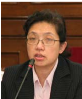
全国人大常委会委员 全国人大财经委员会委员

在短期应急情况下,国家采取一些行政措施控制物价是可以的,但长期来看,我们不能靠行政手段控制价格。因为公共产品可以由政府定价、规制管理,但一般的产品是要遵守市场规律的,价格要与相应的制度建设、财税政策相配合。粮价就是如此。