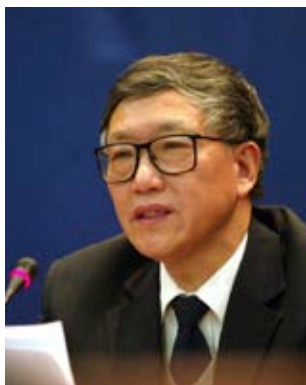
全国人大常委会委员 全国人大法律委员会副主任委员

尊重农民的意愿,农民想富起来都很难。千百年来,世代留传的农村宅基地不能抵押贷款,这对农民而言是不公平的。如果我们更好地尊重农民的权利,加之农民的勤劳与智慧,他们很快会富裕起来。★