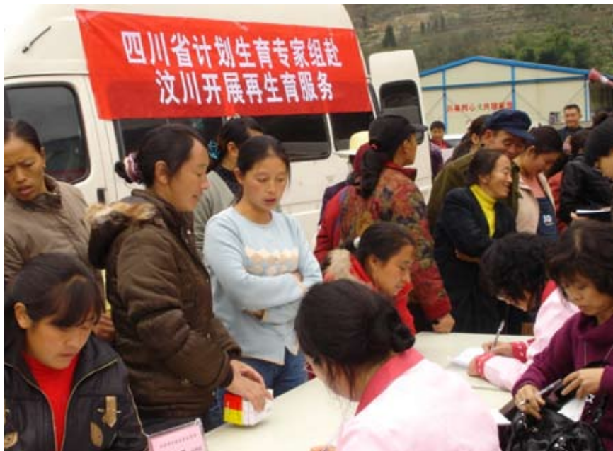
计生专家组赴汶川开展再生育服务

《决定》出台当晚，中央电视台新闻频道、次日中央一套综合频道、四川电视台迅速进行了报道。《人民日报》、《四川日报》、新华网、新浪网、香港凤凰卫视等众多国内媒体，以及CNN、法新