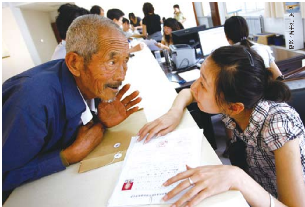
济南市劳动保障部门就医保热点问题进行解答

由于基本养老关系无法转移接续,跨地区就业劳动者的缴费年限不能累计计算,退保、参保积极性不高等现象大量出现,跃为制约我国社会保险事业