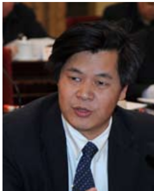
全国人大常委会委员 全国人大内务司法委员会委员

物价问题与人民生活息息相关，政府稳定物价责无旁贷。去年以来，政府所采取的若干措施是有效果的。但是在市场经济条件下，我认为政府稳定物价、干预市场物价要把握分寸，一方面不能放任物价大起大落，另一方面又不能太具体、太过度。放任的话，物价就会失控，民生会受到影响，社会不稳定，容易陷入危机之中。如果