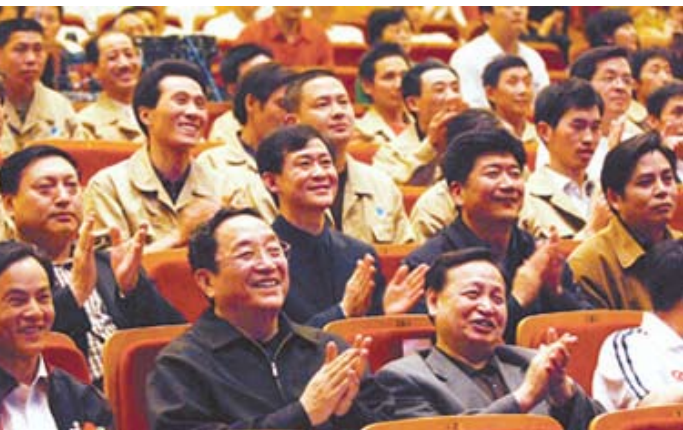
武汉市将对70万灵活就业人员实行新的社保缴费方法,统一缴费档次,降低了缴费总水平

按现行规定,缴费满15年才能按月领取养老金。实际中,有的就差一两年就退休了,交不了保险费,最后只能退回个人账户中的钱。现在大多数养老保险费率是单位交20%,个人交8%,其余政府补助,而记入个人账户的仅为8%。如果缴费不满15年,对个人显然没