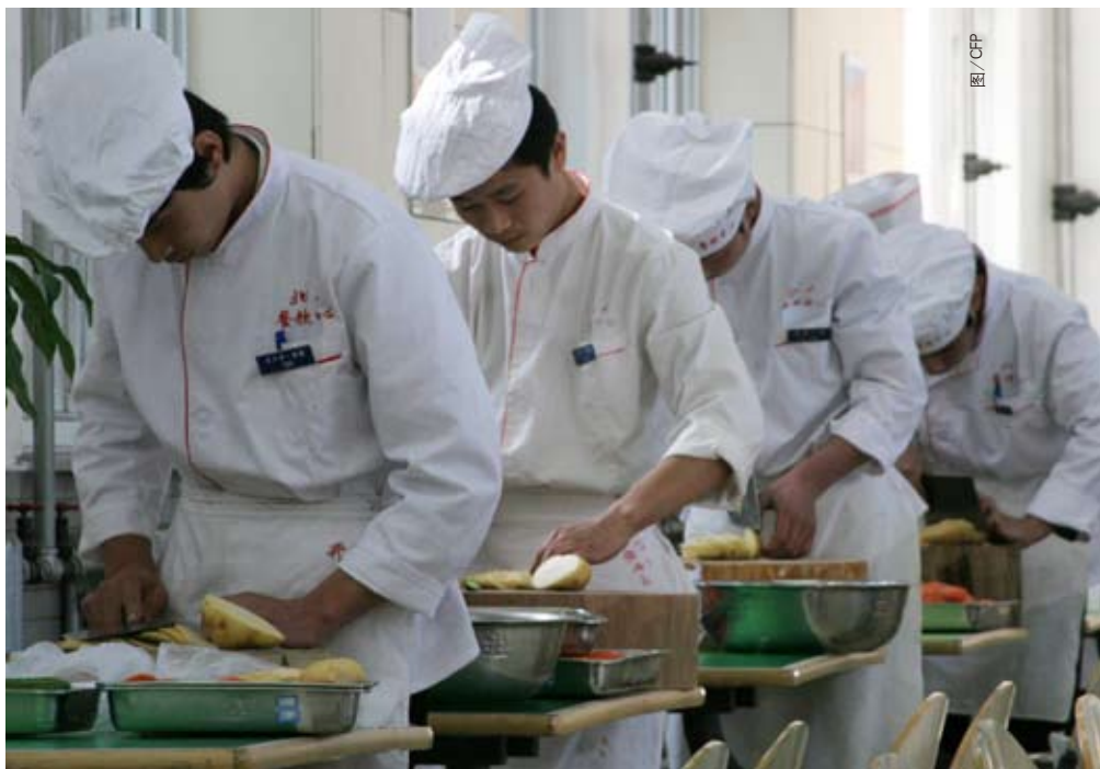
发展职业教育,培养特色人才

院护理专业的几十名毕业生,被北京一家著名医院“打包”聘走。这已经是该医院连续第四年从聊城职院定向招收护理专业毕业生,总数已达100多名。