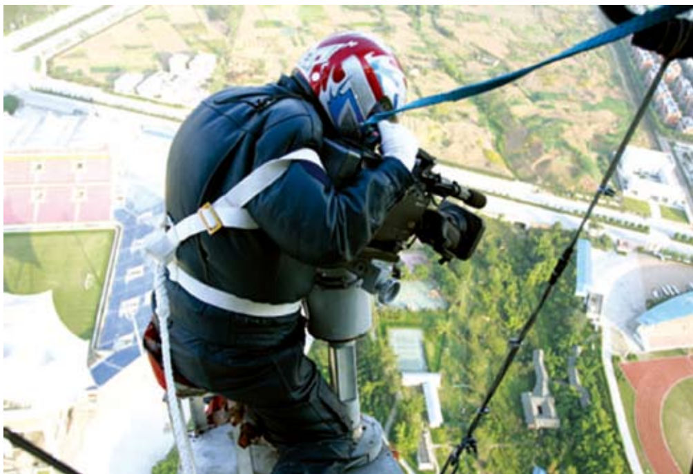
成都电视台正全力以赴创“绿色收视率”新高

被国务院批准为统筹城乡综合配套改革试验区后,成都市广电行业面临着改革试验带来的机遇、挑战与阵痛。怎样才能使城乡人民享有同等的新闻娱乐、舆论监督、信息共享资源,经过几上几下头脑风暴,局党组制定了“以微观管理为主向以宏观管理为主转变、以传统管理为主向推进公共服务和产业发展为主转变,着力加强公共服务、行业管理和产业发展三个重点领域工作”的思路。他们意识到,主流媒体的信息传播和新闻监督公信度高、权威性强。尤其广播电视更直观、贴近、快捷、面广,是党和人民的“喉舌”,思想文化的“阵地”,引领和导向人们的政治、经济、社会文化生活,承担着“以正确舆论引导人”、“以高尚精神塑造人”的重要职责。其健康运行从内容到形式乃至广告