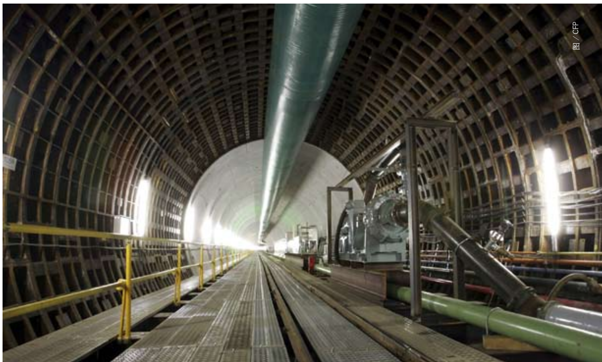
地下40米深处安装的地下管道,包括电缆、电话线、天然气和污水排放管道

会对市民来个“下马威”。且各类地下设施资料未形成信息化集成,部分档案资料与实际情况也有差异,一旦发生事故,难以快速找到事故源。谁来保证它们的安全?“必须为我们的‘地下城市’构建一道‘防火墙’。”这是许丽萍在人代会上疾呼的声音。她在发言中说,上海地处长江三角洲的最前沿,属典型的软土地区,局部还分布着浅层松散砂,地下潜水位高。作为城市的“血管”,地下交通和管网一旦发生事