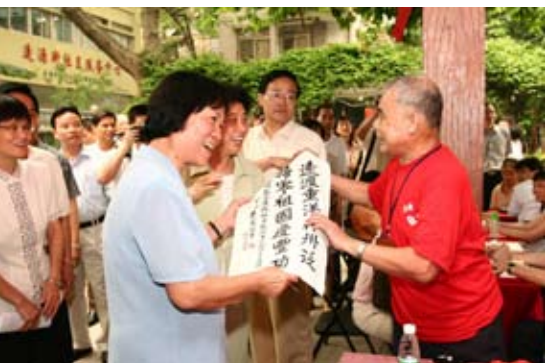
全国人大华侨委原副主任委员张帼英在广州视察

立法和城市建设与管理的行政立法为主要内容。《广州市白云山风景名胜区保护条例》的制定与实施,于1994年被市民评为当年广州地区十大新闻之一。《广州市防治珠江广州河段水域饮食业污染管理规定》的制定与实施,1995年得到原国务委员宋健同志的好评:这项法规简短,针对性强,很解决问题。《广州市妇女权益保障若干规定》公布后,《中国妇女报》于1996年3月22日在头版头条新闻中报道:“这部地方性法规的一些条款,尚属全国之先。”《广州市私营企业权益保护条例》颁布后,《经济日报》1998年1月18日在头版头条称其为“全国第一个私营企业权益保护方面的单项性法规”,是“广州人进一步解放思想的结晶和产物”。在加快立法步伐的同时,广州初步形成了立法协调,提前介入等八项立法工作制度,立法工作逐步走上程序化和制度化。