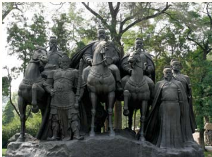
山西晋祠内唐太宗君及其勋臣长孙无忌、魏徵等君臣群雕

贞观时期向皇帝进谏蔚然成风,敢于进谏甚至说话不顺耳者大有人在,丝毫不逊于魏徵。一次,唐太宗要修建洛阳的乾元殿,准备作巡游时的休息住所。给事中张玄素上书规谏,言辞十分尖锐,认为太宗连隋炀帝都不如。太宗问他:“你认为我不如炀帝,与夏桀、商纣王相比又怎样呢?”张玄素毫不客气