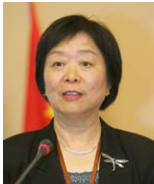
全国人大常委会委员 全国人大财经委员会副主任委员

限产或者限制进口。现在是低农产品价格，再进行各种各样的补贴是有问题的，一是漏洞很大，二是补贴能否发放到每一家农户，这里特别容易产生腐败。所以，要理顺农产品价格，让农产品在成本上保持利润。✘