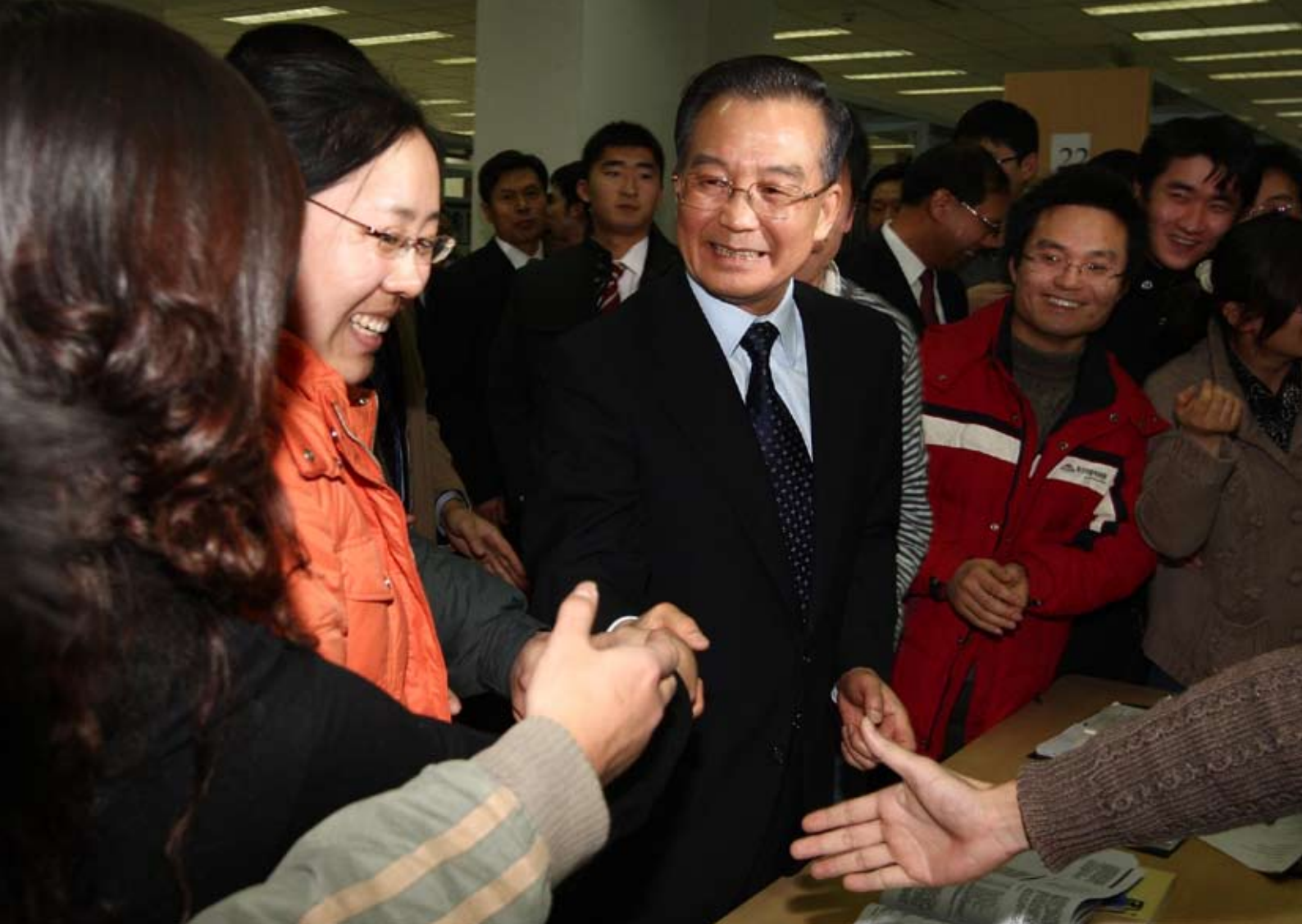
2008年12月20日,国务院总理温家宝在北京航空航天大学与学生们一起就金融危机、就业形势等话题进行交谈