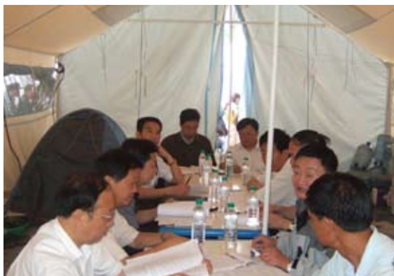
立法调研组在北川擂鼓镇与基层计生工作者座谈

为帮助四川做好有成员伤亡家庭再生育技术服务工作,国家财政部下拨了1亿元专项经费,用于再生育检查、治疗及手术医疗。而对于一些准备重新做父母的家庭来说,年龄、避孕措施、地震带来的精神压力、医疗检查设备缺失等因素都给他们再生育增添了难度。据统计,都江堰市1/3有强烈再生育愿望的育龄夫妇存在一定生育障碍。为此,国家人口计生委印发了《再生育全程服务行动项目工作方案》,要求计划生育技术管理和部门坚持尊重科学、特事特办、全面覆盖、方便群众的原则,对符合规定拟再生育子女的家庭,免费提供孕前、孕期和分娩三个阶段服务,帮助他们重圆做父母的梦想。并专门成立了项目专家组和六省支援医疗队,奔赴灾区为符合再生育政策的对象免费提供技术和咨询服务。国家人口计生委还与四川省人口计生委在成都举办了“再生育技术服务培训班”,邀请专家对灾区6个市州、30个县区计划生育服务机构人员进行专门培训。