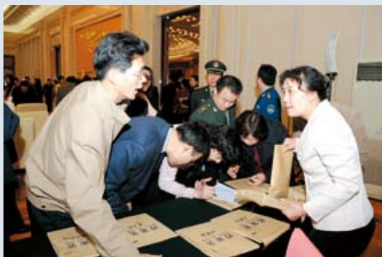
全国人大常委会办公厅代表建议交办会现场