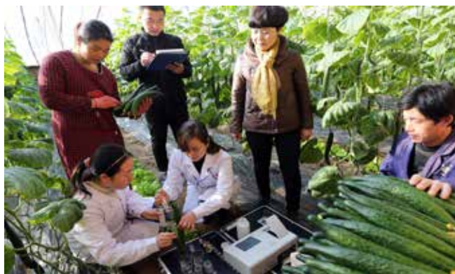
大荔县被陕西省政府确定为“农产品质量安全县”和“食用农产品合格证试点县”。图为该县农检中心的技术人员在埝桥镇群英果品专业合作社大棚基地对黄瓜等产品进行监测。

要解决这些问题,将几个关键信息了解清楚非常重要。报告提出,要在2018年年底完成土壤环境质量调查,摸清农用地土壤污染的面积、分布及其对农产品质量的影响,实施农用地分类管理,着