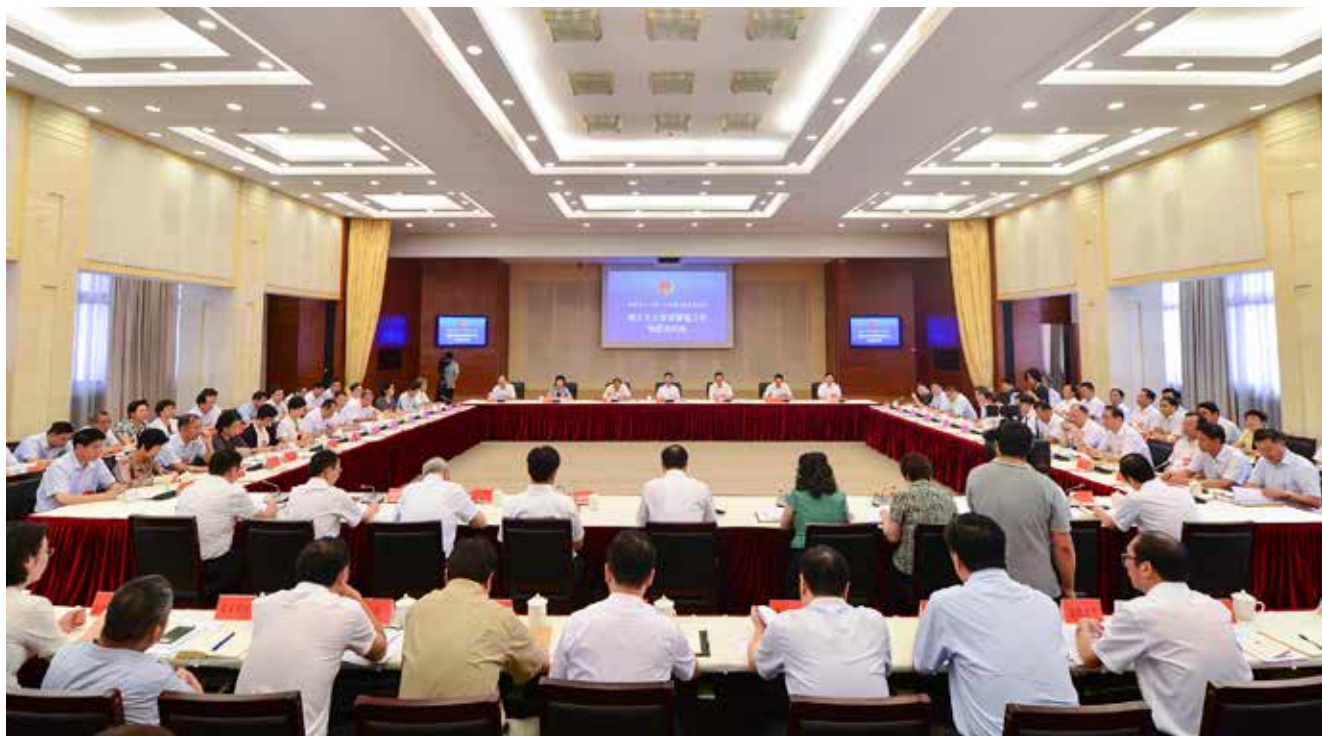
多年来,福建省人大常委会综合运用执法检查、听取审议报告、专题询问等形式,不断加大监督力度,积极推进生态文明建设。图为8月16日,福建省人大常委会开展城乡生活垃圾管理工作专题询问。

国、智慧社会建设作出战略部署。但早在计算机尚未广泛普及的十八年前,时任福建省长的习近平就已经高瞻远瞩地提出了建设数字福建的战略决策,并指出“实施科教兴省战略,必须抢占科技制高点”。今年4月,首届数字中国建设峰会在福州成功举办,习近平总书记专门发来贺信,强调要“以信息化培育新动能,用新动能推动新发展,以新发展创造新辉煌”。可以说,数字福建是习近平总书记关于数字中国建设的思想源头和实践起点。