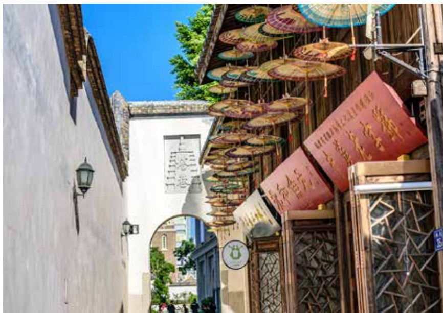
被誉为“半部中国近现代史”的“三坊七巷”历史文化街区,坐落在具有2200多年历史的福州老中心。

保护和传承文化遗产,就是守护城市过去的辉煌、今天的资源、未来的希望。习近平总书记多次强调:“历史文化是城市的灵魂,要像爱惜自己的生命一样保护好城市历史文化遗产。”多年来,福州市人大始终坚持以立法引领推动历史文化名城保护,通过人大监督保障法规“落地生花”,为传承、延续当地