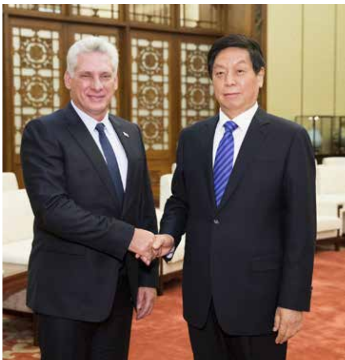
11月8日,栗战书委员长在北京人民大会堂会见古巴国务委员会主席兼部长会议主席迪亚斯-卡内尔。