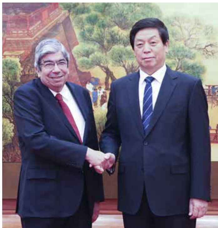
11月19日,栗战书委员长在北京人民大会堂与葡萄牙议长罗德里格斯举行会谈。