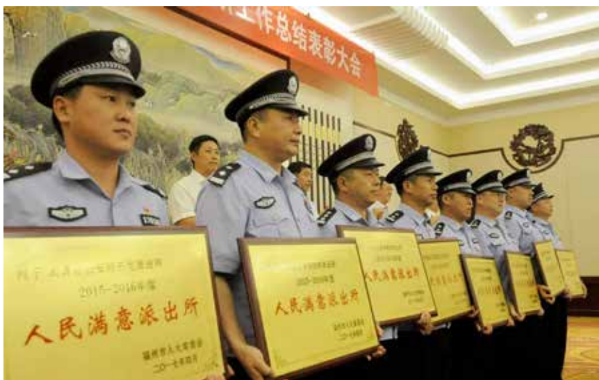
自2001年开始,福州市人大常委会评议公安(边防)派出所工作已连续开展了9次18年。

率、执法工作满意率等抽样调查数据,折算成群众的调查测评分,进一步提高测评分数的客观性,让评议更加贴近市委中心工作、更加突出群众关切。