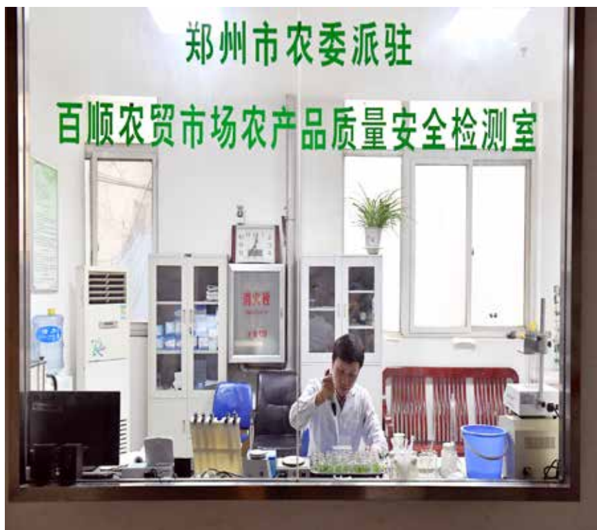
全国共有农产品质检机构3293家,检测人员3.2万人,实现了农产品检测体系市、县基本覆盖。图为郑州市农产品质量安全监测工作人员在对农产品样品进行检测。

其次,要加快完善配套法律法规。建议加快修改动物防疫法等相关法律,加快制定和完善污染防治、资源综合利用、质量追溯等方面的法律法规,加快修订兽药管理条例、饲料和饲料添加剂管理条例等行政法规,研究制定肥料、农膜管理条例。