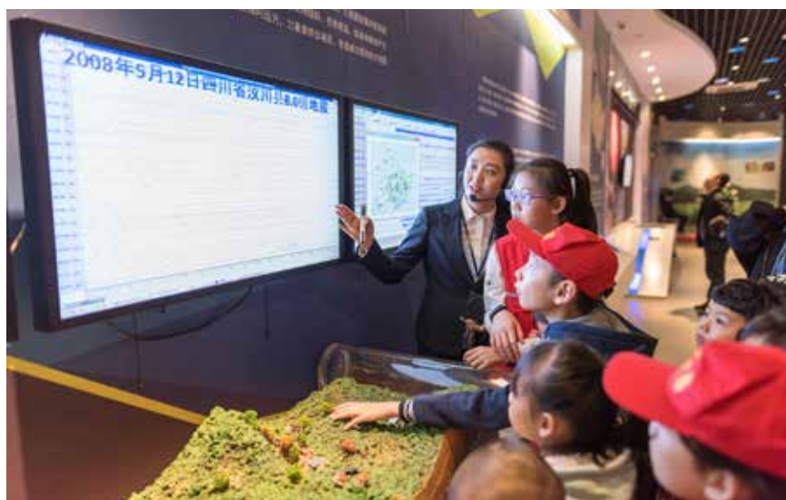
3月25日，黑龙江省防震减灾科普馆举行“强化安全意识，提升安全素养”主题活动。通过地震模拟小屋、地震虚拟仿真、场景逃生训练等多个互动体验，让孩子们掌握地震应急和避险方法，提高防震减灾意识和自救互救能力。

防震减灾法第四十四条明确规定了政府及有关组织宣传普及防震减灾知识的义务和责任。但全国人大常委会防震减灾法执法检查组在检查中发现，社会公众防震减灾意识与高震灾风险的国情要求相比还不适应。社会公众对防震减灾法律和知识的知晓率不高，预防为主和主动减灾的社会氛围还没有完全形成。比如，检查组在一些省发放的调查问卷显示，有的地区超过半数的答卷民