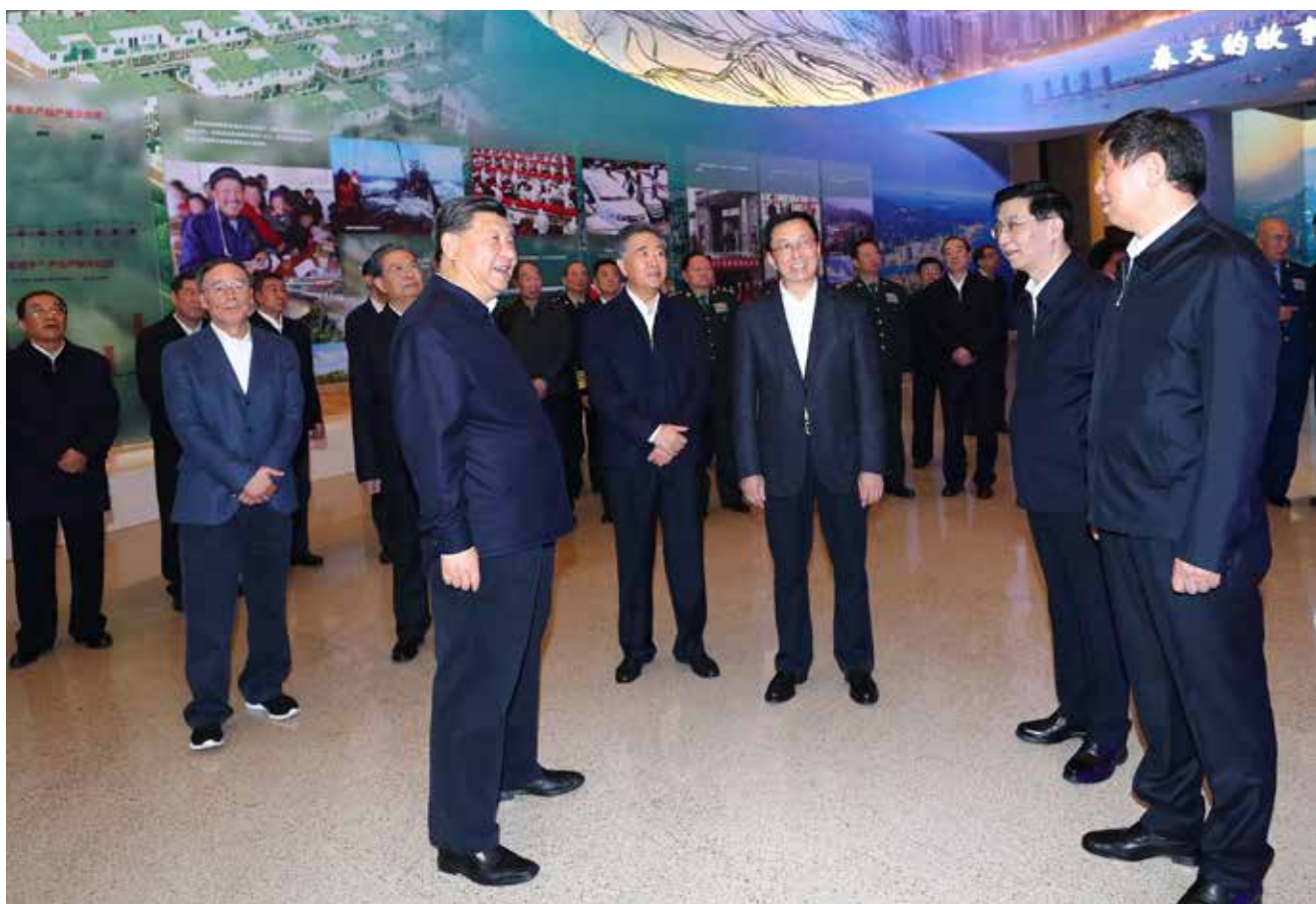
11月13日,党和国家领导人习近平、栗战书、汪洋、王沪宁、赵乐际、韩正、王岐山等在国家博物馆参观“伟大的变革——庆祝改革开放40周年大型展览”。