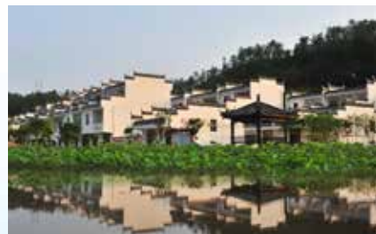
乡村振兴让人民群众迈向全面小康生活