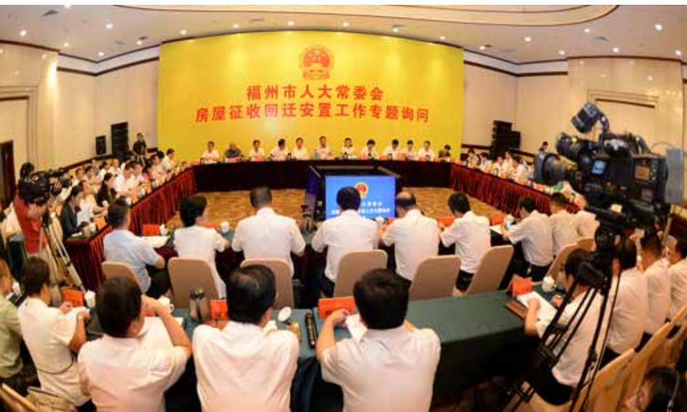
6月28日，福州市人大常委会就房屋征收回迁安置工作开展专题询问。

经营者、行业的从事者和花农、茶农们都感到有保障、有希望、有奔头。”连任多届的省市两级“老代表”、春伦茶业有限公司董事长傅天龙感慨地说。