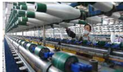
玻纤新型复合材料产业蓬勃发展，获批中国玻纤新型复合材料产业集群发展示范基地

改革开放只有起点，没有终点。上犹正以时不我待、只争朝夕的追求，敢想敢干，奋力拼搏，努力在新起点上书写高质量发展的时代荣光。