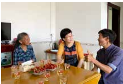
干群连心，鱼水情深

“古老的门楣，光耀着新墙，客家的风情渊远流芳；寻遍万水千山，来到你身旁；何以解乡愁，唯有那犹江……”一首悠扬的歌曲，唱出了这方土地上的美丽景象和美好生活。四十年光辉历程，上犹县在改革开放的春风中飞速发展，特别是《国务院关于支持赣南等原中央苏区振兴发展的若干意见》出台实施六年以来，是上犹县改革创新、开拓奋进的六年，更是经济社会发展、城乡面貌变化、人民群众生活改善最显著的六年。上犹县委、县政府团结带领全县广大干部群众感恩奋进、攻坚克难，把党中央和国务院的深情关怀转化为促进振兴发展的强大动力，在绿水青山间绘出了一幅幅美丽画卷。