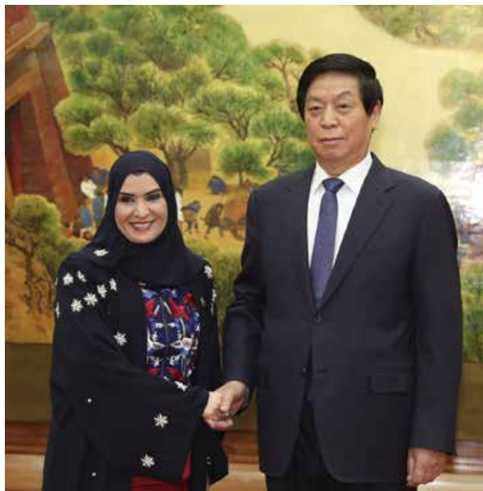
11月5日,栗战书委员长在北京人民大会堂与阿联酋联邦国民议会议长古拜希举行会谈。