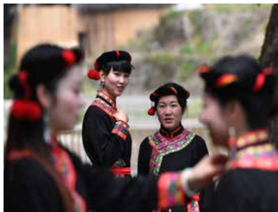
宁德市是全国畲族聚居地区。在漫长的历史中，畲族人民创造了灿烂的民族文化。

法律的生命力在于实施。至今年7月，条例已实施整整一年。一年来，条例实施的效果如何？为了一探究竟，市人大常委会于今年7月至9月对条例实施情况开展调研，并于10月听取审议了市