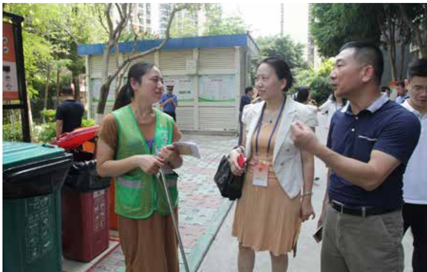
厦门市人大代表向垃圾分类督导员了解小区垃圾分类投放情况。

习近平总书记盛赞厦门“是一座高颜值的生态花园之城，人与自然和谐共生”。有经济特区立法的助力，厦门更添自然之美、文明之美。我们相信，在厦门市人大及其常委会持续推动下，厦门的明天一定更加美好。★