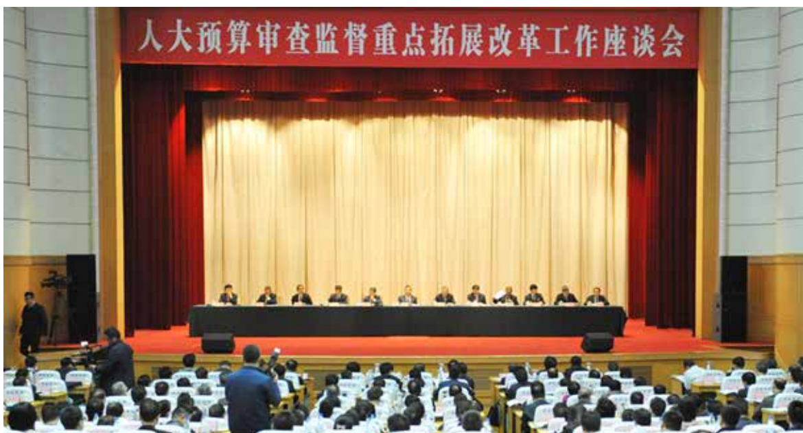
人大预算审查监督重点向支出预算和政策拓展改革工作座谈会现场

审查监督支出预算的总量与结构的重点是,正确处理好政府与市场的关系,使市场在资源配置中起决定性作用、更好发挥政府作用;支持坚决打好“三大攻坚战”,以供给侧结构性改革为主线,支持优化产业结构,推动经济高质量发展,建设现代化经济体系,更好推进党和国家各项事业发展。