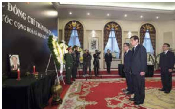
9月27日,受中共中央总书记、国家主席习近平委托,中共中央政治局常委、全国人大常委会委员长栗战书前往越南驻华使馆,代表中共中央和中国政府吊唁越南国家主席陈大光逝世。