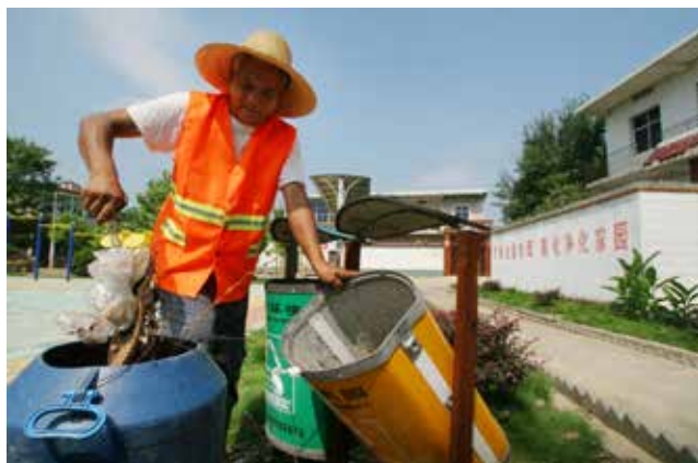
安徽省含山县陶厂镇卜李行政村南周自然村的保洁员正在村内清除垃圾。

三是全面加强人才队伍的融合发展机制与保障体系的建立。通航产业需要大量的、具有专业技能和实际经验的人员参与，部队转业飞行员、工程师、专业技术人员都是通航产业发展急需的核心人才资源。实现部队人才队伍与地方产业发展的互补，要依靠政策指导、市场需求、保障机制形成有效的融合。✘