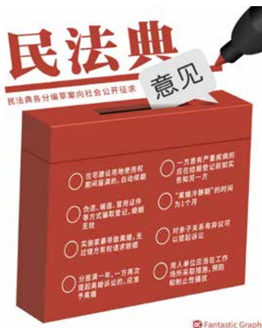
2018年9月5日,民法典各分编草案在中国人大网公布,向社会公开征求意见,征求意见截止日期为2018年11月3日。草案中,诸多社会关注度高且与民众生活息息相关的条款,备受关注。

四是促进生态文明建设。落实民法总则绿色原则的要求,草案规定,当事人在合同履行中应当遵循诚信原则,根据交易习惯负有节约资源、减少污染的义务,在合同终止后负有旧物回收义务;还规定买卖合同的出卖人依法负