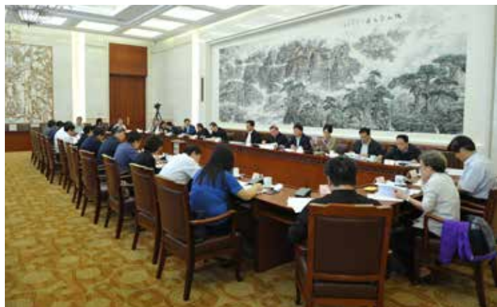
9月25日,全国人大常委会防震减灾法执法检查组第二次全体会议在京举行,研究讨论执法检查报告稿,部署提请常委会审议的各项准备工作。