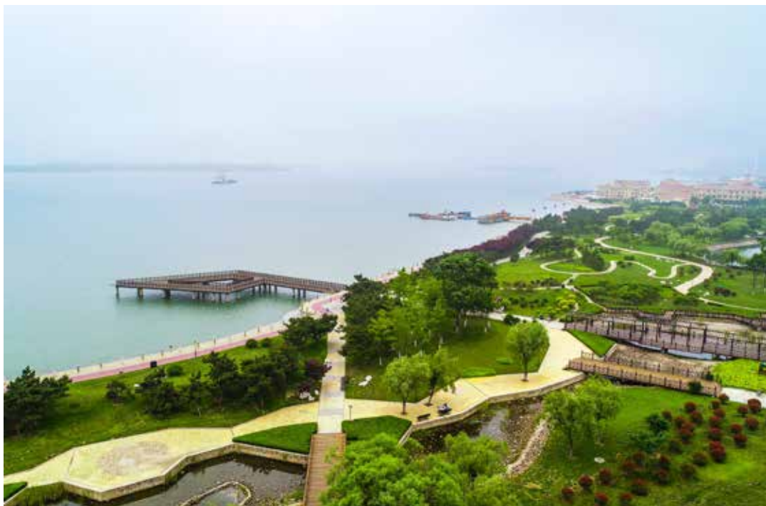
青岛西海岸新区唐岛湾 畔掠影。

污染治理基础薄弱。这一系列问题,都需要坚持问题导向、拿出铁腕手段,进行有针对性的治理。