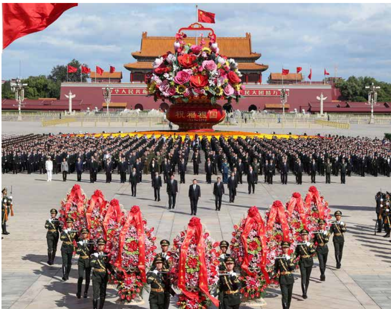
9月30日上午,党和国家领导人习近平、李克强、栗战书、汪洋、王沪宁、赵乐际、韩正、王岐山等来到北京天安门广场,出席烈士纪念日向人民英雄敬献花篮仪式。