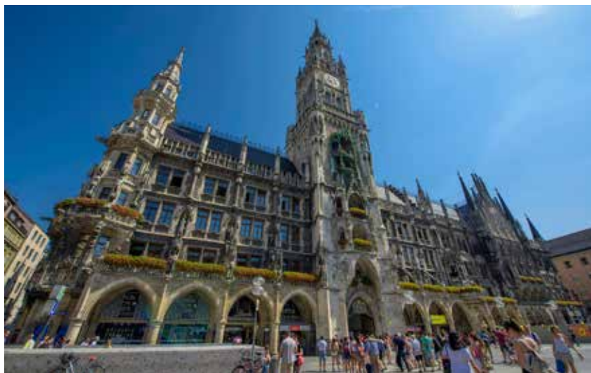
德国慕尼黑玛利亚广场市政中心掠影。

止要求孕哺职员工作，即使产妇自己要求也不行。在下列条件下，全薪假期还将顺延至十二周：