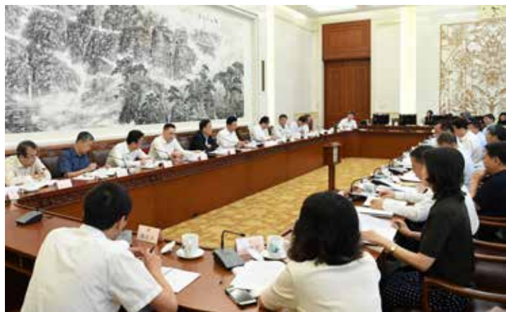
9月21日,全国人大常委会农产品质量安全法执法检查组第二次全体会议在京举行,研究讨论执法检查报告稿,部署提请常委会审议的各项准备工作。