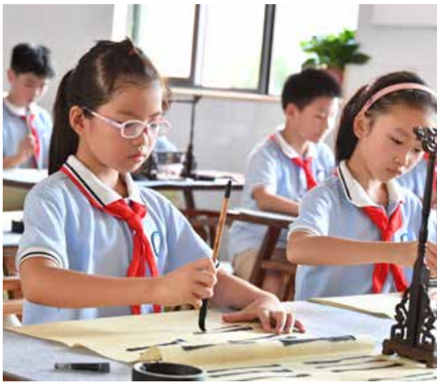
2018年9月3日,安徽省合肥市临泉路第一小学“三点半课堂”开课,学生们免费接受书法、绘画、戏曲、舞蹈和科普等课外兴趣培训。

我建议三点半以后不要简单地放学,学校应该组织三点半到五点的一些教学活动,而且以课外活动为主,特别是以体育锻炼为主、素质体育教育为核心。我在网上也查了一下,每年6月6日是爱眼日,国家卫生健康委员会发布的统计数据触目惊心,小学近视率45.7%,初中近视率74.4%,高中的近视率83.3%,大学近视率87.7%,说明小孩的身体状况绝对不容乐观。是不是在义务教育阶段,特别是小孩长身体阶段不要简单地放回去,放回去是继续在搞文化学习,一般