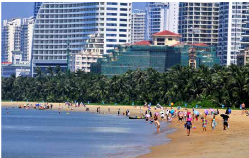
2018年10月3日，游客在海南三亚湾沙滩上休闲度假。

时间回溯到20世纪七八十年代，当时我国海洋环境已经受到不同程度的污染损害，在一些入海河口海区、港湾、内海和沿岸局部区域，环境污染已相当严重。同时，随着我国海洋事业的发展，加强对外国船舶、平台、航空器等排污和倾废的监督管理也成为当务之急。为