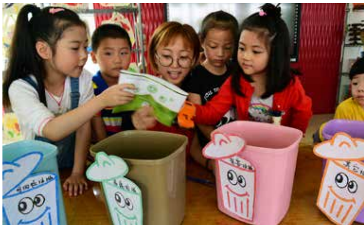
6月13日，江苏省镇江市的志愿者走进江滨幼儿园，指导小朋友学习垃圾分类知识，引导他们增强环境保护意识。

在执法检查的过程中，浙江、广西等地向执法检查组反映：垃圾分类收集运输处理市场化产业链并未完全形成。城市废旧物资回收网络日渐萎缩，废旧物资回收网络与生活垃圾清运网络脱节割裂现象比较严重。山西、天津等地反映：一是固体废物综合利用的财税优惠政策难执行。回收利用企业缺少与实际经营相匹配的增值税进项抵扣，退税政策截止后尚无相关政策安排，行业普遍存在税收负担偏重的实际问题，行业经营利润普遍偏低。一些综合利用产品尚未列入财税优惠目录，存在政策落实难、执行有偏差等问题。部分附加值低、公益性强的废旧商品回收尚无持续性