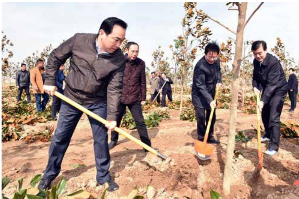
盐城市委书记、市人大常委会主任王荣平(左一)在射阳县金海林场与干部群众一起参加义务植树活动。

盐城是后发地区,有着强烈的增长冲动,可如果盲目发展,又将对生态环境产生威胁。盐城发展的最大本钱就是丰富的自然资源和广阔的生态空间,既不能“守着金饭碗,叫着没饭吃”,更不能重蹈“先污染后治理”的旧辙。市领导班子深切认识到绿水青山就是金山银山,破解盐城的两难甚至多难,就要