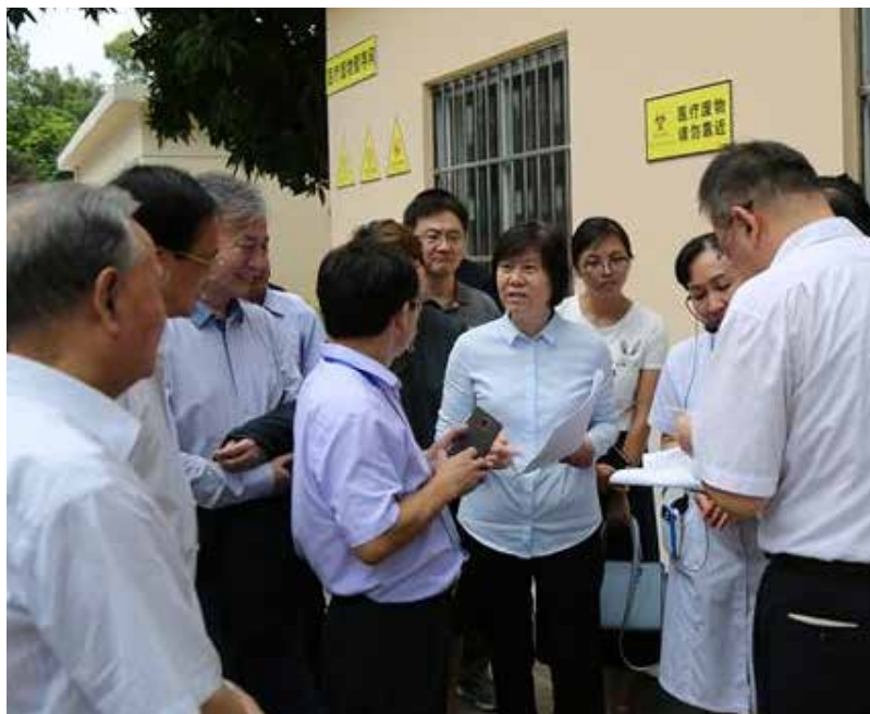
7月18日,沈跃跃副委员长带队在广西检查医疗废物收集和贮存情况。