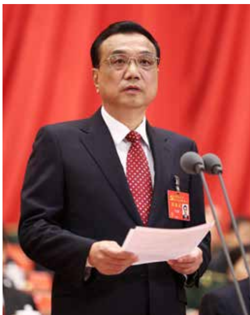
10月18日，中国共产党第十九次全国代表大会在北京人民大会堂开幕。李克强同志主持大会。