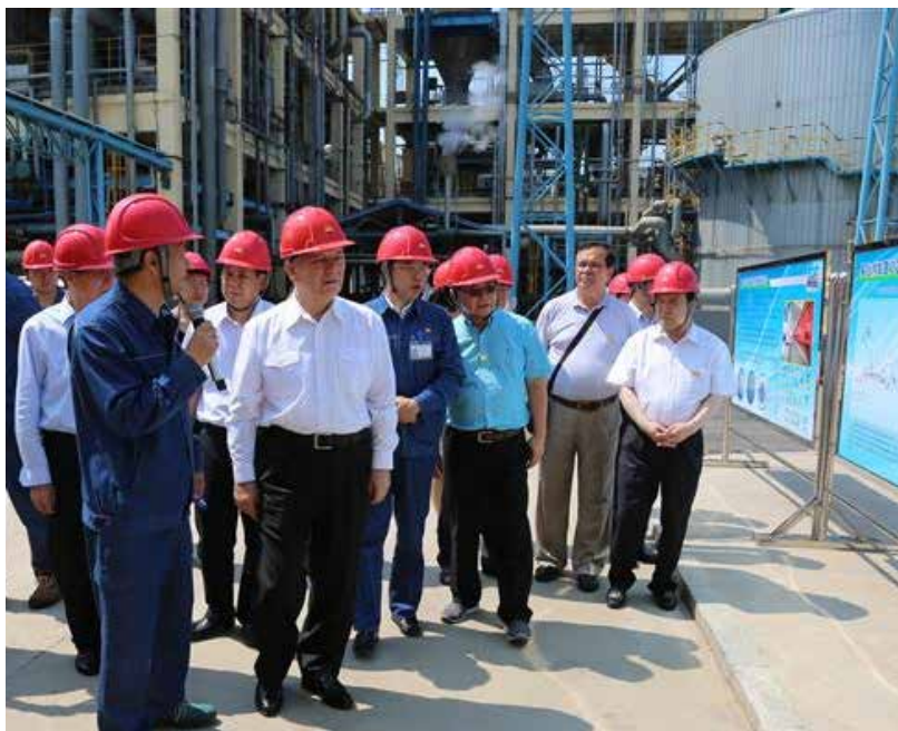
7月5日,艾力更·依明巴海副委员长带队在吉林开展固体废物污染环境防治法执法检查。

筑垃圾回收再利用状况。他说,要树立绿色循环发展理念,积极推进固体废物回收处理加工产业化,变废为宝、化害为利。