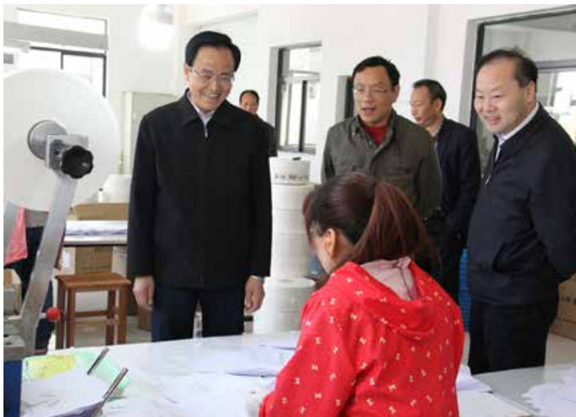
镇江市人大常委会副主任张洪水（左一）走访企业。

“实体经济作为国民经济的根基，对提供就业岗位、改善人民生活、实现经济持续发展和社会稳定具有重要意义，是一个城市保持竞争力的关键。镇江人大常委会围绕服务实体经济开展专项工作评议，抓到了大家的心坎儿