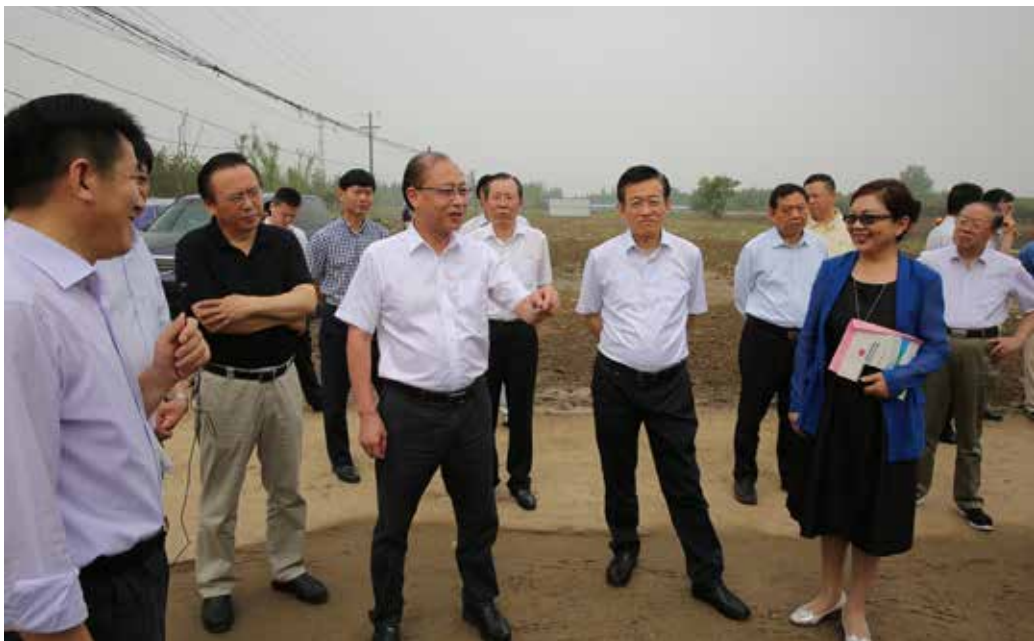
南通市人大常委会组成人员深入基层开展工作评议调研。

践表明，人大常委会通过评议帮助政府部门发现问题、改正问题、推动工作是切实可行的，而且是富有成效的，是“实化、强化”人大监督工作的有效举措。早在1992年，时任福州市委书记、市人大常委会主任的习近平就对福州市开展的评议工作给予充分肯定，他说：“开展评议活动是代表表达政见、进行政治参与的一种好形式，也开拓了人大监督工作的新途径。”好的形式更需要好的实践探索。换届以来，新一届南通市人大常委会在认真总结发扬以往评议经验的基础上，进一步创新评议机制，完善评议方法，实化评议举措，走出了富有南通特色的评议监督之路。