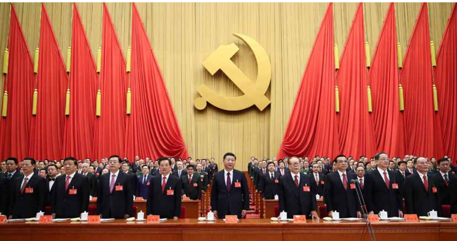
10月18日，中国共产党第十九次全国代表大会在北京人民大会堂开幕。这是习近平、李克强、张德江、俞正声、刘云山、王岐山、张高丽、江泽民、胡锦涛在主席台上。