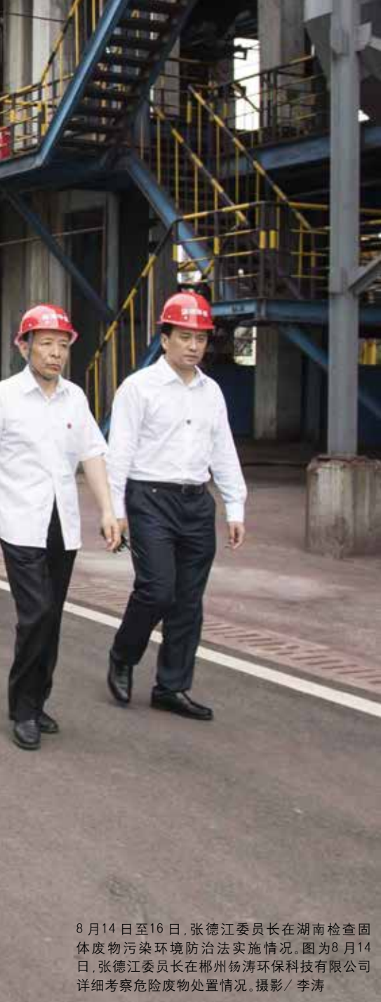
8月14日至16日,张德江委员长在湖南检查固体废物污染环境防治法实施情况。图为8月14日,张德江委员长在郴州杨涛环保科技有限公司详细考察危险废物处置情况。

跃、张平、艾力更·依明巴海副委员长和环资委陆浩主任委员担任副组长。张德江委员长亲自主持检查组全体会议并讲话。他指出,要坚决贯彻以习近平同志为核心的党中央关于推进生态文明建设的重大决策部署,扎实开展固体废物污染环境防治法执法检查,深入推进环境保护和污染防治工作,加快实现生态环境全面改善。