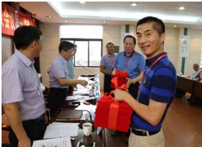
苏州市相城区太平街道人大工委为“议政代表”颁发聘书。

加强保障,发挥“议政代表”会议制度作用。为了更好地发挥新制度功能,相城区人大常委会进一步指导各街道人大工委健全保障机制。各街道都建立了“议政代表小组”和由专业人员组成的“议