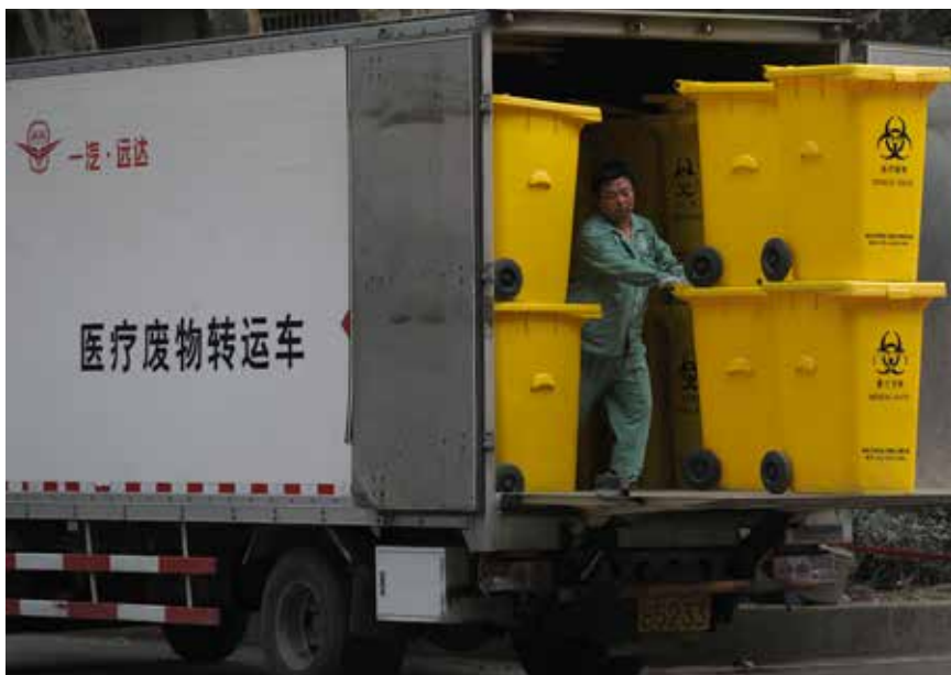
我国每年产生医疗废物约135万吨。图为工作人员在江苏省南京市一家医院转运医疗废物和医疗垃圾。

危险废物的处置是世界性难题。目前,我国每年产生工业危险废物约4000万吨,医疗废物约135万吨。有专家分析,这一数据只少不多。根据2005年组织开展的全国危险废物和医疗废物处置设施普查中获得的危险废物产生量数据(2004年全国26个省市),第一次全国污染源普查获得的危险废物产生量数据(2007年),以及对部分地区进行调查分析后得到的危险废物产生量数据表明,调查数据均高于同年或同地的环境统计数据。可见,我国的危险废物管理存在底数严重不清的问题。目前,全