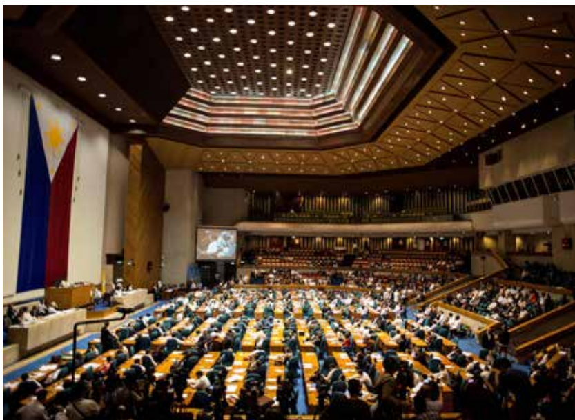
菲律宾国会会议现场

选举日到来之前,全国选举职位的候选人有90天的竞选期,地方选举职位的候选人有45天的竞选期。