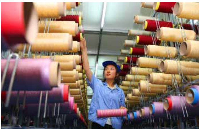
山东省阳信县龙福环能科技股份有限公司自主研发了从废旧塑料瓶中提取再生涤纶长丝的技术，解决了废旧聚酯降解和循环利用的世界性难题。

今年6月至8月，中共中央政治局常委、全国人大常委会委员长张德江率全国人大常委会执法检查组，在陕西、