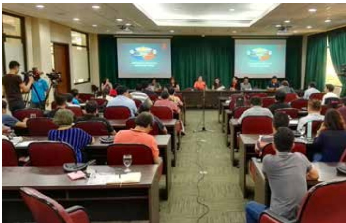
2016年5月11日，菲律宾国会官员举行记者会，介绍正、副总统选举计票日程安排。

举了包括正、副总统在内的大批公职人选，包括总统、副总统、12名参议员、近300名众议员，81个省、144个市、1490个镇以及棉兰老岛穆斯林自治区的地方政府首长和议员，共计18069个公职岗位。