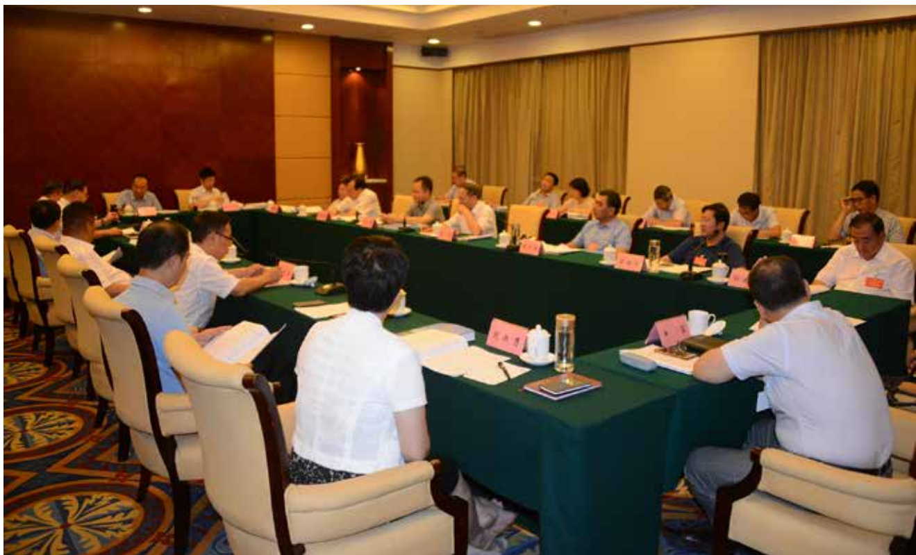
9月6日至7日,第二十三次全国地方立法工作座谈会在广西壮族自治区南宁市召开。图为分组会议现场。