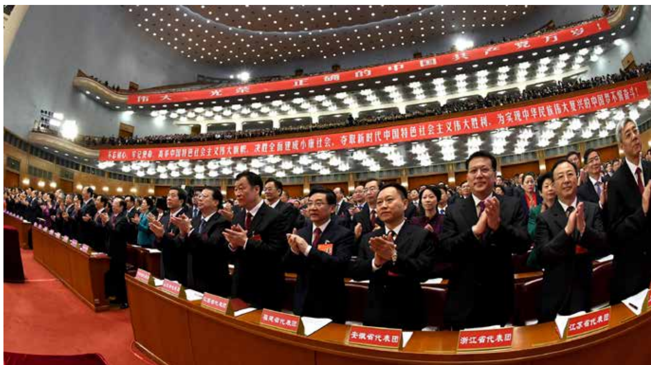
10月18日，中国共产党第十九次全国代表大会在北京人民大会堂开幕。

系建设；坚决打赢脱贫攻坚战；实施健康中国战略；打造共建共治共享的社会治理格局；有效维护国家安全。