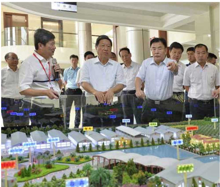
7月18日,张平副委员长带队在福建检查农业一体化项目养殖废弃物循环利用情况。