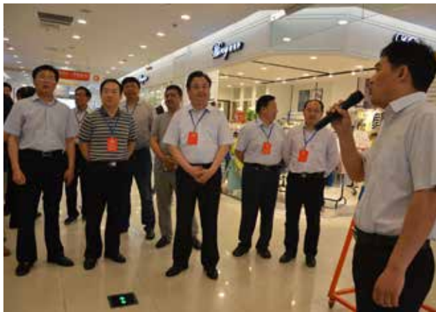
睢宁人大常委会举行百姓办事“零障碍”工程专项工作评议暨省、市、县三级人大代表集中视察活动。

按照“硬件升级、软件过硬”的工作思路，睢宁县对全县39个“人大代表之家”进行规范化建设，着力健全工作机制，丰富代表活动内容，提升服务功能。