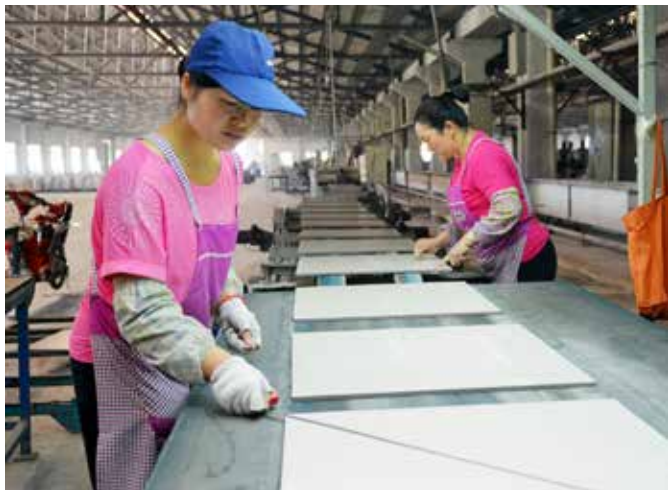
内蒙古库布其沙漠经济科技联盟等单位以无用沙漠沙和工业废物粉煤灰作为部分陶瓷原料，生产出环保沙制瓷砖。

一是固体废物产生量大，历史遗留尾矿库问题多，污染防治压力大，需要引起高度重视。如陕西省南水北调中线工程水源涵养地分布了244座重金属尾矿库，建设标准低，风险防范措施不完