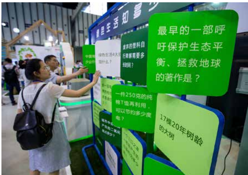
2017 国际环保新技术大会在南京国际博览中心开幕,重点围绕大气、水、固体废物等主题,举办高层次国际研讨会及技术交流会议等。

在全国人大常委会固体废物污染环境防治法执法检查组第一次全体会议上,国务院有关部门汇报了固体废物污染环境防治法贯彻实施情况。近年来,国务院不断加大固体废物污染防治工作力度。去年以来专门印发生产者责任延伸制度推行方案、生活垃圾分类制度实施方案、加快推进畜禽养殖废弃物资源化利用的意