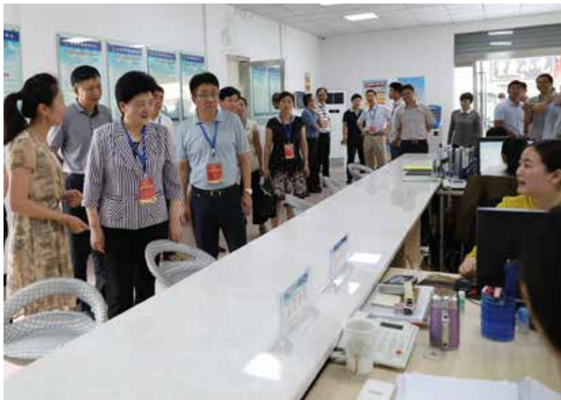
连云港市人大常委会开展“助推平安连云港建设”专项行动，图为视察组视察海州街道办事处。

推进重大项目建设，人大主动靠前、不遗余力。中哈物流合作基地是“一带一路”的首个国际合作实体项目，也是中哈两国启动陆海联运的良好开端。在基地建设进程中，市人大常委会找准定位，主动作为，把“加快中哈物流合作基地项目发展”建议作为重点督办建议，提出破解制约瓶颈的相关意见，全力助推连云港核心区建设，取得了明显效果，该基地正在被打造成为“一带一路”合作倡议标杆和示范项目。30万吨级航道二期工程、连徐高铁倍受社会关注，市人大常委会将“关于支持连云港30万吨级航道二期工程建设的建议”“关于推进陇海客运专线徐连段建设的建议”列为重点督办建议，使建议