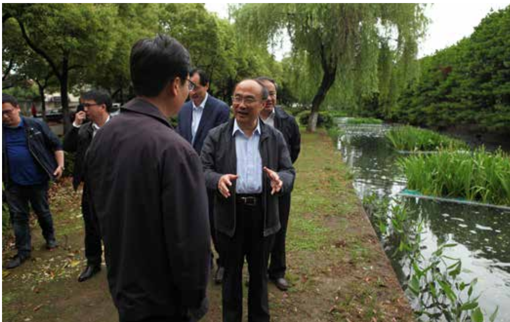
苏州市人大常委会组成人员就苏州国家历史文化名城保护条例进行立法调研。

2016年年初，苏州市第十五届人民代表大会第五次会议作出《关于加强苏州国家历史文化名城保护的決定》（以下简称《決定》）。市人大常委会强调，要树立“规划即法”意识，加强生态空间管制，坚决守好历史文化名城主体功能区规划红线和生态保护区红线，把江南水乡传统风貌保护放在更加重要的位置。同时，该《決定》明确要求加快推进历史文化名城保护立法工作，市人