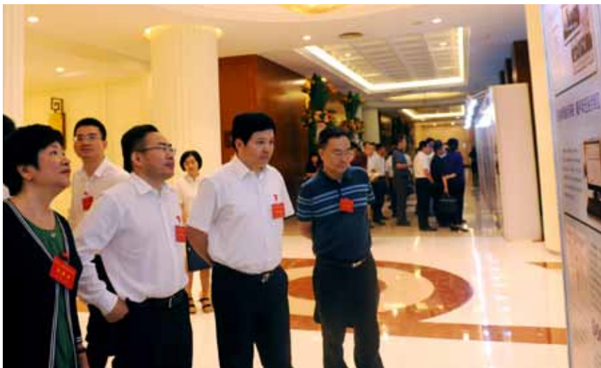
2017年7月4日，财政部副部长刘伟观看各省人大预算联网监督工作版图展。

根据会议安排，我就财政部门积极支持配合人大，共同做好推进预算联网监督工作，讲几点意见，供大家参考。