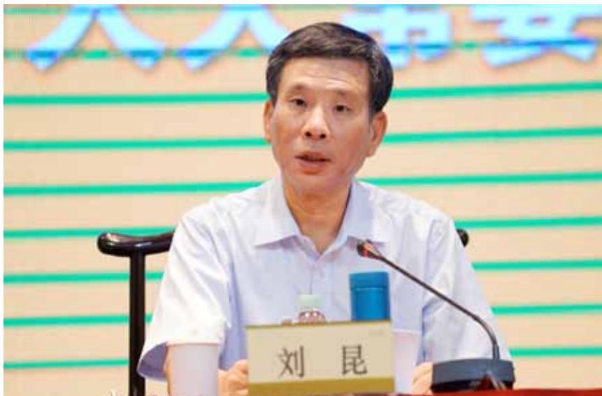
2017年7月4日，全国人大财经委副主任委员、全国人大常委会预算工委主任刘昆在推进地方人大预算联网监督工作座谈会上讲话。

文 / 全国人大财政经济委员会副主任委员、全国人大常委会预算工作委员会主任 刘 昆