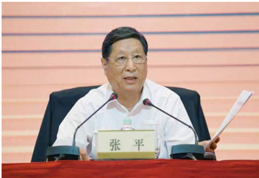
2017年7月4日,推进地方人大预算联网监督工作座谈会在广州召开。全国人大常委会副委员长张平出席会议并讲话。