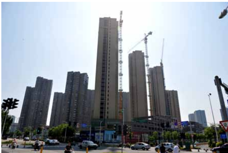
2017年8月5日，福州一处正在建设中的楼盘。针对近一段时间房地产市场出现违规销售的苗头，福州市房管局、市建委等五部门日前联合发布《关于进一步规范商品房销售行为的通知》，严禁捆绑搭售、价外加价、捂盘惜售和分批销售等违规行为。

水平平稳、稳中向好的发展态势，主要经济指标保持在合理区间，为完成全年预期目标奠定了坚实基础。这表明党中央、国务院出台的一系列稳增长、调结构政策措施效果正在显现，各地区、各部门在以习近平总书记为核心的党中央坚强领导下，积极贯彻落实中央经济工作会议精神和十二届全国人大五次会议要求，着力推动各项工作取得实效，为党的十九大胜利召开创造了良好的经济环境。这些成绩的取得来之不易，要充分肯定，也要倍加珍惜。