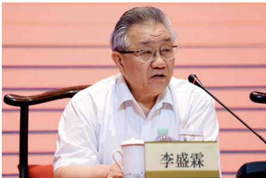
2017年7月5日，全国人大财经委主任委员李盛霖在推进地方人大预算联网监督工作座谈会上作总结讲话。

为期两天的推进地方人大预算联网监督工作座谈会，就要结束了。这次会议安排紧凑，内容丰富，达到了预期效果。我根据会议的内容和交流讨论情况，代表全国人大财经委、全国人大常委会预算工委和财政部对会议作个总结。