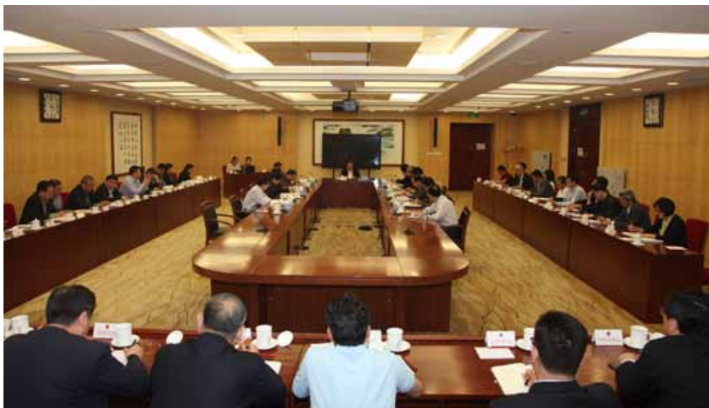
2017年4月28日,全国人大常委会副委员长兼秘书长、机关党组书记王晨同志主持召开机关党组理论学习中心组集体学习扩大会议暨推进“两学一做”学习教育常态化制度化动员部署会议。

才有战斗力!通过“两学一做”学习教育,全国人大机关各级党组织认真贯彻落实党中央的决策部署,广大党员努力向“四讲四有”对标,筑牢堡垒、育强细胞,为全面依法治国凝聚澎湃动力。