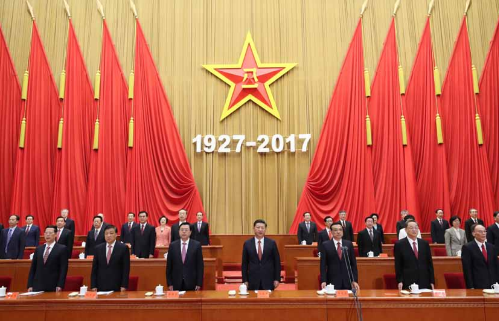
8月1日,庆祝中国人民解放军建军90周年大会在北京人民大会堂隆重举行。中共中央总书记、国家主席、中央军委主席习近平和李克强、张德江、俞正声、刘云山、王岐山、张高丽等出席大会。