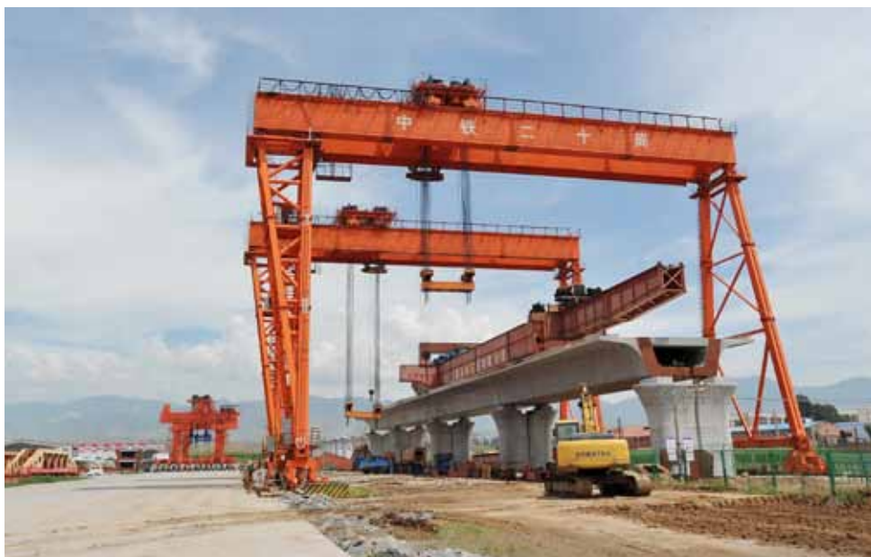
2017年8月3日,河北张家口,京张高铁崇礼支线赵川特大桥吊梁施工现场。 图/视觉中国

习近平总书记强调,实现京津冀协同发展是一个重大国家战略。我的理解是,京津冀协同发展不仅关乎这一地区的长远发展,而且应当为破解全国特大城市发展难题和发展其他都市圈提供可复制的经验。中国的现代化应当是由能够打破行政区划壁垒的,若干类似于京津冀、长三角、珠三角、长珠潭、成渝等大都市圈、都市圈支撑的现代化。