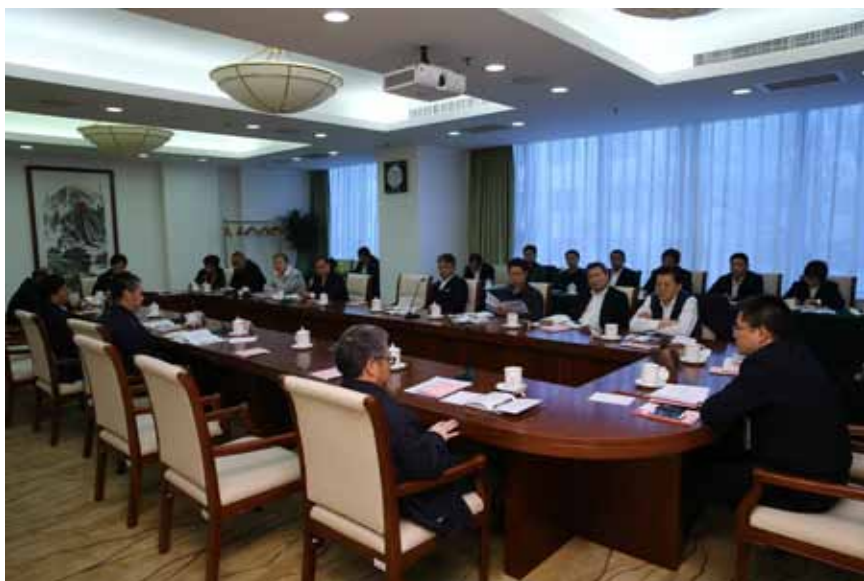
2016年11月30日,全国人大机关基层党组织书记围绕学习贯彻党的十八届六中全会精神做好基层党组织工作进行分组讨论。