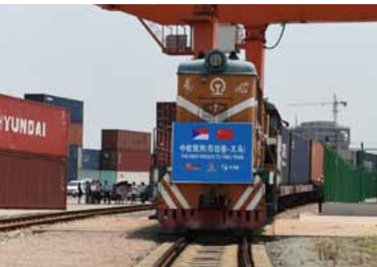
2017年8月4日,首趟从布拉格发出的X8074次中欧班列抵达义乌。

今年上半年的国民经济发展,总体运行情况良好,有些数据明显好于预期,这些成绩来之不易,应当倍加珍惜和维护。同时,在经济发展趋好面前,也存在一些需要高度关注并着力解决的问题。