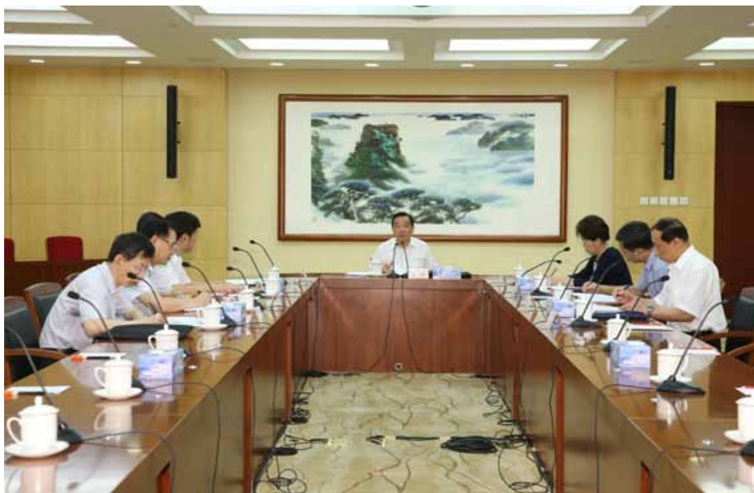
2017年7月26日，习近平总书记在省部级主要领导干部“学习习近平总书记重要讲话精神，迎接党的十九大”专题研讨班开班式上发表重要讲话。7月28日上午，王晨副委员长兼秘书长主持召开机关党组会议，专题学习习近平总书记重要讲话精神。

“‘两学一做’学习教育是加强党的思想政治建设的一项重大部署，是协调推进‘四个全面’战略布局特别是推动全面从严治党向基层延伸的有力抓手。全国人大机关各级党组织、全体党员要认真贯彻落实党中央的部署要求，扎实开展‘两学一做’学习教育，确保取得实际成效。”2016年6月7日下午，中共中央政治局常委、全国人大常委会委员长张德江以普通党员身份来到了所在党支部秘书局党总支第三支部，围绕学习党章党规和习近平总书记系列重要讲话，以“坚定信心，永远跟党走”为题，为支部成员讲了一堂内容丰富、精彩生动的党课。