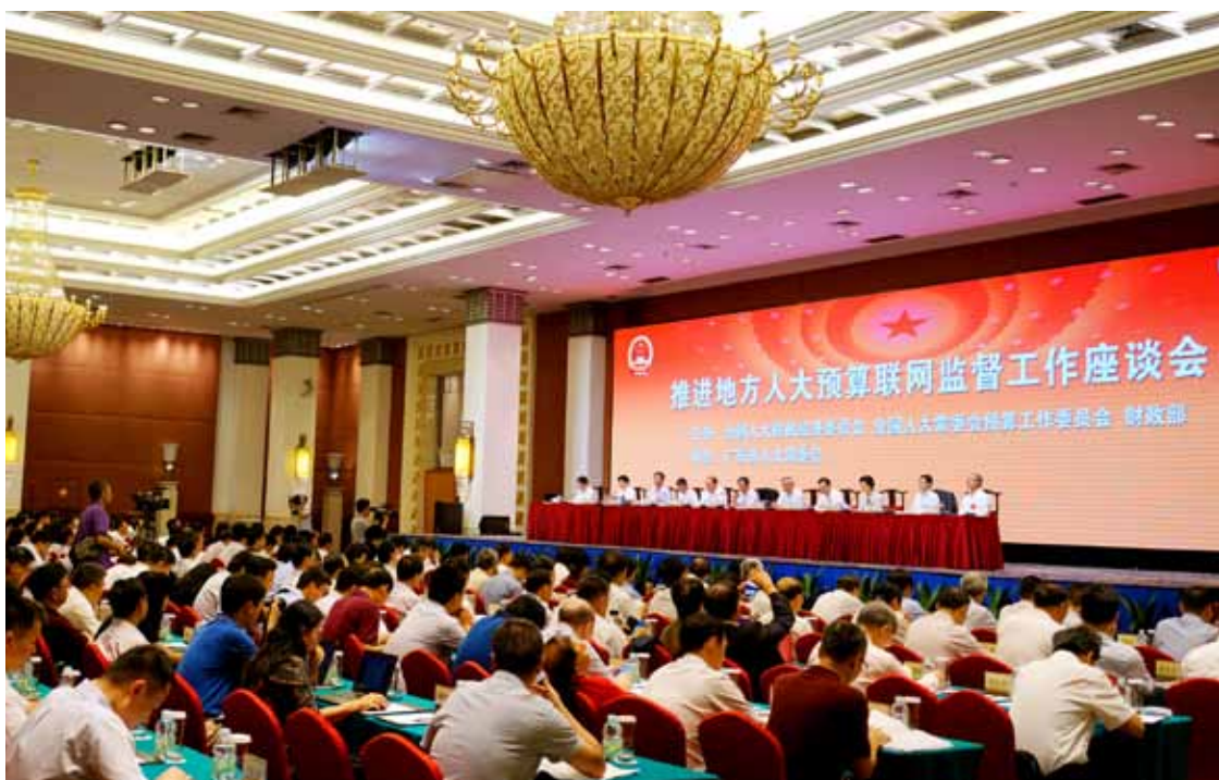
2017年7月4日,推进地方人大预算联网监督工作座谈会在广州召开。图为会场。