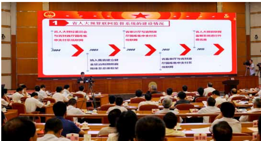
2017年7月4日,推进地方人大预算联网监督工作座谈会在广州召开。图为会场。

在全国人大常委会的悉心指导及全国人大财经委和常委会预算工委的大力支持下,在广东省委的正确领导下,广东省人大常委会认真贯彻实施预算法、监督法,积极探索开展人大预算联网监督工作。