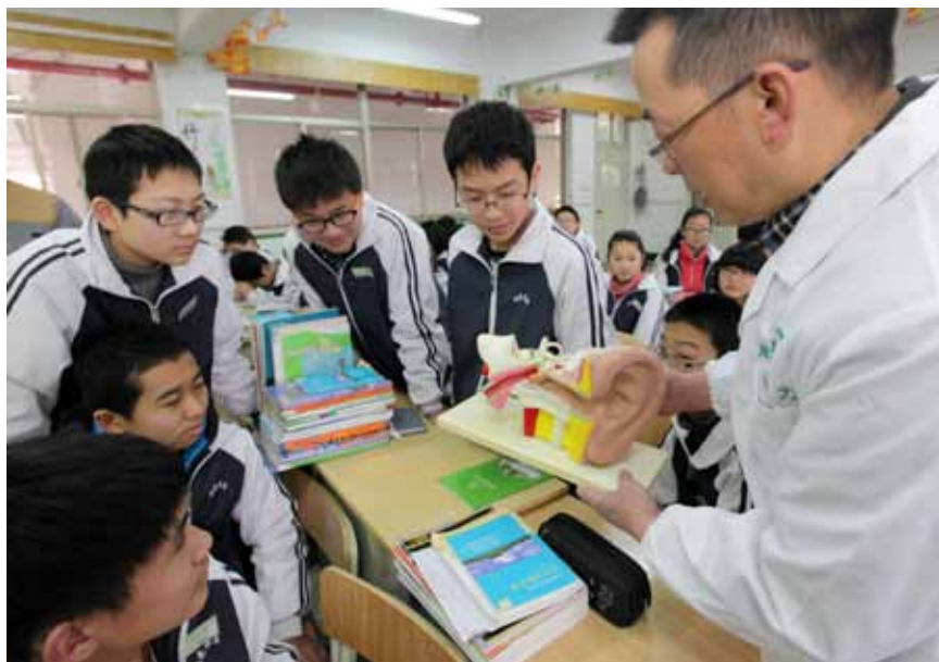
浙江省诸暨市某中学邀请专业人员对学生进行爱耳健康的专业知识讲座。

职，NGO（非政府组织）广泛参与。许多健康教育工作成绩突出的国家都在国家和地区层面建立了完善的健康教育机构网络。如澳大利亚于1994年成立了国家健康促进中心，同时州卫生部下设疾病预防与健康促进中心，州政府下设17个区卫生局，均设有健康促进科。