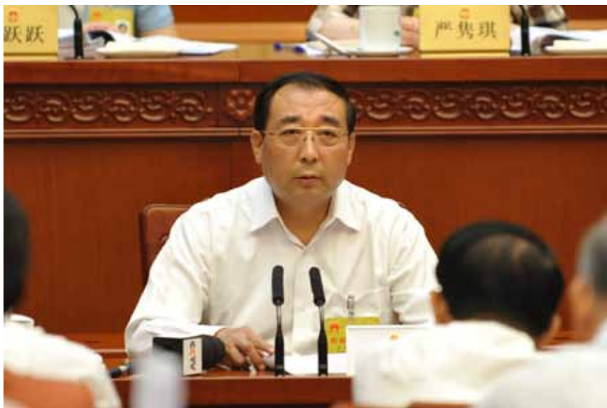
全国人大常委会委员、全国人大法律委员会副主任委员丛斌。

2017年3月公布的民法总则确立了“生态环境保护原则”,其第九条规定,“民事主体从事民事活动,应当有利于节约资源、保护生态环境。”首次将生态环境保护直接提升到民法基本原则高度。民法通则第一百二十四条明确规定:“违反国家保护环境防止污染的规定,污染环境造成他人损害的,应当依法承担民