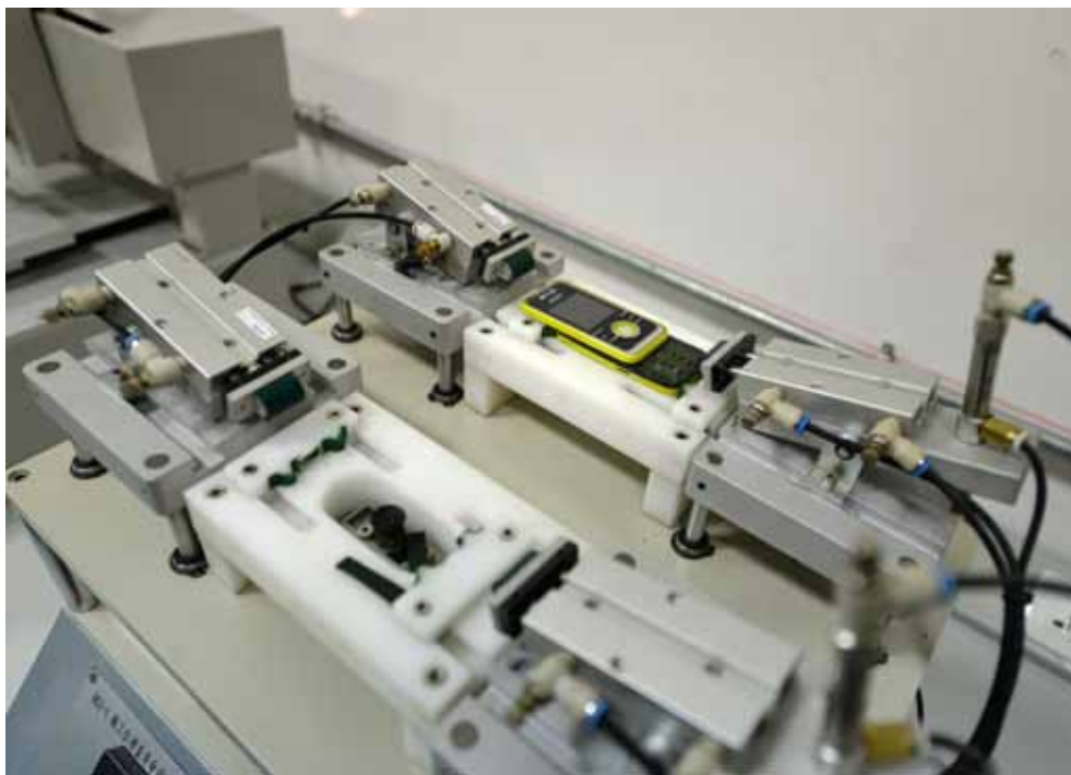
2015年12月16日,广东河源,出厂手机都要来到国家通讯终端产品质量监督检验中心进行各种指标的检验检测,达到标准才能够上市销售。