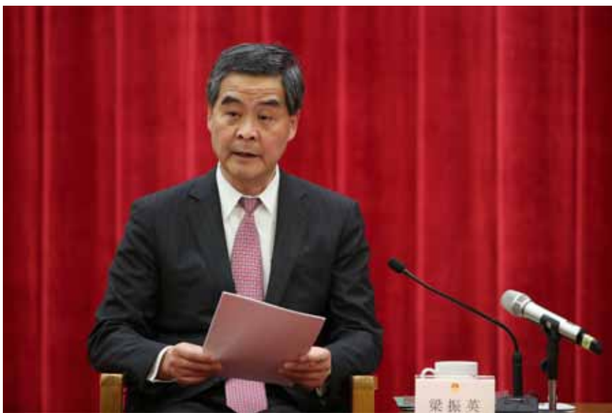
5月27日，纪念中华人民共和国香港特别行政区基本法实施20周年座谈会在北京人民大会堂隆重举行。图为香港特别行政区行政长官梁振英在座谈会上发言。

务实性方面：基本法的条文切合落实“一国两制”的实际情况，务实性强。其中一个例子，就是中央对香港特别行政区行政长官的实质性任命权。香港是一个特别行政区，并不是主权国家，因此香港的民主和民主选举，只可