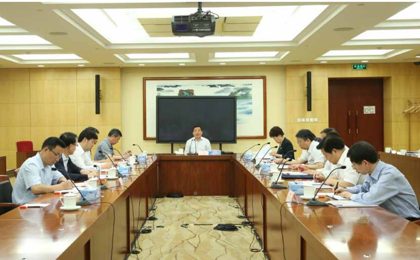
5月26日上午,全国人大常委会副委员长兼秘书长、机关党组书记王晨同志主持机关党组理论学习中心组集体学习,认真学习贯彻习近平总书记关于发展完善人民代表大会制度、发展完善社会主义民主法治的重要论述。

宏观问题进行深刻思考和精辟阐述,还表现在全面加强和改善对人大工作的领导,每年听取全国人大常委会党组工作汇报,统筹安排和研究决定人大工作中的重大问题和重要事项,对人大工作和建设作出一系列重大决策部署,提出一系列新思想新举措新要求,出台一系列重要指导性文件,为全国人大和地方各级人大做好各方面工作、更好发挥国家权力机关职能作用提供了重要遵循。我们要认真贯彻落实以习近平同志为核心的党中央对人大工作和建设作出的重大决策部署,贯彻落实习近平总书记民主法治思想,紧紧围绕党中央确定的重大立法项目,加强和改进立法服务工作,以良法促发展、保证善治;认真做好全国人大常委会开展执法检查、听取审议工作报告、专题询问、专题调研