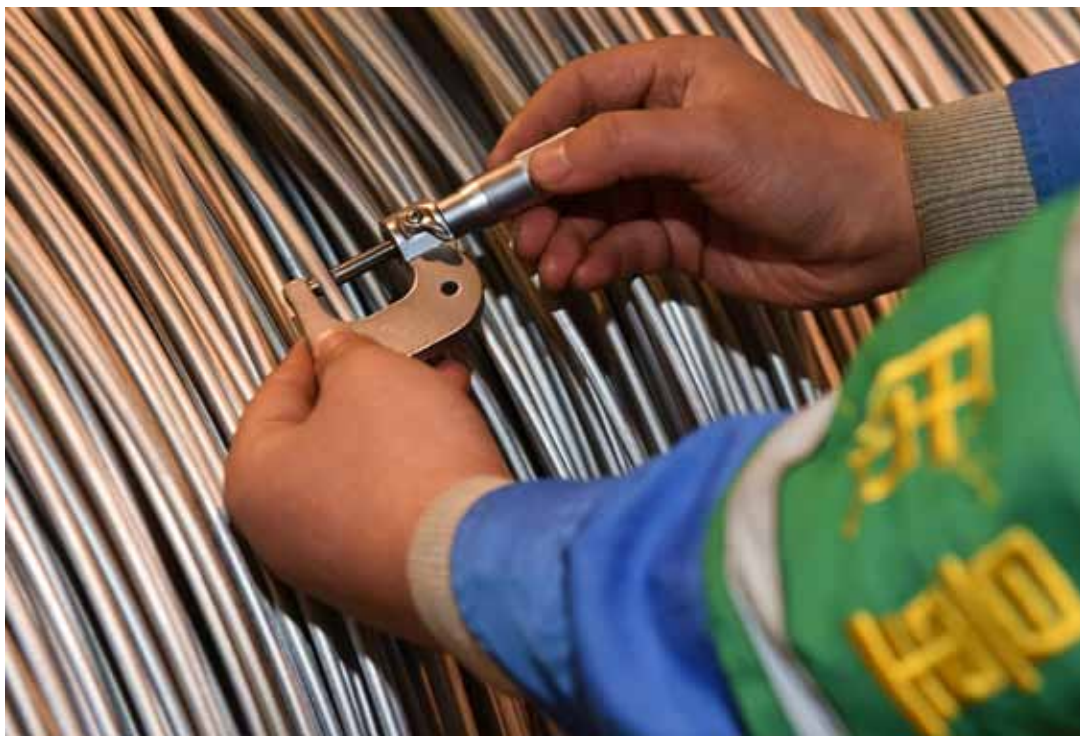
2017年1月10日,太原钢铁(集团)公司正式对外宣布,历时5年攻关,由其研发生产的圆珠笔笔头用不锈钢新型材料近日成功应用于国内制笔厂家。这是当天质检人员在检验一批“笔尖钢”钢丝。

产品进行了快速检测。随后,检查组对位于柳州路的家乐福超市进行了检查,市局执法总队执法人员向检查组现场展示了如何使用金属检测枪对不锈钢制品进行无损检测,并查验了服装的标识标注内容。记者了解到,暗访这一方式在这次赴地方检查中被普遍运用,有利于检查组更加直观地掌握和了解产品质量法的具体实施情况。