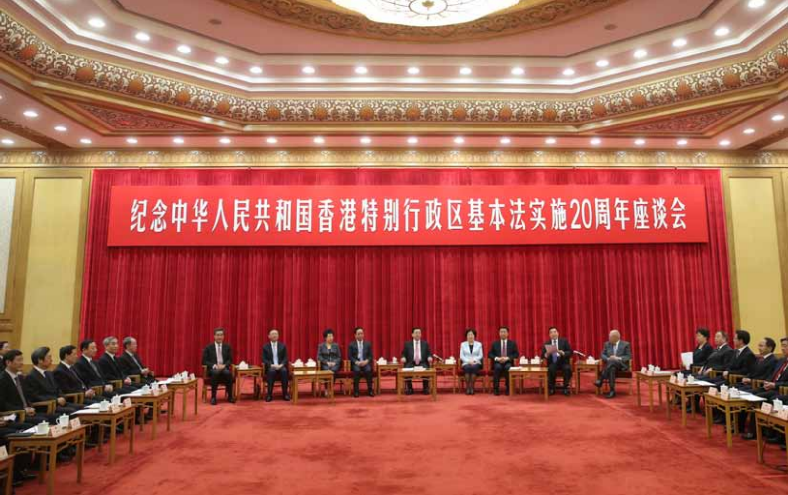
5月27日,纪念中华人民共和国香港特别行政区基本法实施20周年座谈会在北京人民大会堂隆重举行。中共中央政治局常委、全国人大常委会委员长张德江出席座谈会并发表讲话。孙春兰、李建国、李源潮、严隽琪、王晨、杨洁篪、董建华、梁振英等出席了座谈会。