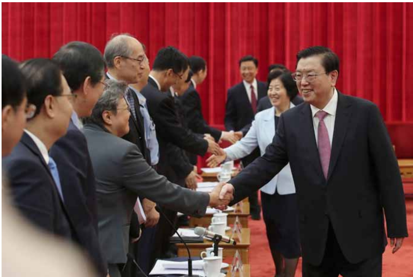
5月27日,纪念中华人民共和国香港特别行政区基本法实施20周年座谈会在北京人民大会堂隆重举行。

长”,要对中央人民政府和特别行政区“双负责”,是连接中央与特别行政区、“一国”和“两制”的重要枢纽,必然要在特别行政区政权机构的运作中处于主导地位。与此同时,特别行政区的行政机关和立法机关既相互制衡又相互配合,司法机关独立行使审判权,各个政权机关依照基本法规定的权限共同维护行政主导体制的正常运作。将来特别行政区政治体制的发展和完善,也必须符合行政主导的基本原则。还需要特别强调的是,依照香港特别行政区基本法产生的特别行政区管治团队,必须由尊重中华民族、诚心诚意拥护祖国对香港恢复行使主权、不损害香港繁荣稳定的爱国者组成。尤其是处于政治体制核心位置的行政长官,要符合爱国爱港、中央信任、有管治能力、港人拥护的标准。中央对特别行政区法定公职人员是否拥护香港特别行政区基本法、是否效