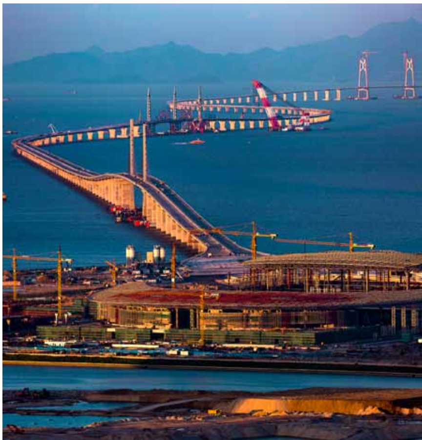
2016年6月2日,港珠澳大桥最后一座巨型“海豚”钢塔成功完成吊装。