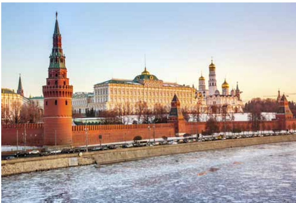
莫斯科克里姆林宫和大教堂。

第二,私法在国家政策中的优越地位有利于推动法典化进程。在计划经济时期,俄罗斯国家否认私法在国家法