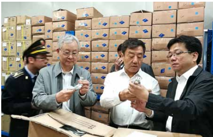
全国人大常委会产品质量法执法检查组对上海一家电器企业开展产品质量抽查。

记者:这次执法检查赴地方检查了8个省份,加上委托自查的8个省份和前期调研的6个省份,检查范围覆盖大半个中国,而且深入到生产经营单位、集贸市场、村镇商户。可以说,执法检查既有