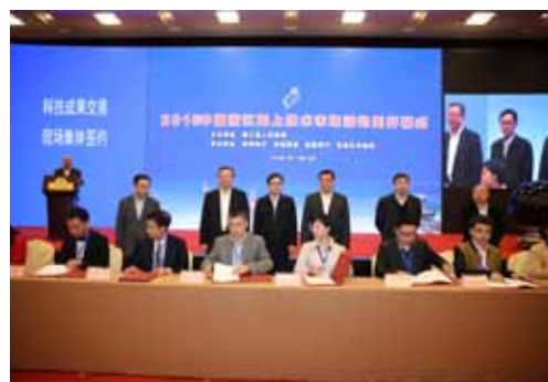
2015 中国浙江网上技术市场活动周开幕式

家“千人计划”442名，居全国第4位。修订通过《浙江省专利条例》，在全国第一个开展电子商务领域专利保护专项行动。2015年，浙江省专利申请量30.7万件，授权量23.5万件，分别增长17.53%和24.63%。发明专利授权量增长74.3%，达到2.33万件，万人发明专利拥有量达到12.89件。34项专利荣获第十七届中国专利奖，其中金奖2项，创历史最好成绩。