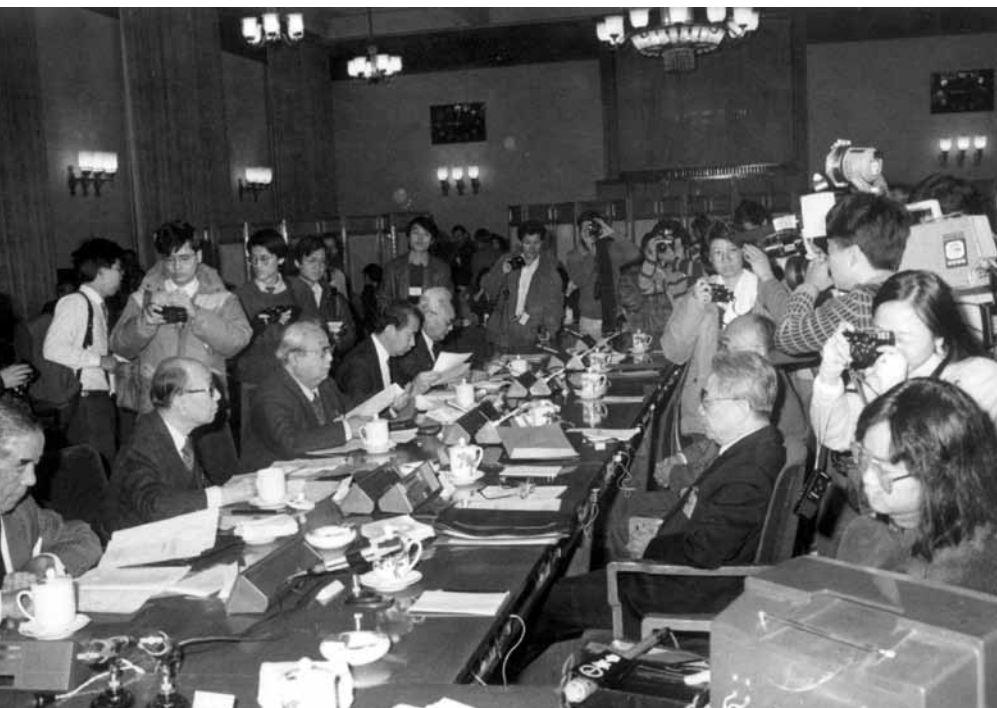
1986年11月29日,香港特别行政区基本法起草委员会第三次全体会议在北京人民大会堂举行。图为记者们在会前进行采访。

大以法律规定。1984年12月19日,中英政府正式签署《中英联合声明》,其中第3条明确规定:为了维护国家的统一与领土完整,并考虑到香港的历史和现实情况,中华人民共和国决定在对香港恢复行使主权时,根据中华人民共和国宪法第31条的规定,设立香港特别行政区。这样,在复杂的中英谈判中,宪法思维是贯穿始终的。通过宪法,将国家主权、国家意识融入即将创建的特区宪制秩序之中,维护了国家核心利益与民族尊严。