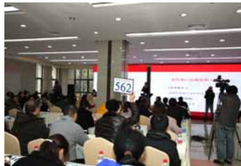
2015 年浙江省秋季科技成果竞价（拍卖）会