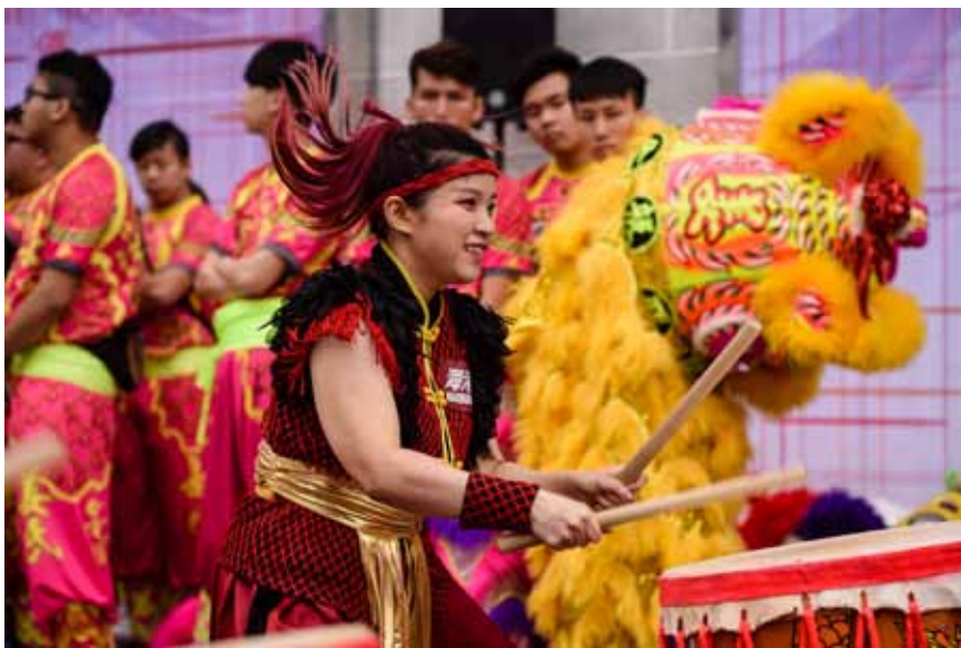
2017年1月31日,香港市民庆祝农历新年,舞狮舞龙表演亮相。

际情况出发,香港特别行政区实行以行政为主导的政治体制,不搞“三权分立”。在这一制度下,行政长官既是特区政府的首长、也是特别行政区的首长,既要特别行政区负责、也要对中央政府负责,具有“双首长、双负责”的法律地位。行政机关与立法机关之间既互相制衡又互相配合,司法机关依法独立行使审判权。这些都须正确理解、认真贯彻并切实维护。