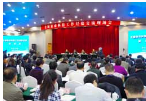
全国县市科技工作经验交流现场会