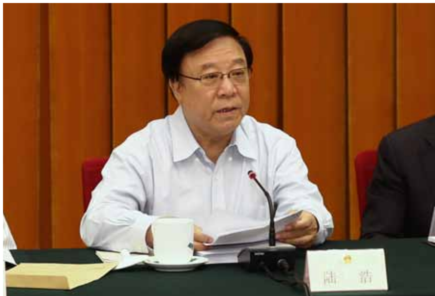
5月22日，全国人大环境与资源保护委员会主任委员陆浩在全国人大常委会固体废物污染环境防治法执法检查组第一次全体会议上讲话。

十二届全国人大常委会高度重视生态文明建设和环境保护工作，始终坚持问题导向，发扬钉钉子精神，持续深入开展监督，每年都对一部环境资源领域的法律进行执法检查。针对群众反映强烈的大气、水、土壤污染问题，已先后对可再生能源法、大气污染防治法、水污染防治法、环境保护法等法律的实施情况开展了监督检查。今年又对固体废物污染环境防治法（以下简称固废法）开展执法检查，张德江委员长和多位副委员长将参加这次执法检查，这是全国人大常委会坚决贯彻党中央决策部署、积极回应人民群众呼声、扎实推动生态文明建设的重要举措。近日，张德江委员长又在环境与资源保护工作简报上作出重要批示：“环资委认真学习贯彻习近