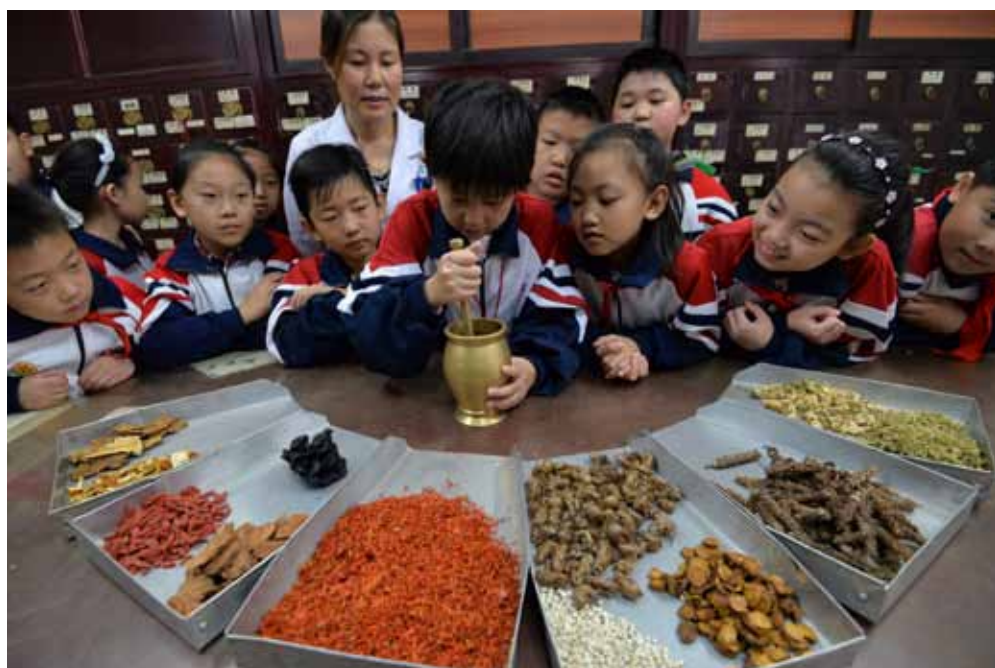
2016年10月20日,小学生们在河北省邯郸市中医院中药房学习捣药。

问题导向,深入了解法律实施情况,促进解决存在问题,以良法促进善治,保障人民群众用药安全。