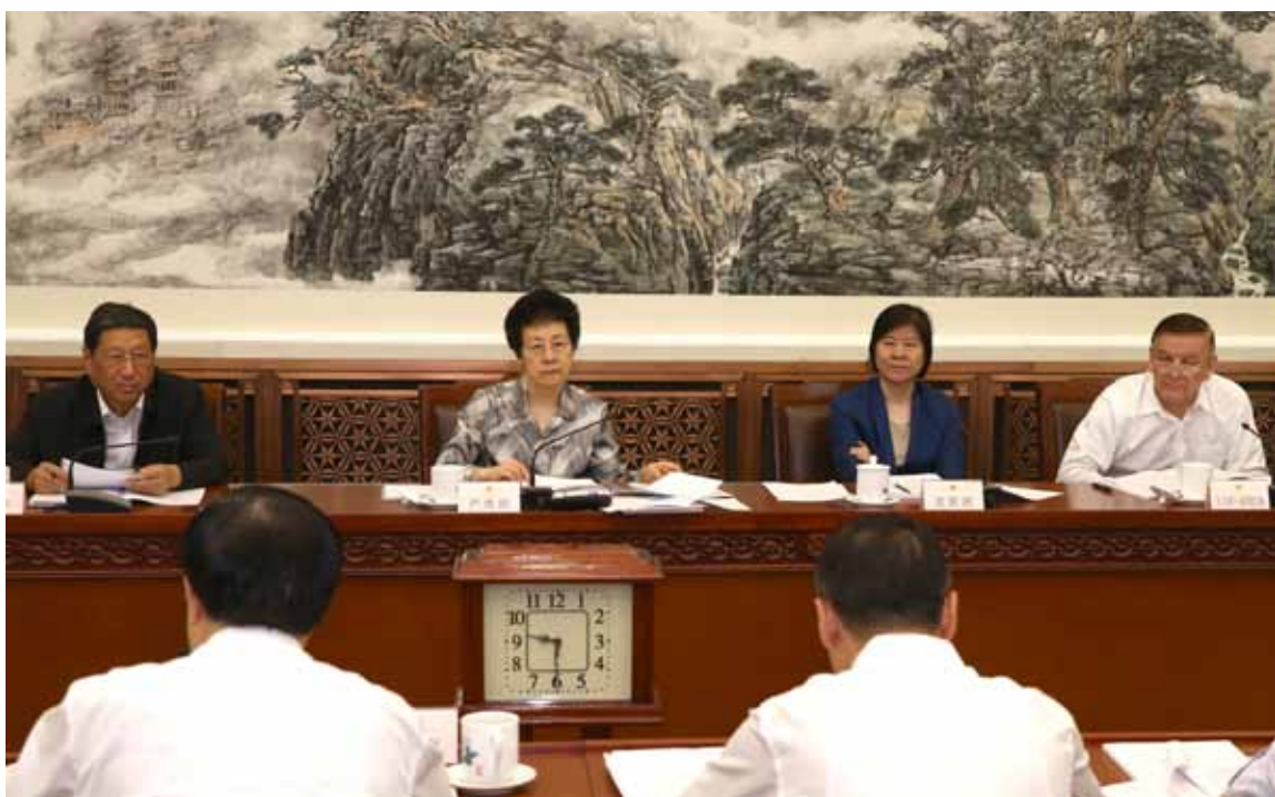
5月25日，全国人大常委会产品质量法执法检查组举行第二次全体会议，研究讨论执法检查报告（稿）。全国人大常委会副委员长严隽琪、沈跃跃、张平、艾力更·依明巴海出席。

当前，在全面深化改革和经济新常态之下，提升产品质量越来越重要。习近平总书记指出，供给侧结构性改革的主攻方向是提高供给质量，提升供给体系的中心任务是全面提高产品和服务质量。