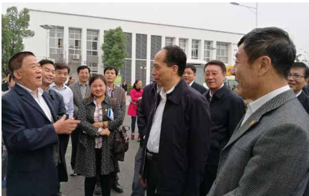
图为吉炳轩副委员长带队在安徽省合肥市长丰县陶西新村检查安全生产情况。

2015年8月12日,天津东疆保税港区瑞海国际物流有限公司危险品仓库发生火灾爆炸事故,最终造成165人遇难,8人失踪,798人受伤住院治疗,304栋建筑物、12428辆商品车、7533个集装箱受损,经济损失超过68亿元。