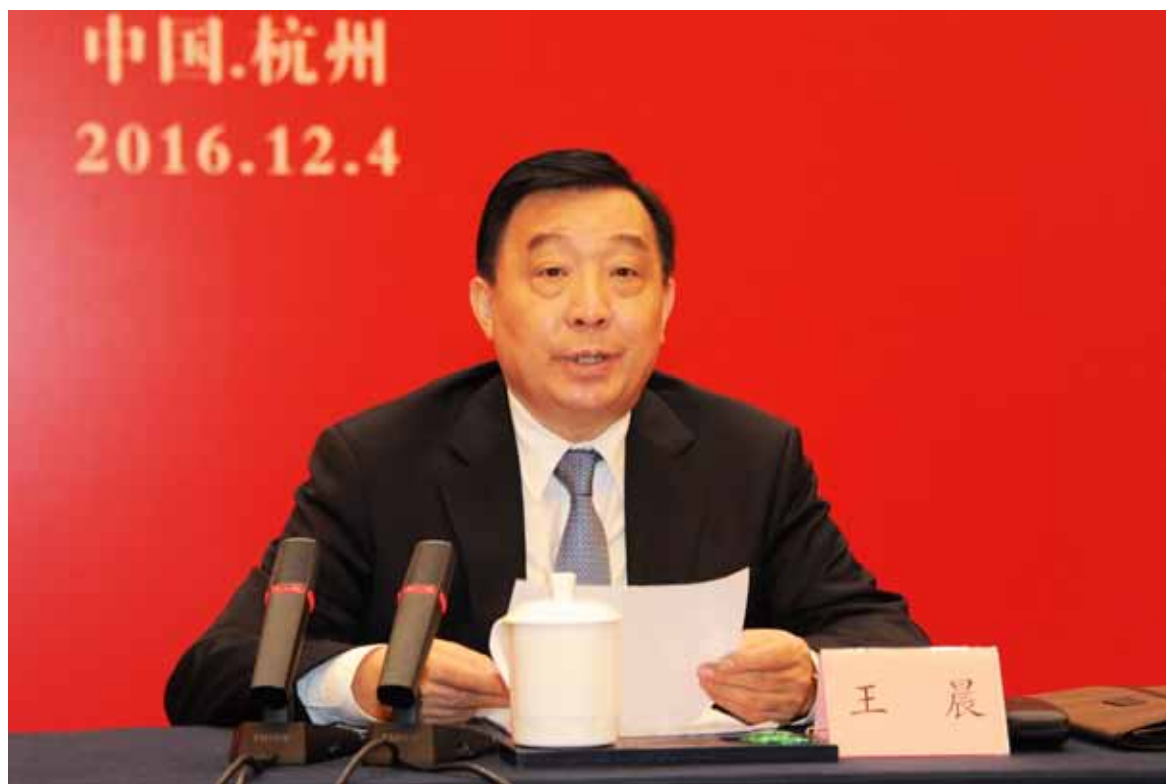
全国人大常委会副委员长兼秘书长王晨在 2016 年国家宪法日座谈会上讲话。