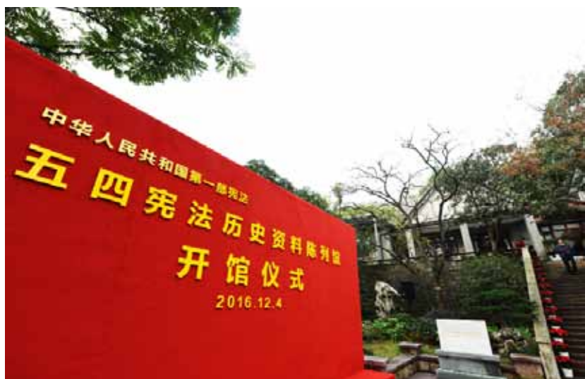
2016年12月4日,浙江省杭州市,参观者在“五四宪法”历史资料陈列馆里参观。