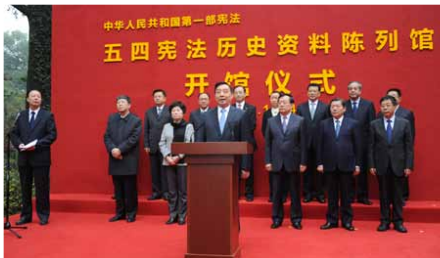
12月4日,全国人大常委会副委员长兼秘书长王晨在浙江杭州出席“五四宪法”历史资料陈列馆开馆仪式。图为王晨副委员长兼秘书长宣布开馆。

新华社杭州12月4日电 在第三个国家宪法日到来之际,中共中央总书记、国家主席、中央军委主席习近平作出重要指示强调,宪法是国家的根本