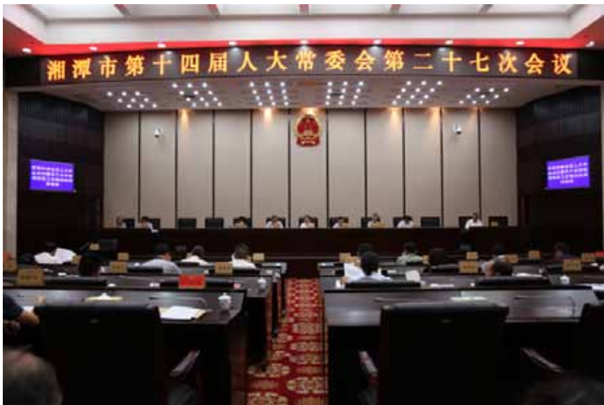
图为湘潭市第十四届人大常委会第二十七次会议会场。

“我向政府建议，一是扶贫资金一定要专款专用，并且要根据贫困户的不同情况，量化扶贫资金的份额；二是在扶贫政策的基础上，要重点改变农民的‘等靠要’思想，鼓励劳动致富。”