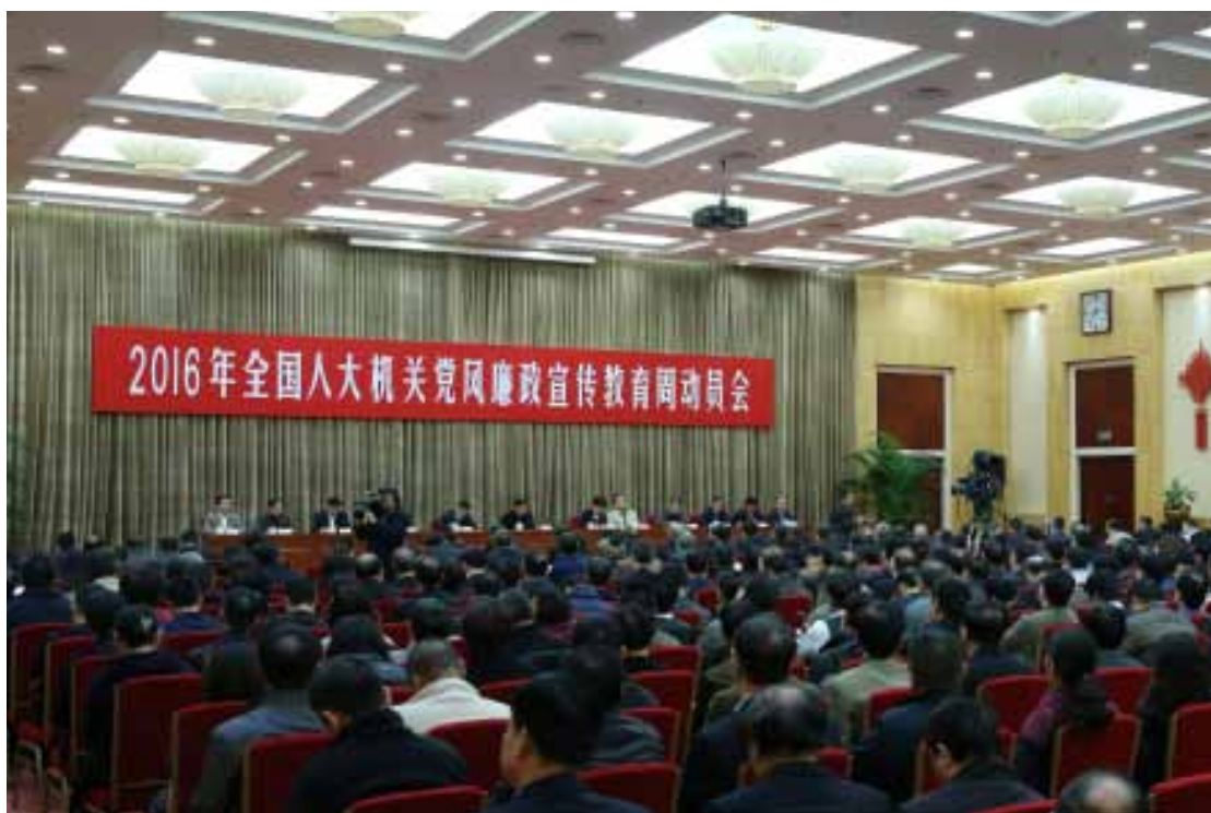
2016年11月28日,全国人大机关召开“2016年全国人大机关党风廉政宣传教育周动员会”,全国人大常委会副委员长兼秘书长、机关党组书记王晨同志出席会议并作动员讲话。

为深入学习贯彻党的十八届六中全会精神,坚定不移推进全面从严治党,根据机关党风廉政建设总体部署,按照常委会领导和机关党组的要求,全国人大机关于2016年11月28日至12月2日开展以“贯彻六中全会精神,推进全面从严治党”为主题的党风廉政宣传教育周活动。全国人大常委会副委员长兼秘书长、机关党组书记王晨对此次活动高度重视,出席会议并作动员讲话。