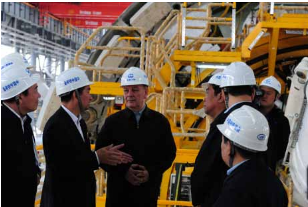
图为艾力更·依明巴海副委员长带队在河南省郑州市中国中铁工程装备集团有限公司检查安全生产情况。