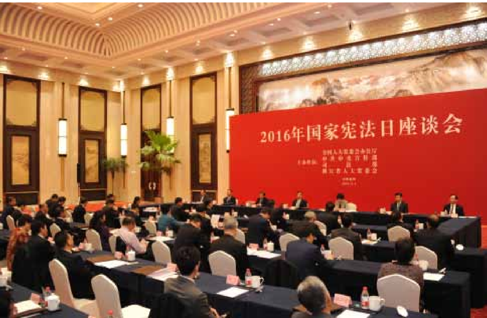
12月4日，全国人大常委会办公厅、中央宣传部、司法部、浙江省人大常委会在杭州共同举办2016年国家宪法日座谈会。

组织5次宪法宣誓仪式，20名由全国人大常委会决定任命的国家工作人员在就职时公开宣誓。国务院、最高人民法院、最高人民检察院以及各省、自治区、直辖市，也依法组织开展了宪法宣誓活动。宪法宣誓制度全面贯彻实施，有力地激励和教育了国家工作人员忠于宪法、遵守宪法、维护宪法。