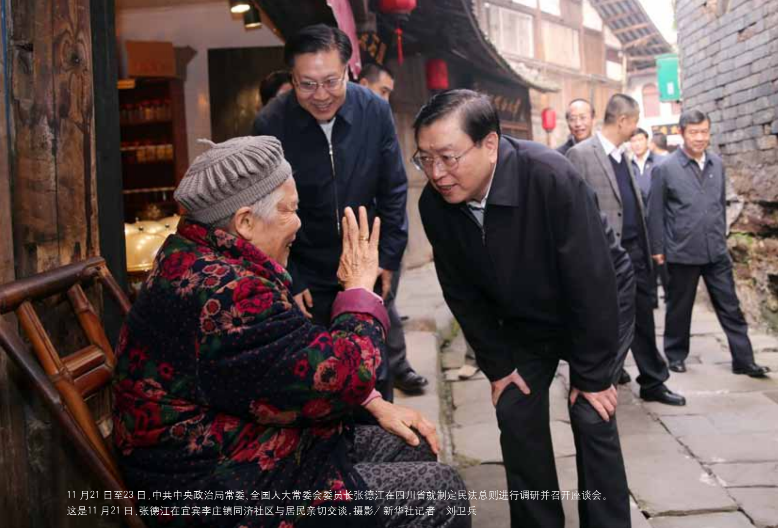
11月21日至23日,中共中央政治局常委、全国人大常委会委员长张德江在四川省就制定民法总则进行调研并召开座谈会。这是11月21日,张德江在宜宾李庄镇同济社区与居民亲切交谈。