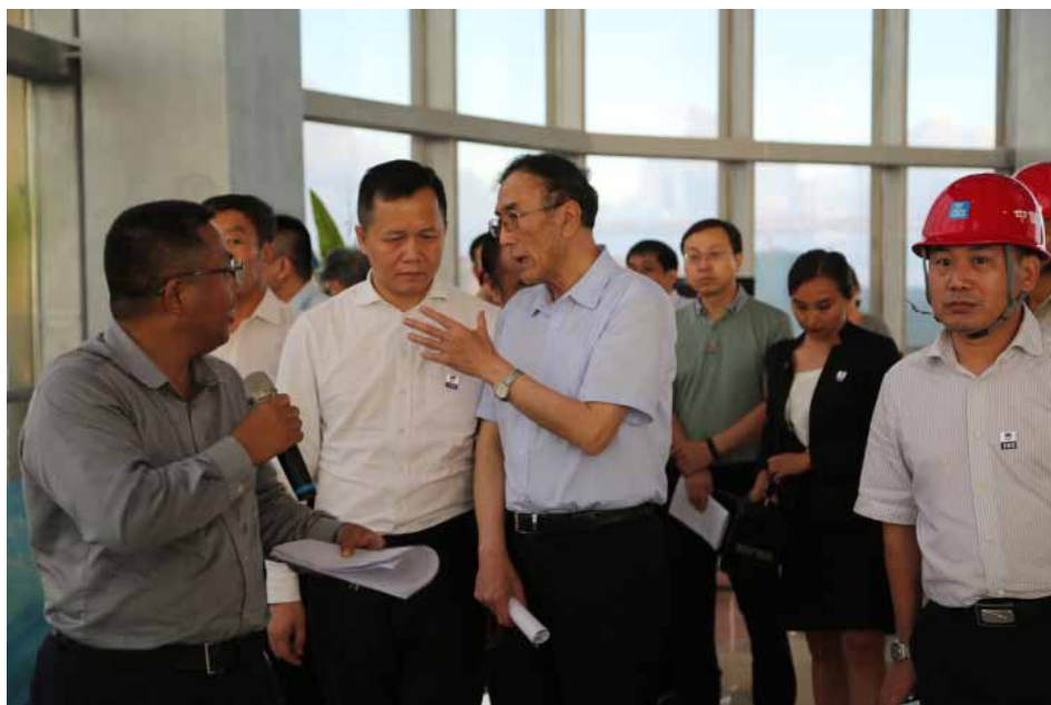
图为向巴平措副委员长带队在海南省儋州市海花岛项目现场检查安全生产情况。

在安全生产进入新阶段背景下,2016年全国人大常委会开展了安全生产法执法检查。此次执法检查是对两年前新修订的安全生产法贯彻实施情况的一次全面检查,也是对中国特色社会主义安全生产法律法规体系进行的一次系统梳理和科学评估。