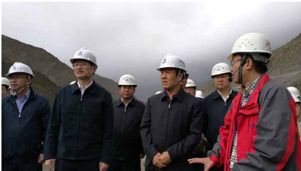
2016年9月24日，全国人大财政经济委员会副主任委员乌日图（前右二）在西藏自治区山南市雅砻水库工程现场查看安全生产法落实情况。