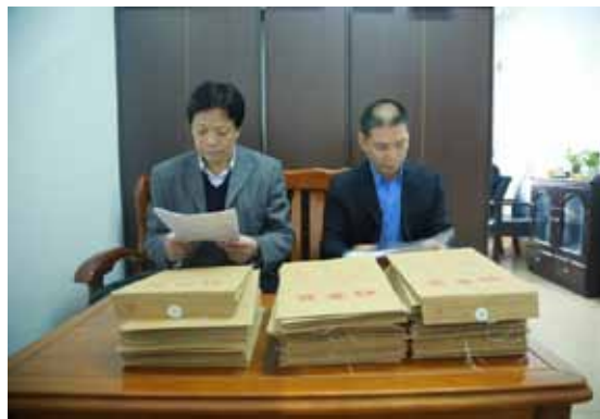
衡阳市人大内司委的工作人员正在查阅执法信息档案。

请市人大常委会任命一批“两员”。任命前，市人大内司委调取了拟任人员的执法信息档案，并抽查了部分案卷，发现少数拟任人员瞒报了敏感的执法信息，如被上级机关改判、发回重审的情况；还有个别案件存在证据采用不当、适用法律有误等问题。本着教育在先、惩前毖后的原则，衡阳市人大常委会副主任王旭明对他们进行了警示性谈话。