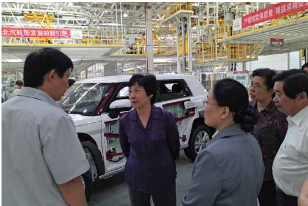
图为严隽琪副委员长带队在江苏省镇江市检查安全生产情况。

对安全生产法实施情况进行执法检查，这是2016年全国人大常委会的一项重要监督工作，也是对新修改的安全生产法（以下简称新安全生产法）首次开展执法检查。