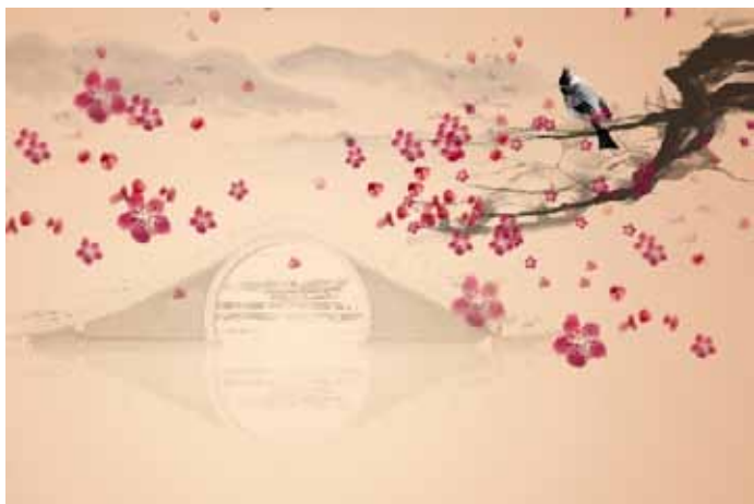
图 / 视觉中国

读书的美学意义,在于领略生活。俗话说:“惟大英雄能本色”。朱光潜认为,我们应该追求艺术的生活,其实就是一种本色的生活。世间有两种人的生活最不艺术,一种是俗人,一种是伪君子。如果一个人始终笃信这一套:娶妻是为了生子,养儿是为了防老,行善是为了福报,读书是为