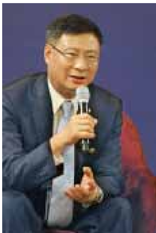
全国人大财政经济委员会委员李礼辉。

低风险”设计投资陷阱,通过假项目、假承租、假担保骗取、套取资金。“e租宝”不到两年吸引投资者90多万人,涉及全国31个省市,成交金额700多亿元。在“中晋系”融资诈骗案中,实际控制人在全国各地注册50多家子公司,控制100多家合伙企业,通过网上虚假宣传、线下推广圈钱的方式,涉嫌非法集资300多亿元。