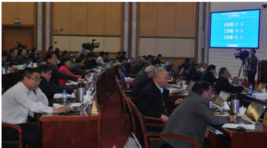
12月2日，湖南省十二届人大常委会第二十六次会议对省发展和改革委员会等18个单位2015年度省级预算执行和其他财政收支审计查出问题整改情况进行满意度测评。

2016年12月2日，湖南省十二届人大常委会第二十六次会议的一项议程特别引人注目：对省发展和改革委员会等18个单位审计整改报告进行满意度测评。此举在湖南省人大常委会历史上尚属首次。