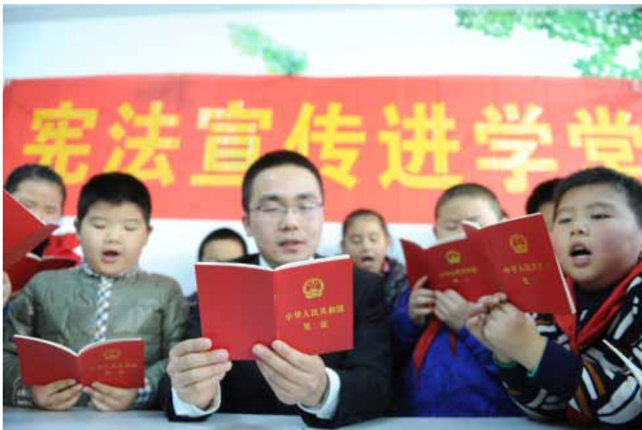
12月4日,安徽省合肥市包河区人民法院滨湖法庭法官走进社区儿童“四点半课堂”,向孩子们讲解宪法基本知识和宪法精神。

来,教育部连续三年组织开展了教育系统国家宪法日主题教育活动,在宪法晨读活动的基础上,不断创新形式、丰富内容。