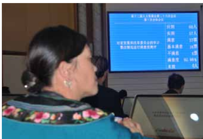
湖南省人大常委会对省发展和改革委员会进行满意度测评结果。

按照中央深改组的要求,经中共湖南省委同意,2016年8月,中共湖南省委办公厅转发了《中共湖南省人大常委会党组关于建立和完善审计查出问题整改情况向省人大常委会报告机制的意见》。该意见要求,省人大常委会听取和审议审计查出问题整改情况报告后,对被审计单位的整改情况按照单位进行满意度测评,对测评结果较差、问题整改不到位的单位进行跟踪监督,必