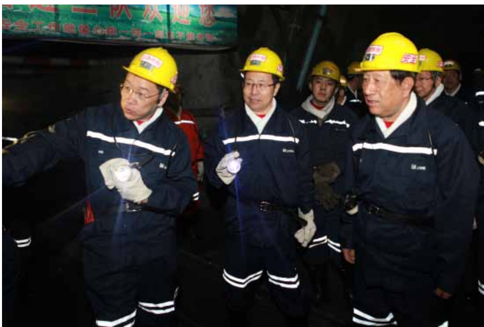
图为张平副委员长带队在山西省太原市官地矿井检查安全生产情况。

为此,新安全生产法强化了国务院和地方各级人民政府的安全生产监管职责,并规定,“乡、镇人民政府以及街道办事处、开发区管理机构等地方人民政府的派出机关应当按照职责,加强对本行政区域内生产经营单位安全生产状况的