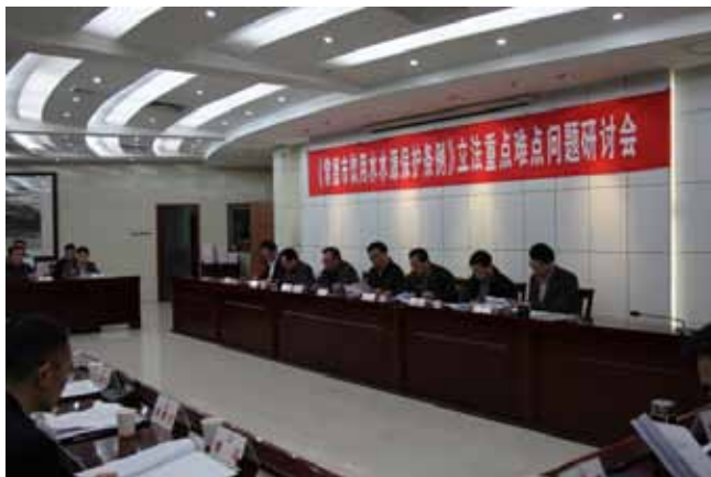
图为《常德市饮用水水源保护条例》立法重点难点问题研讨会会场。