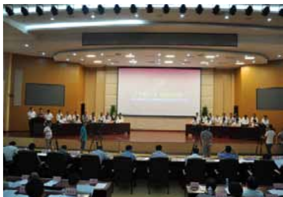
在“代表议、政府办”代表建议集中评办大会上，代表争相进行陈述。

株洲市2015年的代表建议涉及重点项目82个、民生实事162件。由于所提建议牵涉的范围广、内容多，只有调动各方力量联合办理才能推动建议有效解决。株