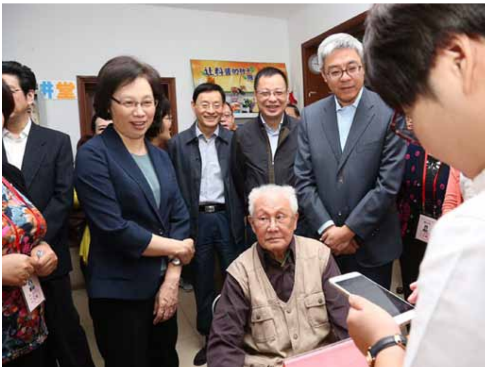
10月12日上午,上海市人大常委会主任殷一璀,上海市委常委、市委秘书长尹弘,上海市人大常委会副主任钟燕群等领导到徐汇区湖南街道第34选区视察选民登记工作。利用手机APP等信息化手段助力选民登记成为视察组关注的热点。

加快,中国人口流动愈渐频繁,人户分离、人企分离、企业注册地和生产经营地分离(简称“三分离”)现象日益突出。