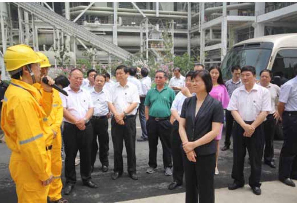
7月11日至15日，沈跃跃副委员长率执法检查组赴河南开展环境保护法执法检查。

负责人关于本系统贯彻实施环境保护法有关情况的汇报后，沈跃跃副委员长指出，“要认真贯彻落实张德江委员长重要批示精神，以高度负责的精神和求真务实的态度做好执法检查工作，切实增强执法检查工作实效，进一步推进环境保护法的全面贯彻实施。”