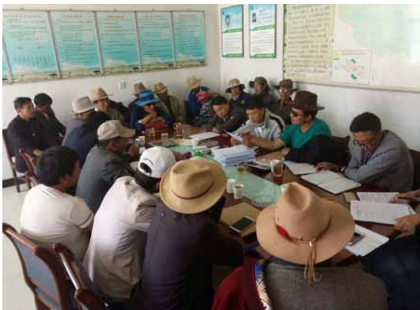
祁连县阿柔乡依法核实选民信息。

海晏县人大常委会副主任陈彪介绍,海晏县严格按照法定程序,认真开展选民登记。“我们加强了对各选区登记工作人员的培训,根据选区情况,对年满18周岁符合选举条件的群众进行拉网式登记、审查,共登记选民25185名,并在规定时间内公布选民情况,张贴了选民榜。选民