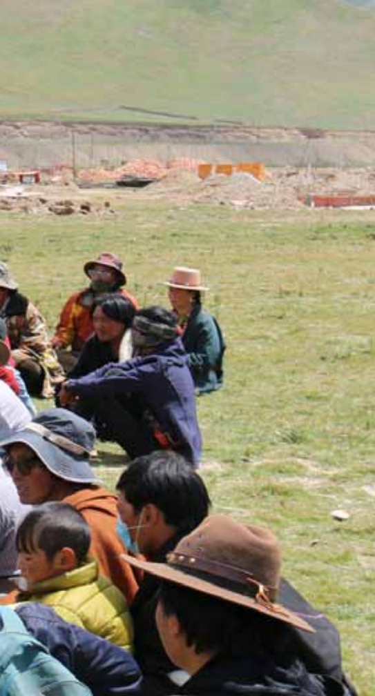
8月20日,甘德县柯曲镇德肉村选区的选民投票选举人大代表。

青海省县乡两级人大换届选举工作甫一启动,各地便精心准备,充分利用报刊、广播电视、横幅标语、电子屏幕等各类媒体,对换届选举的重大意义、指导思想及注意事项进行重点宣传,努力使换届选举方针政策家喻户晓,人人皆知。