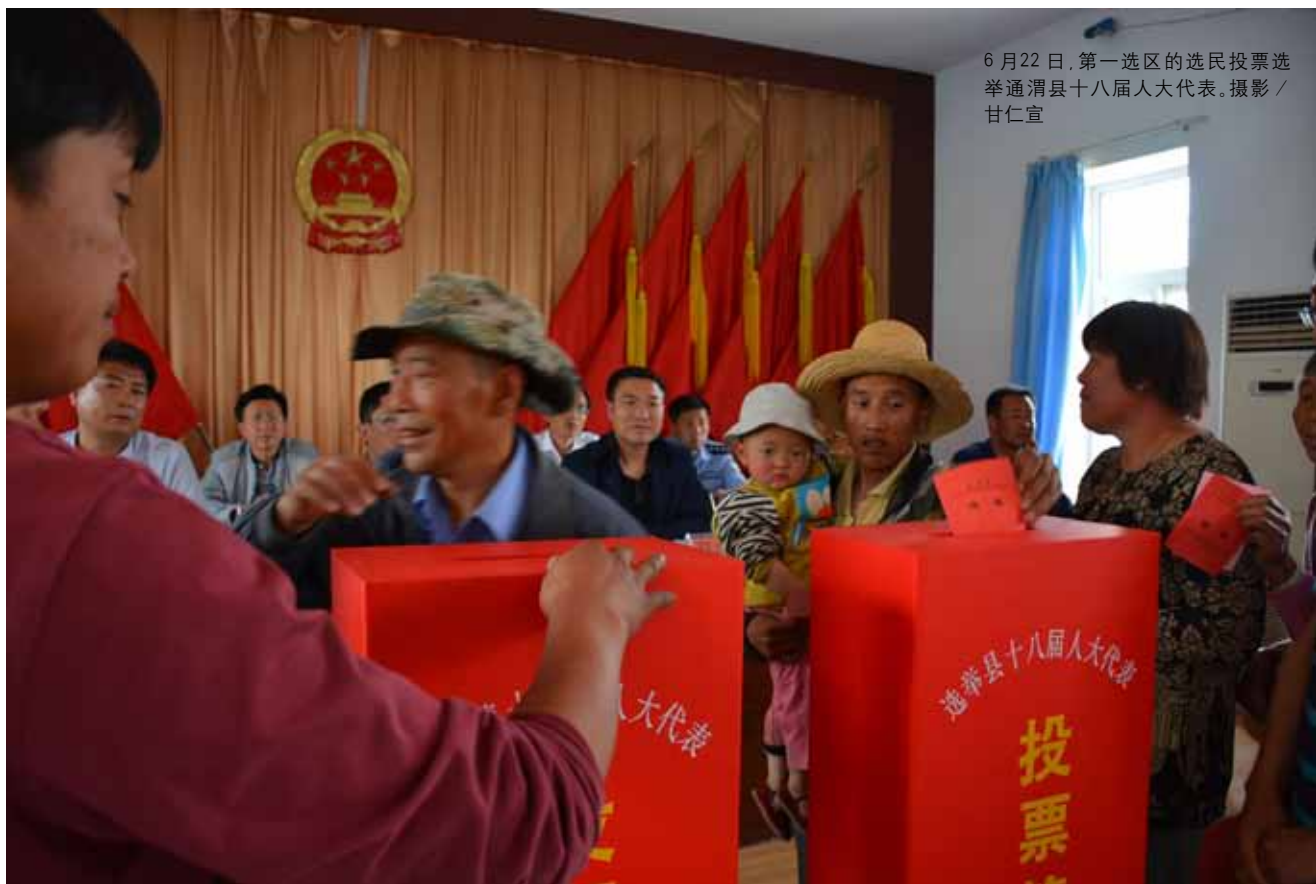
6月22日,第一选区的选民投票选举通渭县第十八届人大代表。