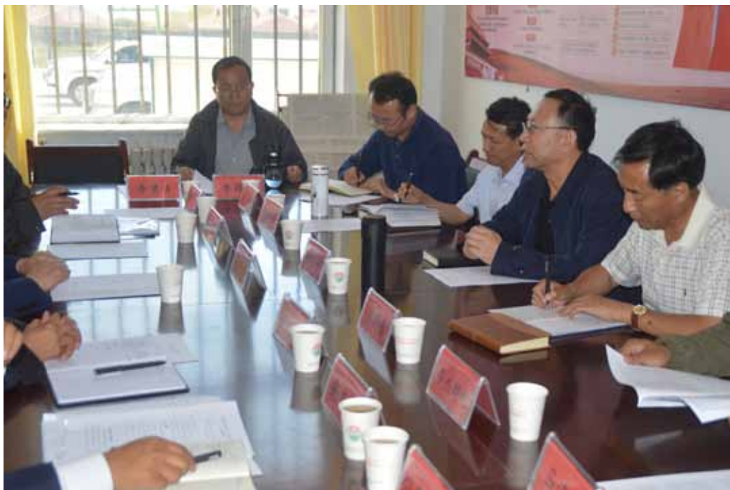
青海省人大常委会党组书记、副主任穆东升(右二)在海北州海晏县指导检查县乡两级人大换届选举工作时,与基层人大同志座谈。