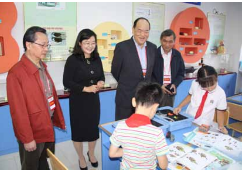
澳门全国人大代表视察延吉市中央小学。

族自治州人民的精神风貌和风土人情。9月9日,代表团来到延边视察。代表们刚刚抵达,就得知受“狮子山”台风影响,延边当地灾情严重。贺一诚、刘艺良、崔世平代表当即以代表团名义向当地慈善机构捐赠五十万元人民币,展现了人大代表为人民,人大代表心系人民的真挚情怀。