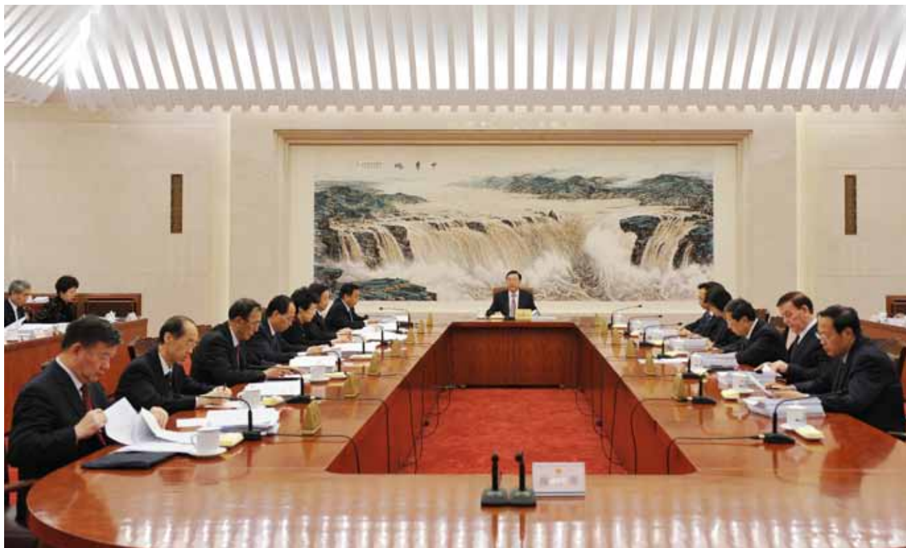
10月18日,十二届全国人大常委会第七十九次委员长会议在北京人民大会堂举行。张德江委员长主持会议。