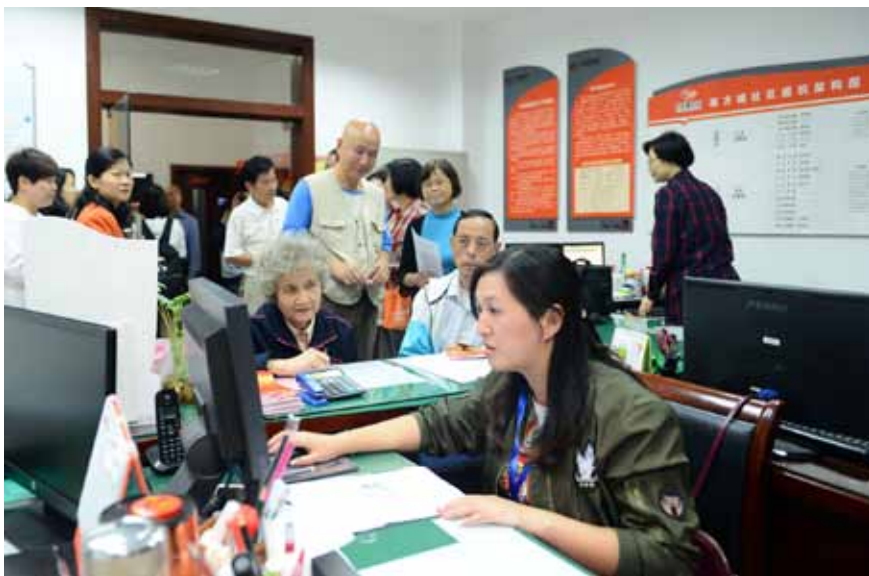
10月11日下午,在上海市闵行区的南方城社区,工作人员正在利用信息系统为居民进行选民登记。

对于广大选举工作者而言,优化升级后的系统还有一项特殊“福利”。以往对于各级选举工作机构来说,书写选民证和选举各类工作以及完成选举结束后的各类统计报表一直是一项繁琐的工作。升级后的信息管理系统通过增