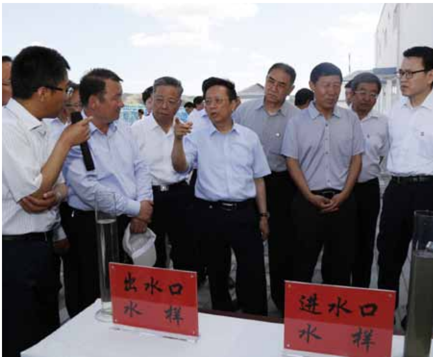
6月20日至23日，陈昌智副委员长率执法检查组赴宁夏开展环境保护法执法检查。

张德江委员长专门作出重要批示：“保护环境是基本国策。环境保护法是环境领域的基础性、综合性法律。环境保护法的修订和颁布实施，对于依法保护和改善环境，保障公众健康，推进生态文明建设，促进经济社会可持续发展具有重要意义。要通过执法检查，宣传好环境保护法，督促法律得到有效贯彻实施。要着力提高全社会的环境保护意识，推动各级政府、企业和公众依法落实环境保护责任，严格执法、公正司法、