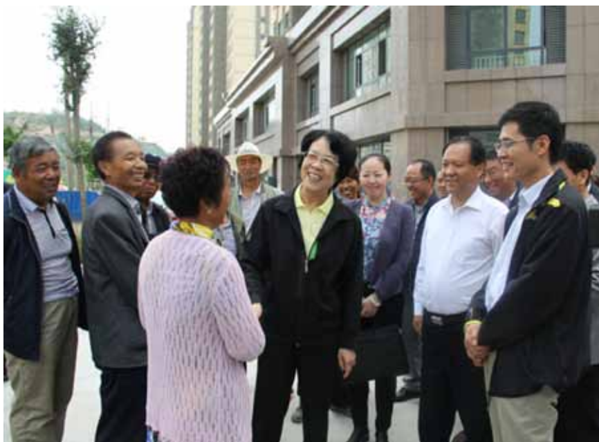
青海省人大常委会党组副书记、副主任苏宁(右三)在海东市乐都区安置小区前向选民群众了解情况。

“工作规范、程序严谨、纪律严明”是这次换届选举一个明显特征。”恒登向记者表示,循化撒拉族自治县县委、县人大高度重视换届选举工作纪律,严格遵守“九个严禁、九个一律”。在换届选举的各个阶段,所有党政班子成员、干部和工作人员都要多次观看警示教育片,让换届纪律入心入脑,自觉做到不越“雷池”、不碰红线,共同营造风清气正的换届环境和良好的政治生态。✘