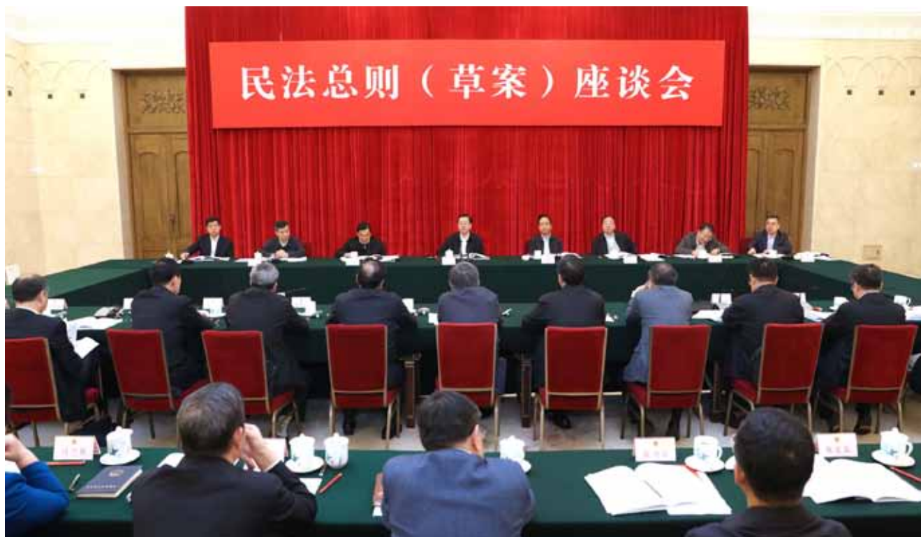
10月10日，张德江委员长在北京主持召开民法总则草案座谈会，就民法总则草案修改和民法典编纂听取有关方面意见。

中共中央政治局委员、全国人大常委会副委员长李建国，全国人大常委会副委员长兼秘书长王晨出席座谈会。✘