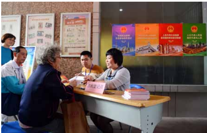
10月11日下午,在上海市闵行区的南方城社区,居民正在向工作人员咨询选举事宜。

除此之外,如前文说到的,“手机APP”的运用也成为今年上海市人大常委会创新选民登记方式的一大亮点。“与2011年POS机刷卡模式相比,手机