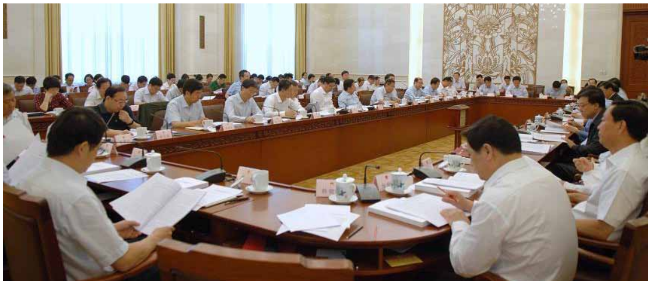
6月3日上午,全国人大常委会环境保护法执法检查组召开第一次全体会议,听取最高人民法院、最高人民检察院和国务院有关部门汇报环境保护法实施情况,部署执法检查工作。

源进行解析的基础上,在燃煤、重点企业排污、机动车尾气、城乡面源污染治理和特殊时段空气质量管控等五方面采取措施,确保到2018年全省环境空气质量总体改善。哈尔滨市持续开展冬季“治黑烟、保蓝天”攻坚战,全力推进大气污染防治“冬病夏治”工作。