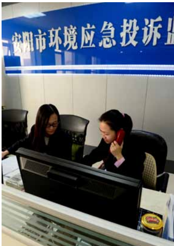
河南省安阳市成立大气污染防治蓝天工程指挥部,铁腕治污。图为4月13日,工作人员在安阳市环境应急投诉监测中心接听处理12369环保投诉热线。

理方式上不断创新,探索建立协作网络和统一的数据共享平台,将分散在多个部门的环境监测工作统筹协调起来,以此推动环保信息的公开透明。