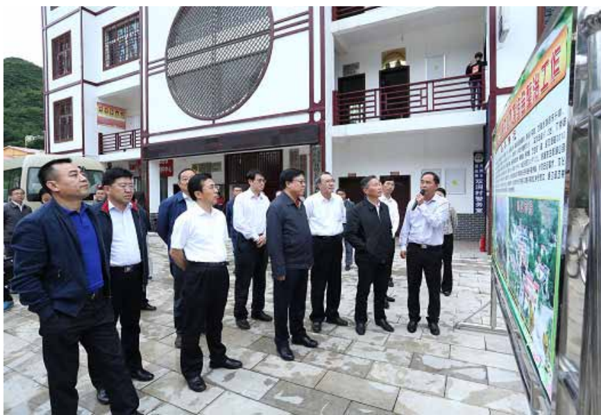
6月13日至17日，全国人大环资委主任委员陆浩（前排中）率执法检查组赴贵州开展环境保护法执法检查。

针对机动车尾气污染是许多城市雾霾形成的重要成因，质检总局加大车用汽柴油质量国家抽查力度，开展车用尿素水溶液产品质量监督抽查。针对以汽柴油为重点的油品、以发动机为重点