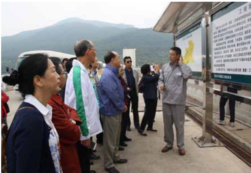
澳门全国人大代表视察吉林市丰满发电站。

9天时间里,代表团深入长春市、吉林市、长白山自然保护区、延边朝鲜族自治州等地,进企业、访基层、到口岸、观教学,听汇报、搞座谈、察民意。代表们一路走、一路看,一路思、一路议,亲身体验吉林山好、水好、地好、空气好生态优势的同时,感受到了当地多彩的民俗、淳朴的民风、丰厚的历史文化及吉林人民为实现老工业基地振兴积极作为的精神风貌。