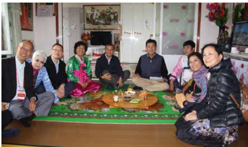
澳门全国人大代表视察延边州和龙市金达莱村,与村民座谈。

生态美是吉林最大特色、最宝贵的财富、最重要的品牌,也是最大的发展潜力。近年来,吉林通过强化生态文明建设,东部实施生态系统修复工程,中