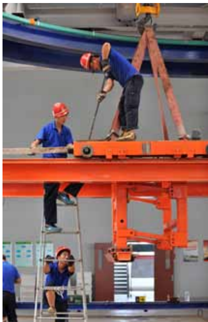
天津市开发建设规模最大的保障房项目,采用的是预制装配式技术,有效地减少了建筑能耗,更加绿色和环保。

一方面宣传教育,一方面严惩违法,收效明显。由中国政法大学牵头开展的环保法实施情况第三方评估结果显示,企业守法意识和自律意识有所增强,履行主体责任整体趋好,对主要污染物排放达标和总量减排起到积极的推动作用,促进了环境污染治理和经济转型。