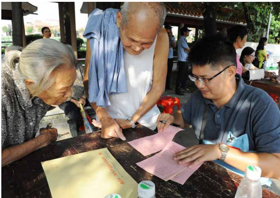
高龄选民在工作人员指导下填写选票。

目前，广东县乡两级人大换届选举工作正依法有序开展，按照规定，截至今年12月换届选举工作将全部完成。✘