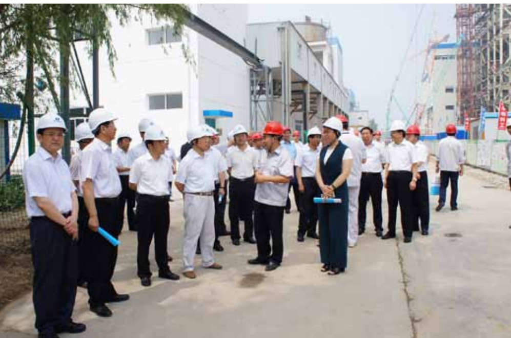
7月6日,全国人大环资委副主任委员王云龙(前排左四)率环境保护法执法检查组山西小组,在山西忻州广宇煤电有限公司检查电厂脱硫除尘和水处理情况。