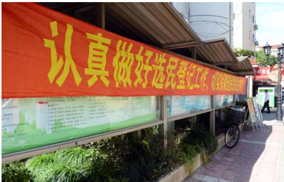
上海居民社区随处可见的选举标语和宣传栏。

10月12日一大早,这里聚集了许多主动前来登记的选民。“我们年纪大了,到社区登记不方便呀。现在,选民登记点就设到家门口,很方便。”七十多岁的王奶奶满脸笑容,她告诉记者,这次选举宣传力度很大,工作人员及时上门听取了她的意愿,告