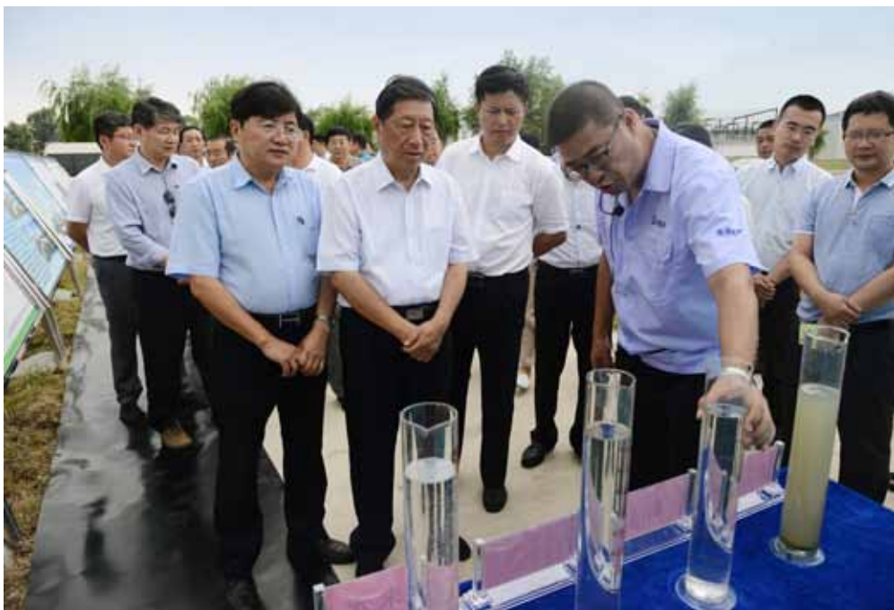
7月19日至23日，张平副委员长率执法检查组赴黑龙江开展环境保护法执法检查。

检查组对宁夏切实加大环保执法力度的举措印象深刻。宁夏在环境保护厅组建了环境保护监察执法局，提升了机构规格，强化了执法权威。石嘴山市、中卫市在相关工业园区增设了3个执法分局，固原市在隆德县单设了环保机构，自治区公安厅和银川市公安局成立了环保公安机构，有效加强了执法力量。宁夏连续把2015年、2016年确定为“环境保护执法年”，在全区范围深入开展环境保护大检查，共排查企业5678家，发现环境问题2654个，监督整改1962个，立案处罚369件，其中，按日连续计罚4件，查封、扣押10件，限产停产65件，移送行政拘留13件，移送涉嫌环境污染犯罪13件，累计罚款2645万元。宁夏回族自治区政府还严肃追问责，对环保工作履职不力的4个县级政府、1个工业园区主要负责人进行约谈，对3个县级政府进行挂牌督办。对中卫腾格里沙漠污染事件中负有直接领导责任的中卫市委、市政府，责令作出深刻检查；对监管不力、失职渎职的19名公职人员，给予免职、撤职等处分，2人移交