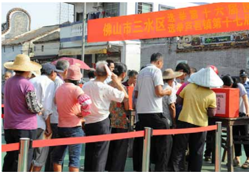
佛山市三水区选民排队投票选举人大代表。

“积极行使民主权利,投下神圣而庄严的一票”“珍惜民主权利,踊跃参加,别让民主从你手中溜走”,红色的横幅标语悬挂在篮球场上方。篮球场上,八个红色的票箱一字排开,上面清晰地写明独树岗行政村长岐自然村一到八队,方便已经登记的1036名选民按各自的登记选区领票、投票。今天的选举,将通过民主投票的方式从3名正式候选人中选出2名区人大代表,从4名正