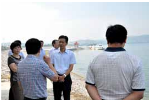
人大代表视察澧水水质整治情况。

今年3月11日，松滋史上最大的民生工程——“引澧济城”工程正式通水试运行，工程沿途8个乡镇和中心城区近40万人饮上了从澧水水库直接导出的“放心水”。10月下旬，第三届中国汽车露营大会还将在这里举办。“这既是一次集‘会、展、玩、游’为一体宣传澧水水库的嘉年华，更是对这几年湖北松滋、湖南澧县两地跨区域联手监督澧水流域水环境治理成效的肯定。”松滋市人大常委会主任赵茂安满怀欣慰。