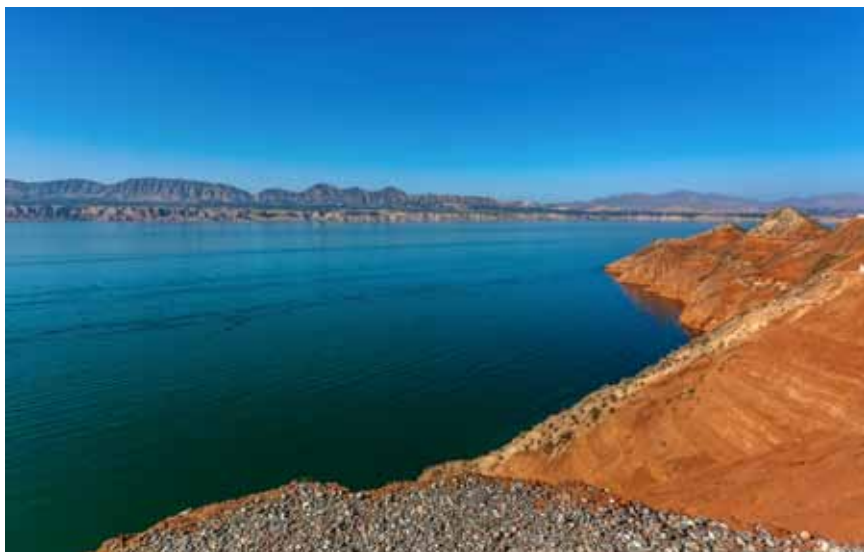
刘家峡水库位于黄河上游,甘肃临夏永靖县城西南1公里处,距兰州市75公里,是第一个五年计划期间,中国自己设计、自己施工、自己建造的大型水电工程,竣工于1974年。

长期以来,农田水利投入明显不足,难以适应现代农业发展的需要。国家水利建设投入中农田水利建设资金总量偏少。“十二五”期间,农田水利建设投资额有4264亿元,对一个农业大国的农业发展是不够的。有限的财政资金投入渠道还很分散,政策也不统一,农田水利规划的统筹作用很难发挥。部分地区土地出让收益计提的农田水利建设资金并未用于农田水利建设。农民群众投工投劳参与农田水利建设的积极性不高,通过“一事一议”的方式组织农民参与农田水利建设越来越困难。农田水利建设市场化运作的投融资机制尚未建立,社会资本投资的比例很低。农田水利设施产权主体还不明晰,有许多带有公益性质,赢