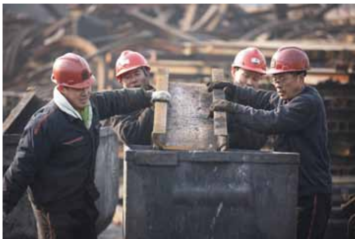
2015年12月21日，安徽省淮北市的煤矿工人在工作。

者部分地方政府安全生产监管责任不落实，使企业与政府、作业人员与管理者的安全生产职责界限不清，从而产生了企业安全生产主体责任与政府安全生产监管责任相互转嫁的问题。各级人民政府及其部门开展的一次又一次安全生产检查，查出了大量的生产安全事故隐患，查处了大量的安全生产违法违法行为，确保了安全生产形势的持续稳定好转，提升了安全生产管理水平。但是，也出现了部分企业等着政府及其部门安全生产检查、等着政府及其部门的检查者承担安全生产责任的现象。这样所导致的后果是，本来企业是安全生产责任主体，应承担安全生产主体责任，但一些本应企业承担的安全生产责任被政府或者部门承担了。另一种情况是，政府及其部门通过下发大量的安全生产文件，通过一次又一次的安全生产检查、五花八门的会议、门类繁多的培训，给企业施加不应有的安全生产压力，要求企业承担安全生产法律法规规定以外的安全生产责任，以致给企业正常生产造成影响。这种企业安全生产主体责任与政府安全生产监管责任相互转嫁的问题，既不利于安全生产法律法规的贯彻执行，也不利于安全生产管理水平的提高。