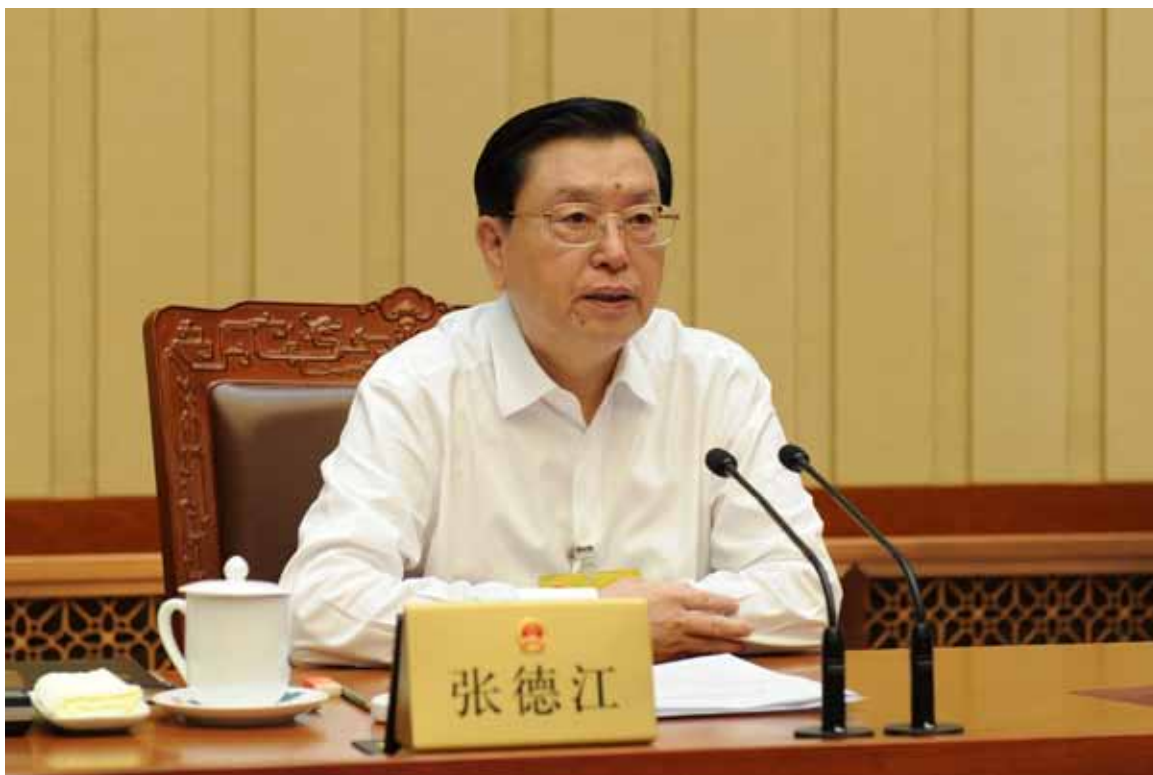
9月3日上午，十二届全国人大常委会第二十二次会议举行闭幕会，张德江委员长主持会议并讲话。