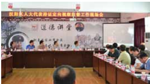
持证视察询问会上播放暗访视频。