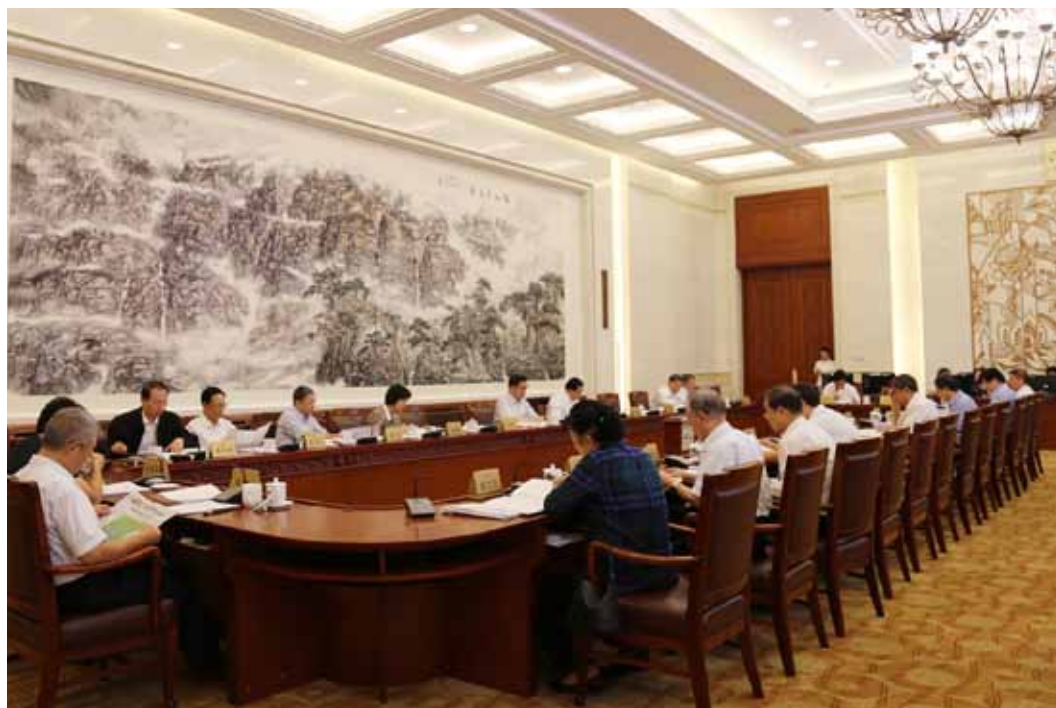
9月1日上午，十二届全国人大常委会第二十二次会议举行分组会，审议国务院关于今年以来预算执行情况的报告。图为分组会会场。

对财政预算进行监督，是人大监督工作的重要内容。今年时间已过大半，我国的财政预算收支情况怎样？收入多少？支出多少？8月底至9月初举行的十二届全国人大常委会第二十二次会议，其重要议程之一就是听取和审议今年以来预算执行情况的报告。