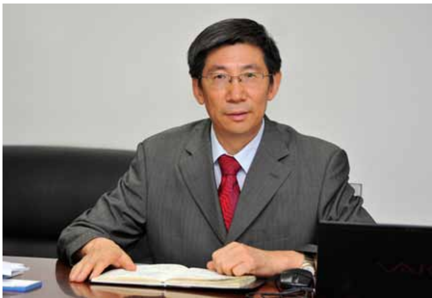
全国人大常委会委员、全国人大环境与资源保护委员会委员张兴凯。

2005年,全国人大对安全生产法进行了建国以来的首次执法检查。这次执法检查,以广大人民群众和人大代表普遍关心的焦点问题——煤矿安全问题为重点,推动了煤矿安全的法治化进程,提出了修订安全生产法的要求。2014年,全国人大常委会完成了安全生产法的修订工作。2014年8月31日,十二届全国人大常委会第十次会议审议通过关于修改《中华人民共和国安全生产法》的决定,安全生产法自2014年12月1日起施行。