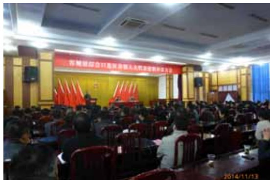
容城镇综合口选区县镇人大代表述职评议大会。

县住建局负责人作为被约见的领衔负责人，对代表关心的问题了解说明，并代表各被约见单位公开承诺：“县住建部门牵头实施移民新村主要道路的综合改造，范围涉及新村二路、平桥七路、新村五路及老台二路等4条道路，概算投资415万元，力争2013年下半年动工建设，年内完工，彻底解