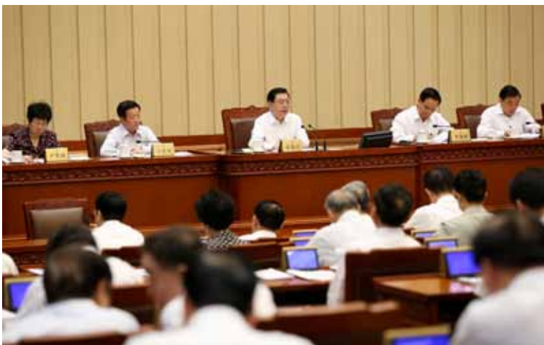
9月3日，十二届全国人大常委会第二十二次会议在北京闭幕，全国人大常委会委员长张德江主持会议。