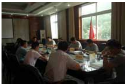
人大代表正在进行分组评议。

“服务群众，我们会做到紧急事情迅速办、当天事情及时办、分内事情协助办、疑难事情尽力办、一切事情依法办。”