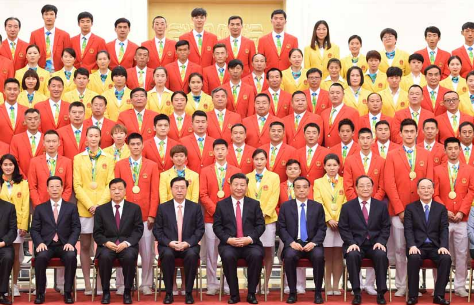
8月25日,党和国家领导人习近平、李克强、张德江、俞正声、刘云山、王岐山、张高丽等在北京人民大会堂会见第31届奥林匹克运动会中国体育代表团全体成员。