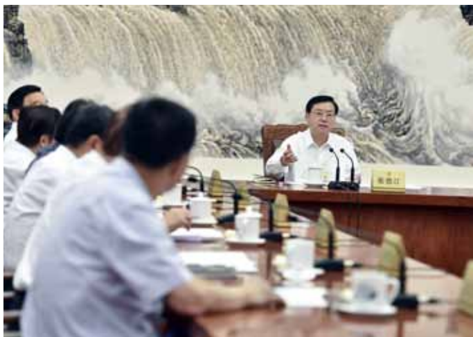
9月1日，十二届全国人大常委会第七十五次委员长会议在北京人民大会堂举行，张德江委员长主持会议。