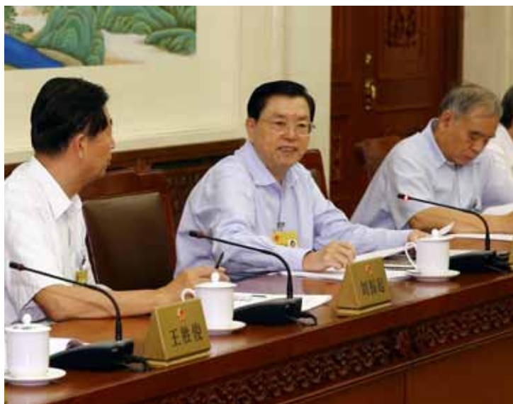
8月30日，十二届全国人大常委会第二十二次会议在北京举行分组会议，审议外资企业法等4部法律的修正案草案、电影产业促进法草案。张德江委员长参加审议。