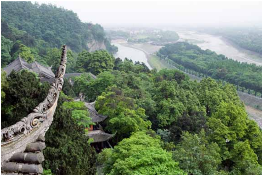
四川都江堰。

兴水利，除水害，历来是治国安邦的大事。几十年来，新中国开展的气壮山河的水利建设，取得了前所未有的巨大成就。在全面推进依法治国的新形势下，国家对水利建设愈发重视，严格遵循水法等一系列法律法规管水治水。