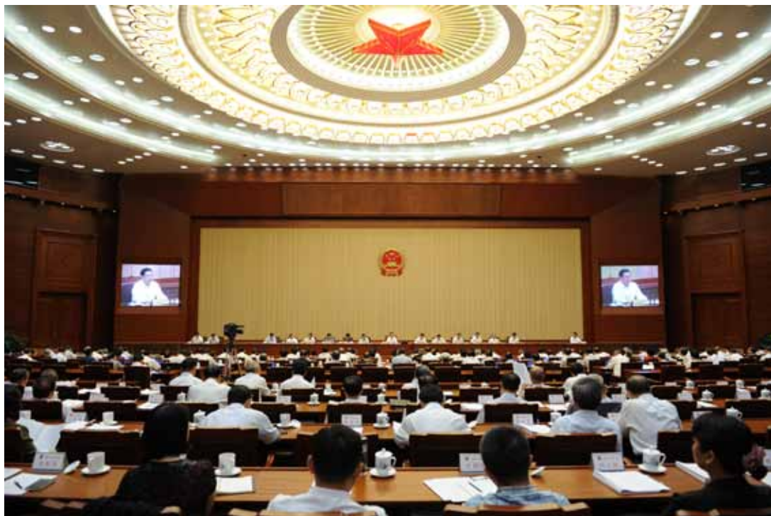
9月3日上午，十二届全国人大常委会第二十二次会议举行闭幕会。

强、活力不够等问题比较突出，人才培养质量不够高，科研创新能力、服务支撑经济社会发展的能力有待加强，高等教育总体水平与国家发展需要和人民群众期盼相比仍存在较大差距。国务院及其有关部门和地方政府要切实遵循教育规律，优化高等教育结构布局，深化高等教育领域改革，加强高等教育条件保障，引导公办民办各类高校办出特色、分类发展，统筹推进世界一流大学和一流学科建设，提升高等教育对外开放水平和国际竞争力，实现我国从高等教育大国到高等教育强国的历史性跨越。