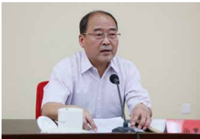
全国人大法律委员会委员张伯里。

一定的发展实践都是由一定的发展理念来引领的。创新、协调、绿色、开放、共享的发展理念，是管全局、管根本、管长远的导向，具有战略性、纲领性、引领性。这个“引领”、这个“导向”，概言之即“领导”。可以说，这一新发展理念是领导发展的理念，或领导理念。从领导发展的主体——“领导者”来看，一是党，二是领导干部，必须注重发挥党的领导核心作用和领导干部的骨干引领作用。