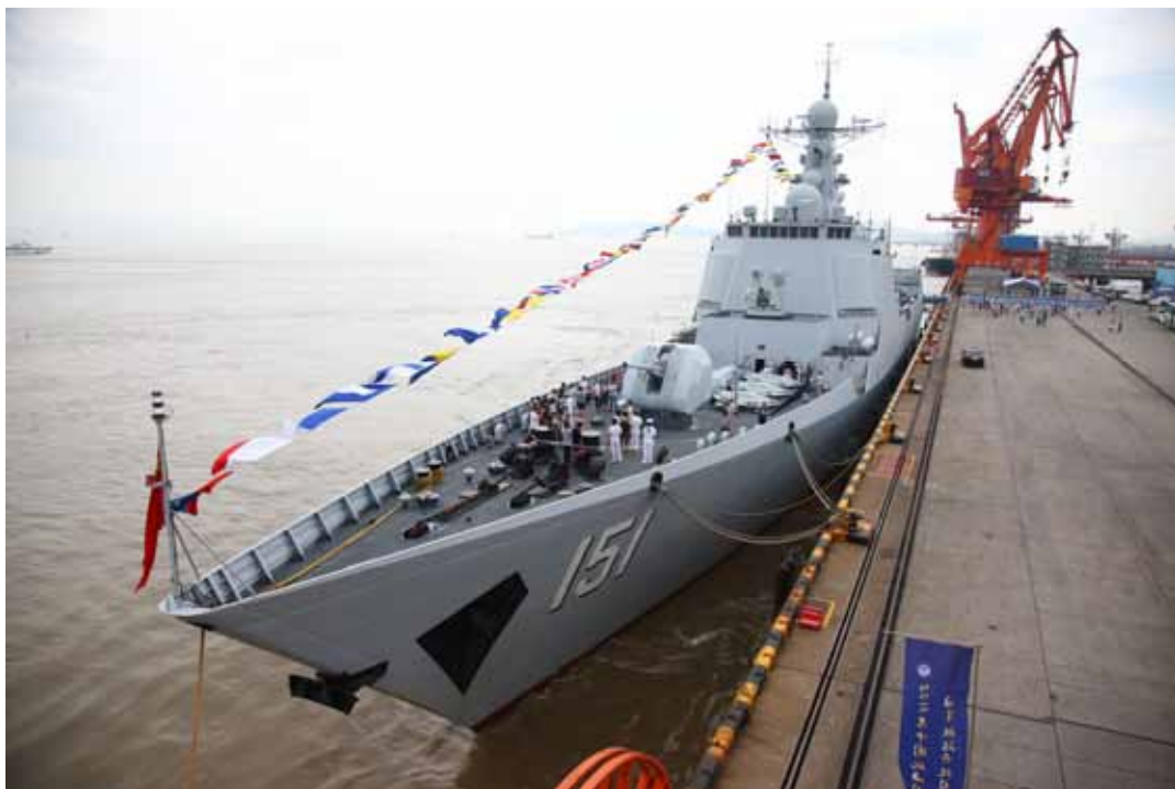
7月12日，作为2016年中国航海日重要活动之一，海军舰船开放日活动在浙江宁波北仑港区举行，上千名市民参观了海军军舰“郑州舰”，切身感受了我国国防事业的发展。

9月3日上午，十二届全国人大常委会第二十二次会议举行了闭幕会。会议全票通过了国防交通法。