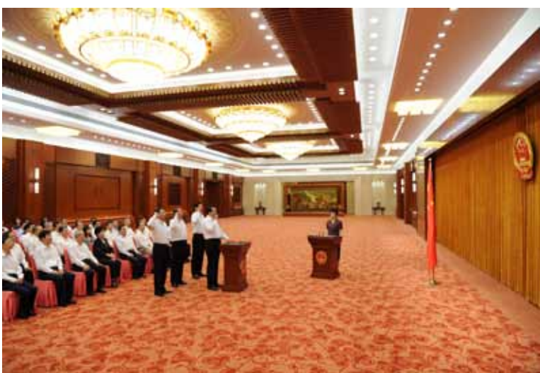
9月3日,十二届全国人大常委会在北京人民大会堂举行宪法宣誓仪式。全国人大常委会副委员长严隽琪主持并监誓。

刚刚闭幕的十二届全国人大常委会第二十二次会议任命了3名全国人大有关专门委员会副主任委员,决定任命了交通运输部部长。根据全国人大常委会关于实行宪法宣誓制度的决定和全国人大常委会委员长会议关于宪法宣誓的组织办法的规定,上述人员依法进行宪法宣誓。