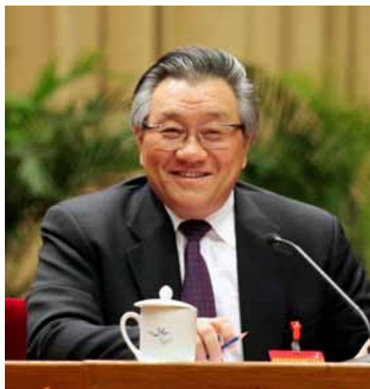
全国人大常委会委员、全国人大财政经济委员会主任委员李盛霖。

三是重视培育经济发展新动能,着力加快新旧发展动力转换。 目前各地经济发展呈现分化态势,其中新旧发展动力转换是个关键。从我们前一阶段去各地调研的情况看,转换得好的地方经济下行压力就小,转换不好的地方下行压力就大。前7个月,高技术产业和装备制造业增加值分别增长10.5%和8.5%,均高于整个工业6%的增长,占工业比重分别为12.1%和32.5%,同比提高0.7个和1.2个百分点。趋势很好,但占比仍然较低。建议当前要十分重视以新发展理念为指导,发挥创新的引领和带动作用,加快培育和发展战略性新兴产业,巩固我国在高技术制造业和装备制造业方面的优势,大力发展现代服务业。同时要用好用足政策红利,最大限