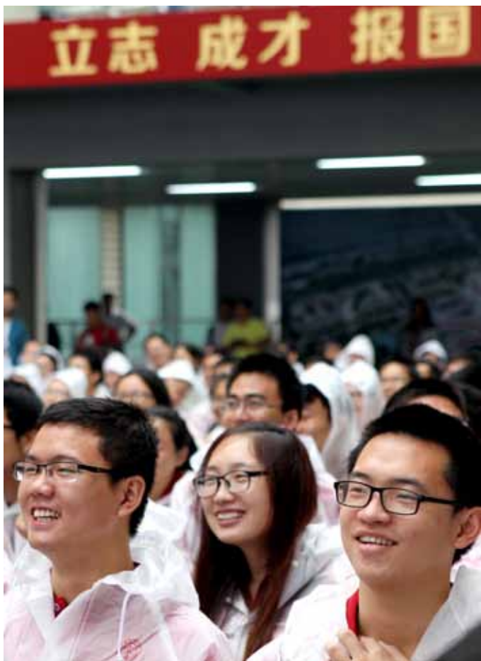
2014年9月30日,上海科技大学首届本科生暨2014级研究生开学典礼举行。来自9个省市的207名本科生正式入学,这意味着又一片高等教育改革的“试验田”全面开始播种。

庭的切身利益,年年谈、日日谈,许多问题变成老生常谈,对“老大难”问题,委员们希望能看到更为翔实、具体、有可操作性的改革方案。