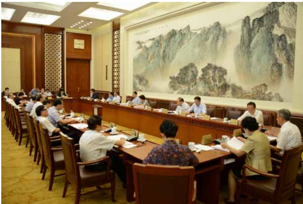
9月1日上午,十二届全国人大常委会第二十二次会议举行分组会,审议国务院关于今年以来国民经济和社会发展规划执行情况的报告。图为分组会会场。

常委会组成人员认为,今年以来,面对错综复杂的国内外环境,各地各部门认真贯彻落实党中央、国务院的一系列重大决策部署,有效应对风险挑战,攻坚克难,国内生产总值、财政收入稳定增长,产业转型升级的步伐加快,供给侧结构性改革的五项重点任务扎实推进,经济发展新的动能加快成长,环境治理、生态建设的成效明显,城乡居民收入、民生保障的水平也在不断提高等,这些成绩的