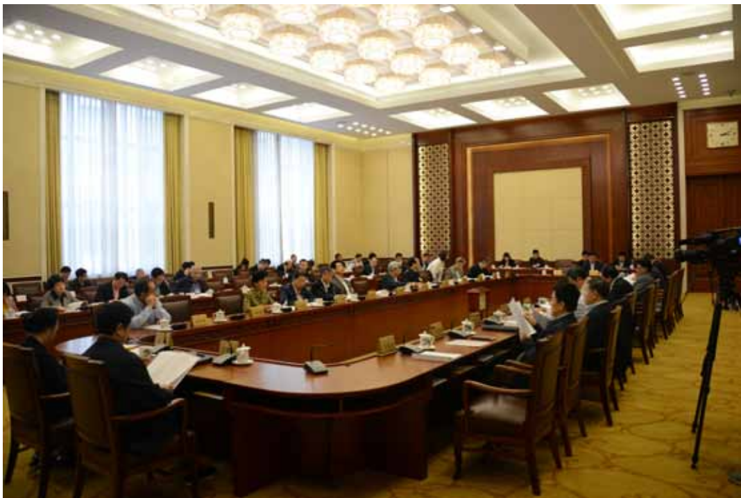
4月27日下午，十二届全国人大常委会第二十次会议分组审议公共文化服务保障法草案。

五中全会精神，以邓小平理论、“三个代表”重要思想、科学发展观为指导，深入学习贯彻习近平总书记系列重要讲话精神，按照“五位一体”总体布局和“四个全面”战略布局，牢固树立和贯彻落实创新、协调、绿色、开放、共享的新发展理念，坚持党的领导、人民当家作主、依法治国有机统一，发挥立法的引领和推动作用，加快重点领域立法，注重各方面法律制度的协调发展，深入推进科学立法、民主立法，遵循和把握立法规律，着力提高立法质量，加快形成完备的法律规范体系，以良法促进发展、保证善治，为实现“十三五”时期经济社会发展良好开局、夺取全面建成小康社会决胜阶段的伟大胜利作出新贡献。