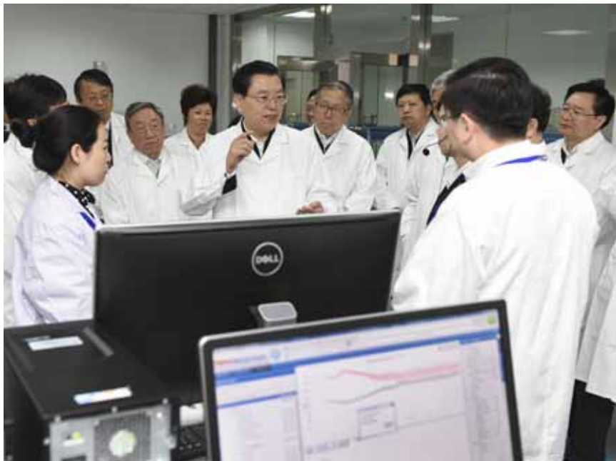
4月17日至20日，中共中央政治局常委、全国人大常委会委员长张德江在湖北省检查食品安全法实施情况。这是4月19日，张德江来到湖北省食品药品监督检验研究院，了解食品添加剂、农药残留、微生物等食品检验情况。

(2015年12月14日第十二届全国人民代表大会常务委员会第五十八次委员长会议原则通过 2015年12月26日第十二届全国人民代表大会常务委员会第五十九次委员长会议第一次修改 2016年4月15日第十二届全国人民代表大会常务委员会第六十七次委员长会议第二次修改)