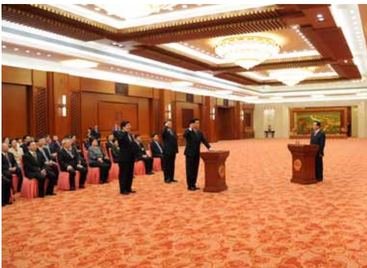
4月28日，十二届全国人大常委会在北京人民大会堂举行宪法宣誓仪式。全国人大常委会副委员长李建国主持并监誓。