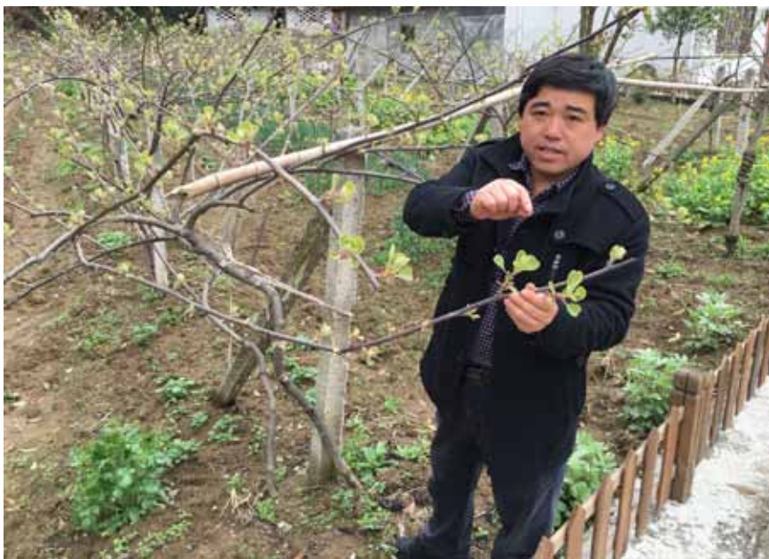
王光国向本刊记者介绍店子坪村猕猴桃的种植情况。

于发展产业,教育扶贫能够从根本上改变农民的落后思想,对农村未来的发展和建设有着深远的影响。在他调研的过程中,很多群众向王光国反应,由于教育体制改革,很多边远山区的学校被裁撤,大量农村适龄儿童只能到较远的集镇学校就读,为了照顾孩子,很多家长不得不在城镇陪读,这变相加重了家长的负担,已经成为严重的社会问题。2014年,关注农村教育的王光国在全国人代会上呼吁重视陪读农民工群体,并建议从完善我国基础教育和新农村建设着手,转变农村教育观念,将相关政策适当向农村落后地区倾斜,缩小教育质量差异,保障农村学生能够平等地接受教育。