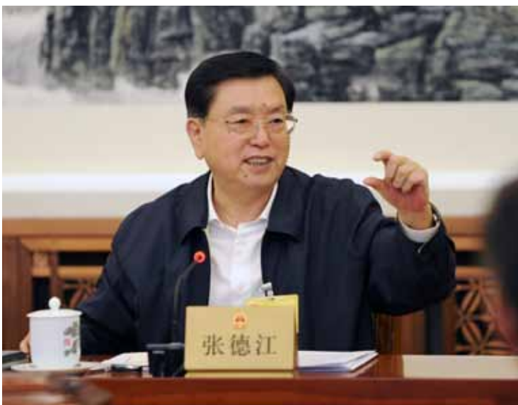
4月25日下午，十二届全国人大常委会第二十次会议举行分组会议，审议境外非政府组织境内活动管理法草案，审议关于批准《关于汞的水俣公约》的议案、关于个别代表的代表资格的报告和有关任免案。张德江委员长参加审议。