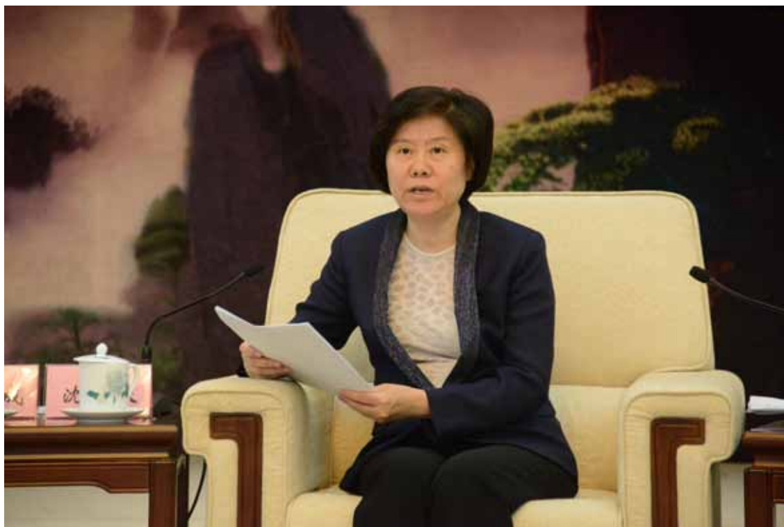
4月29日,深海海底区域资源勘探开发法实施座谈会在京召开,沈跃跃副委员长出席会议并讲话。

《中华人民共和国深海海底区域资源勘探开发法》经十二届全国人大常委会第十九次会议审议通过,并由国家主席习近平同志签署第42号主席令对外公布,于2016年5月1日起正式实施。这是第一部规范我国公民、法人或者其他组织在国家管辖范围以外海域活动的法律,对于我国全面实施海洋强国战略、积极履行国际义务具有重要意义。我们要充分认识这部法律的重要意义,准确把握法律的主要制度规范,推动有关各方