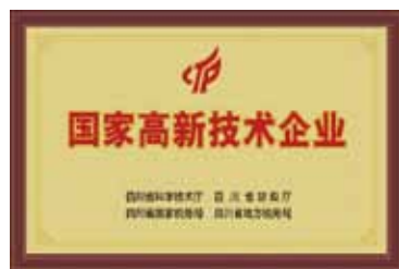
国家高新技术企业

“一个优秀的企业带给社会的是优良的产品，而一个伟大的企业能使社会更加美好，一同改善整个社会的环境”。这就是好医生药业集团的发展之道。