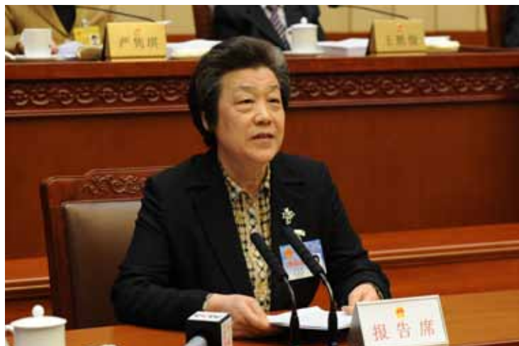
4月25日上午，十二届全国人大常委会第二十次会议举行第一次全体会议。受国务院委托，司法部部长吴爱英作关于“六五”普法决议执行情况的报告和提请审议关于深入开展法治宣传教育的决议草案议案的说明。