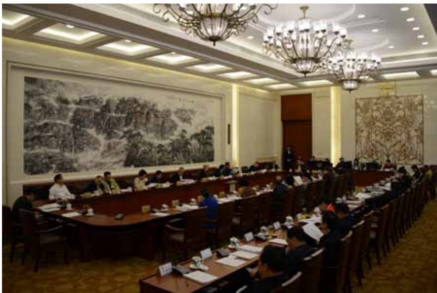
4月27日上午，十二届全国人大常委会第二十次会议分组审议野生动物保护法修订草案。

4月25日，十二届全国人大常委会第二十次会议再次审议野生动物保护法修订草案。就一审时各界提出的意见，二审稿增加：猎捕国家一级保护野生动物，仍由国务院野生动物保护主管部门批准；国家支持有关科研机构因物种保护目的从事国家重点保护野生动物的人工繁育；禁止生产、经营使用国家重点保护野生动物及其制品制作的食品，或者使用没有合法来源证明的非国家重点保护野生动物及其制品制作的食品；禁止为食用非法购买国家重点保护的野生动物及其制品等规定。