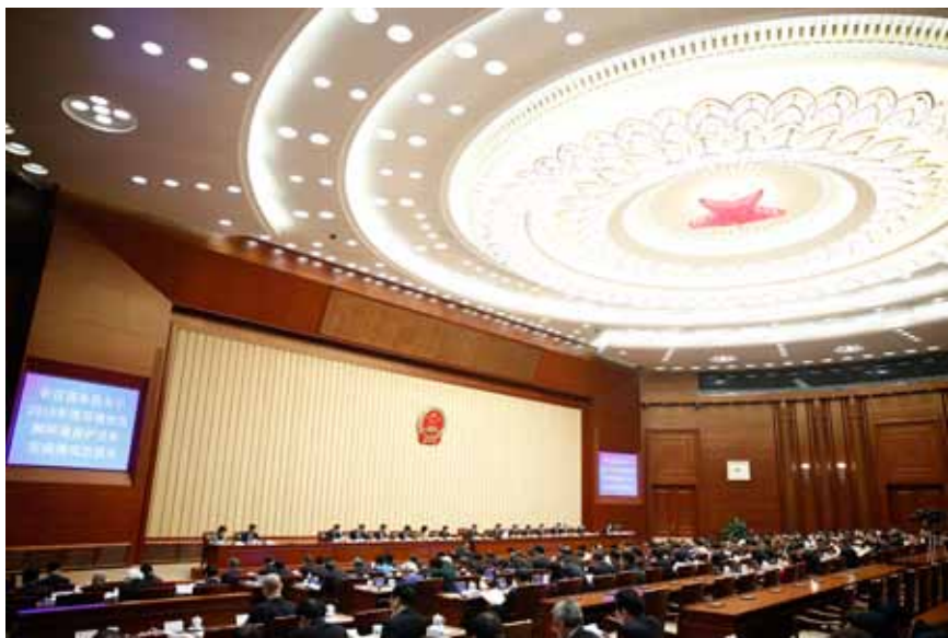
4月25日,《国务院关于2015年度环境状况和环境保护目标完成情况的报告》提请第十二届全国人大常委会第二十次会议审议。

4月召开的十二届全国人大常委会第二十次会议,有一项议程备受关注。那就是,国务院首次向全国人大常委会报告2015年度环境状况和环境保护目标完成情况。