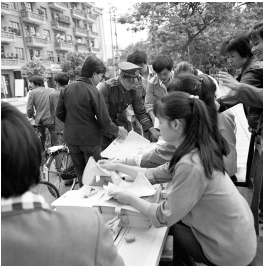
1986年6月5日,福建省龙岩市公安、司法等单位在大街上设立法制宣传咨询台,解答群众提出的问题。

我们商定先开四讲,并确定了四讲的内容和主讲人。1986年7月3日,中央书记处在中南海怀仁堂为中央领导干部举办了法律知识讲座第一讲,主讲人是中国人民大学法律系副教授孙国华,讲的是《法的基础理论》。中共中央政治局及书记处成员,中共中央纪律检查委员会、中央办公厅、中央政法部门、中