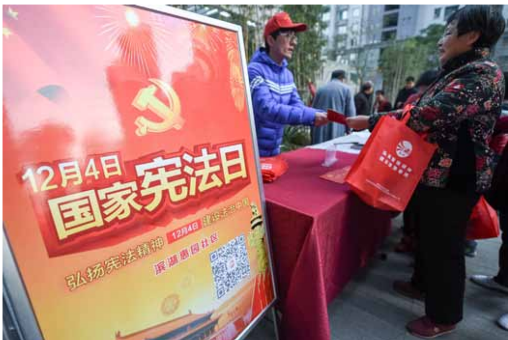
2015年12月3日，在合肥市烟墩街道滨湖惠园社区，工作人员向居民发放普法材料。

过去的30年，尽管我国普法工作取得了巨大成就，但与全面依法治国新要求 and 人民群众新期待相比，还存在着一些问题和不足。