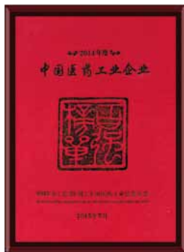
中国医药工业企业百强