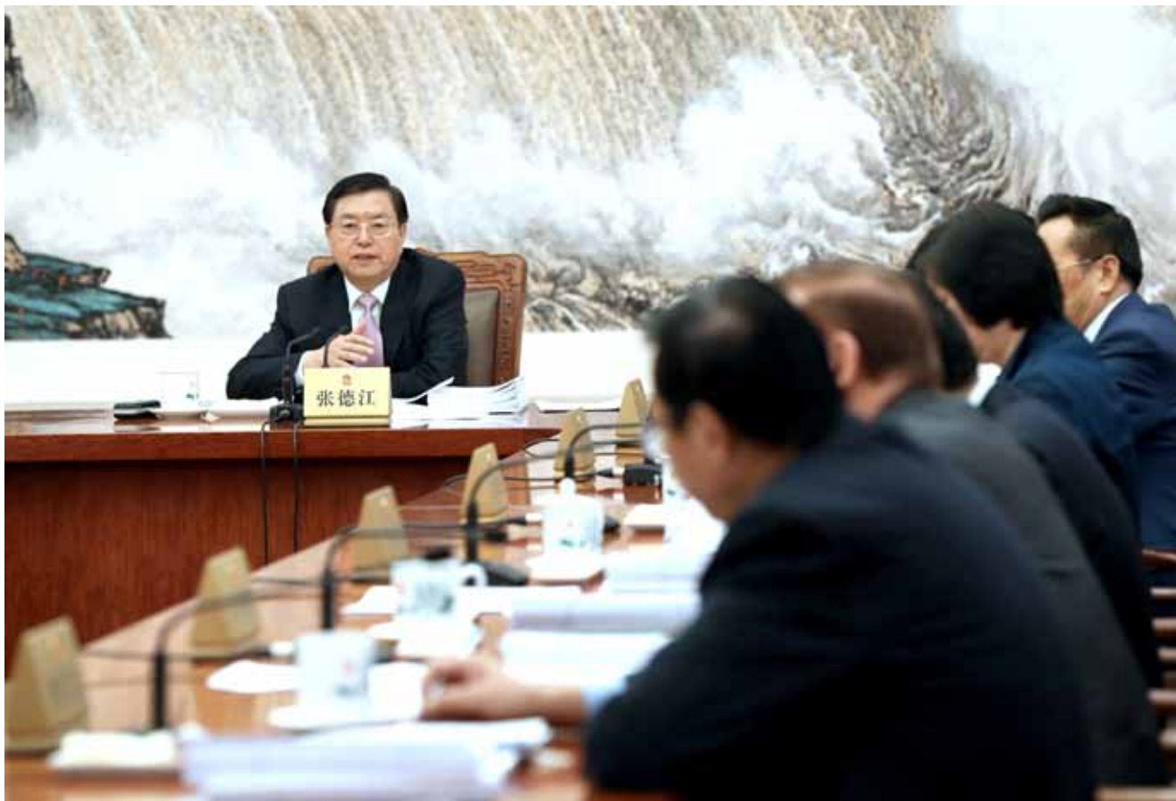
2015年12月14日，十二届全国人大常委会第五十八次委员长会议在北京人民大会堂举行。全国人大常委会委员长张德江主持会议。

（2015年12月14日第十二届全国人民代表大会常务委员会第五十八次委员长会议原则通过 2015年12月26日第十二届全国人民代表大会常务委员会第五十九次委员长会议第一次修改 2016年4月15日第十二届全国人民代表大会常务委员会第六十七次委员长会议第二次修改）