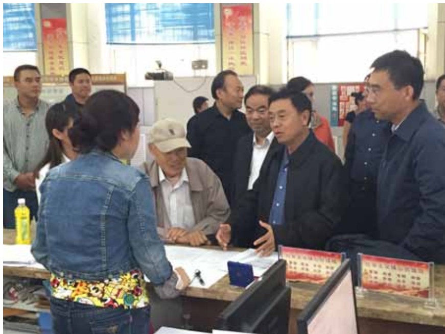
2016年4月3日,全国人大内务司法委员会副主任委员邓昌友赴黑龙江调研“六五”普法决议的实施情况。

全省有2.6万名县处级以上领导干部、23万名公务员接受了法律培训,每年有15万名公务员在线接受法制教育,1.7万余所中小学配备专职或兼职法制副校长(辅导员),建立法制教育基地800个。对重点对象普法带动了企业经营管理人、农村“两委”干部的普法,劳动用工、安全生产、土地承包经营、征地拆迁等方面法律有了更大范围的普及。