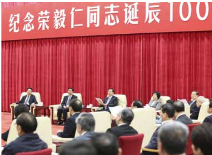
4月26日，纪念荣毅仁同志诞辰100周年座谈会在北京人民大会堂举行。中共中央政治局常委、全国人大常委会委员长张德江出席并讲话。