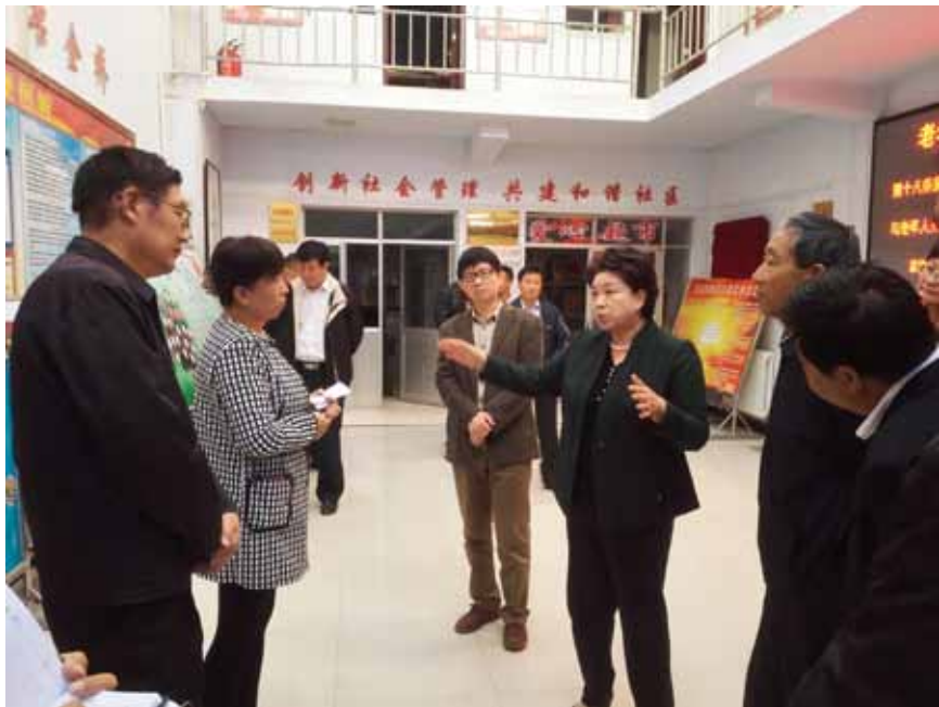
2016年4月3日,全国人大内务司法委员会副主任委员何晔晖赴青海调研“六五”普法决议的实施情况。

根据《全国人民代表大会常务委员会关于进一步加强法制宣传教育的决议》(以下简称“六五”普法决议)和中共中央、国务院转发的“六五”普法规划,2011年到2015年,在全体公民中开展了“六五”普法工作,取得明显成效。十二届全国人大常委会第二十次会议将听取和审议国务院关于“六五”普法决议执行情况的报告,并就继续开展“七五”普法工作作出决议。为配合审议国务院报告,2015年9月至12月,全国人大内务司法委员会组织调研组分赴天津、黑龙江、上海、江苏、安徽、福建、山东、重庆、云南、青海等地调研,了解“六五”普法决议执行情况,听取对深入开展“七五”普法工作的意见和建