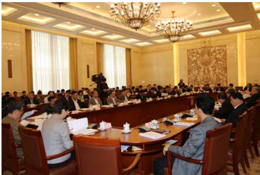
关于国务院及其有关部门制定实施民族区域自治法配套法规情况专题调研组第一次会议现场。

区域自治法配套法规规章和政策措施的工作是有成效的。截至2015年年底,我国除宪法外,现行有效的法律共246件、行政法规共743件,其中有117件法律、50件行政法规包含涉及民族方面的内容条款。但总体来看,与中央要求,与民族地区各族干部群众的要求,与贯彻实施民族区域自治法的要求,还有一定差距。配套法规规章和政策措施不健全不完善,仍然是影响民族区域自治法全面贯彻落实的主要原因。