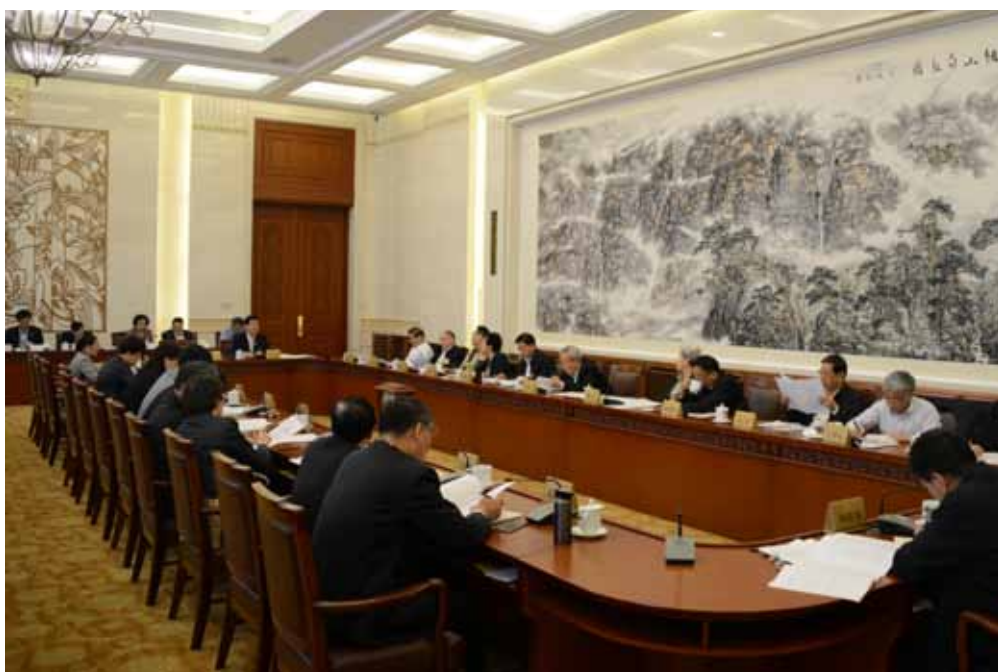
4月26日下午,十二届全国人大常委会第二十次会议分组审议国务院关于2015年度环境状况和环境保护目标完成情况的报告。