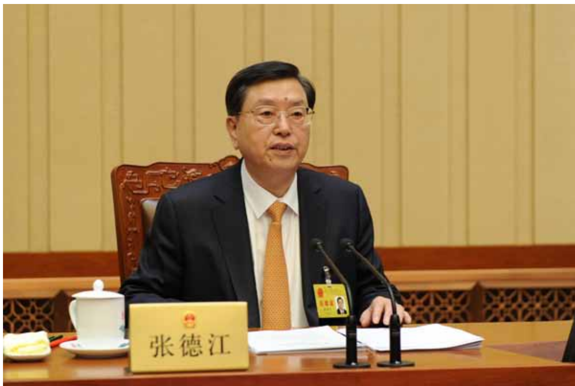
4月28日下午,十二届全国人大常委会第二十次会议举行闭幕会,张德江委员长主持会议并讲话。