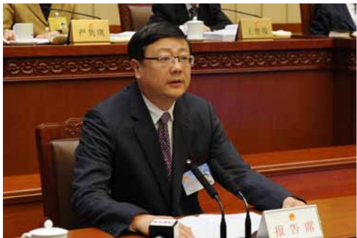
4月25日上午，十二届全国人大常委会第二十次会议举行第一次全体会议。受国务院委托，环境保护部部长陈吉宁作关于提请审议批准《关于汞的水俣公约》议案的说明和国务院关于2015年度环境状况和环境保护目标完成情况的报告。