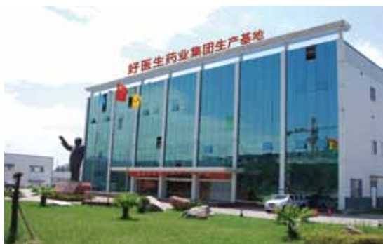
好医生药业集团生产基地（西昌）

“我们不单是在经营产品，更是在经营一份事业，一份关于人类健康的伟大事业。我们坚信，因为我们的共同努力，人类的健康品质就会不断提高。”十二届全国人大代表、好医生药业集团董事长耿福能在接受履职采访时如是说。